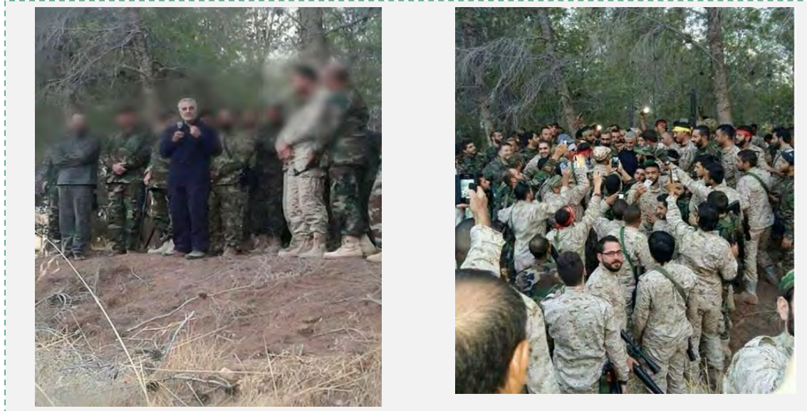
קאסם סלימאני מדבר בפני אנשי חזבאללה, ככה"נ באיזור לאד'קיה שבסוריה.

■ גם אמצעי תקשורת מערביים (רויטרס, גארדיאן, AP) דיווחו על תגבור משמעותי של כוחות איראנים בסוריה. דיווחים אלה הוכחו על-ידי איראן. חסין אמיר עבדאללהיאן ( Hossein Amir Abdollahian), סגן שר החוץ לענייני ערב ואפריקה, אמר בשבוע שעבר, כי איראן לא שלחה חיילים לסוריה אלא רק קבוצה של יועצים צבאיים בעלי ניסיון במאבק נגד הטרור, וזאת לבקשת ממשלת סוריה. הוא אישר, עם זאת, כי איראן הגדילה את מספר "היועצים הצבאיים" שלה בסוריה לבקשת המשטר הסורי כדי לסייע לו "במאבק נגד הטרור" (איסנ"א, 15 באוקטובר 2015; תאבנאכ, 20 באוקטובר 2015). גם משרד החוץ האיראני הכחיש את הדיווחים בנוגע לשליחת כוחות איראנים לסוריה. בהודעת משרד החוץ נאמר, כי לא נעשה כל שינוי ברמת שיתוף הפעולה של איראן עם סוריה שנועד "לסייע לסוריה במאבקה בטרור" (איסנ"א, 16 באוקטובר 2015).