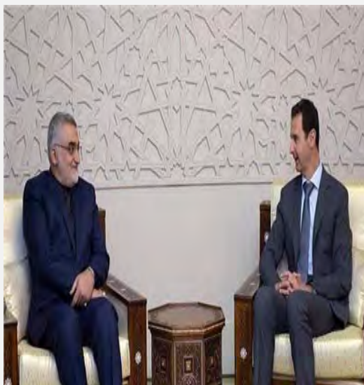
פגישת ברוג'רדי-אסד