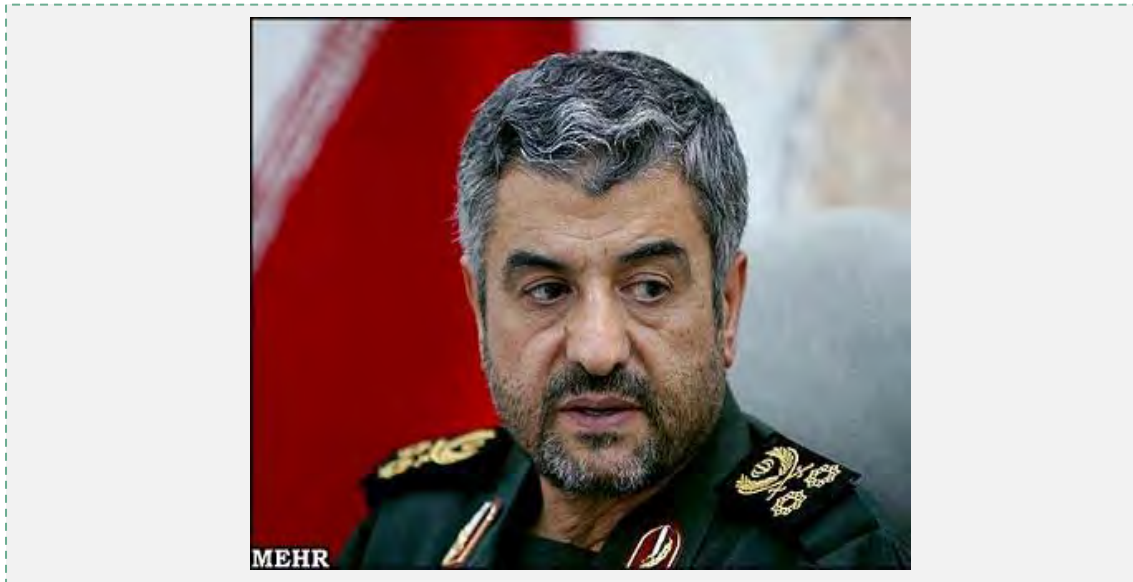
מפקד משמרות המהפכה, מחמד-עלי ג'עפרי.