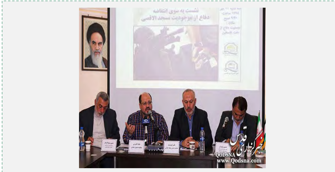
כנס התמיכה בפלסטינים בירושלים

בירושלים. בנאומו בפני באי הכנס אמר שיח' אלסלאם, כי "האנתיפאדה הנוכחית" מהווה הזדמנות פז להשבת שאלת פלסטין לראש סדר היום של העולם המוסלמי. הוא ציטט את דבריו של מכון המהפכה האסלאמית, איתאללה ח'מיני, לפיהם "גורל האסלאם ייקבע בפלסטין" (פארס, 13 באוקטובר 2015).