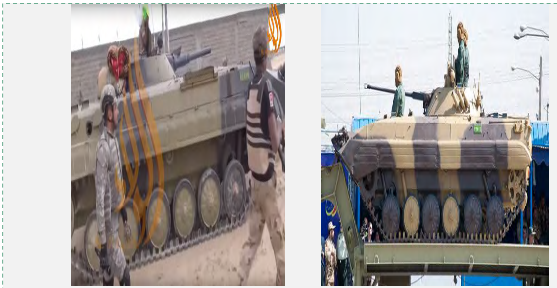
(חשבון הטוויטר @green_lemonn, 19 באוקטובר 2015).