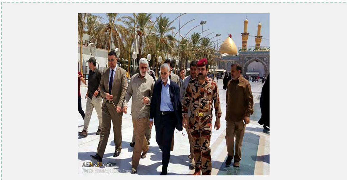
סלימאני בביקור בעיר כרבלא'א שביראק, אוגוסט 2015

■ ב-22 בספטמבר 2015 דיווח היומון אלשרק אלאוסט על תקרית, שהתרחשה בעת שאלעבאדי נתקל בדרכו לעיר בצרה בשיירת רכבי שרד, שנסעה לעבר שדה התעופה בבגדאד. כאשר שאל ראש הממשלה בנוגע לזהות הרכבים, נאמר לו כי הם נועדו לשימוש סלימאני שהיה אמור להגיע לבגדאד ולהיפגש עם אבו-מהדי אלמהנדס (Abu-Mehdi al-Muhandis), מפקד גדודי חזבאללה עיראק. אלעבאדי התרגז והינחה לעצור את שיירת המכוניות. על-פי מקור הדיווח, שמהימנותו אינה ברורה, אמר אלעבאדי כי אם סלימאני מעוניין לקיים ביקור רשמי בעיראק, הרי שעליו להודיע על כך לשלטונות, ואם ברצונו לבקר במדינה באופן פרטי, עליו לבקש ויזה. העיתון מסר, כי על רקע חילוקי הדעות בין אלעבאדי לסלימאני גבר חשש ראש ממשלת עיראק מפני ניסיונות להתנקש בחייו.