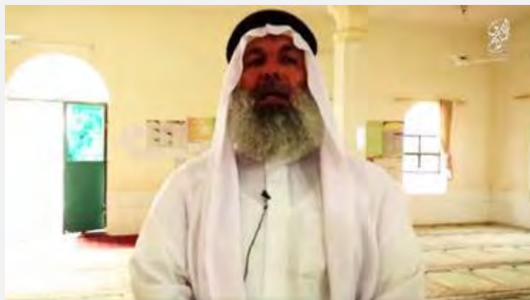
Иракский религиозный деятель, выступающий с критикой в адрес беженцев, покидающих исламское государство ("Асадарат Аль Дула Аль Исламия", 16 сентября 2015 г.)