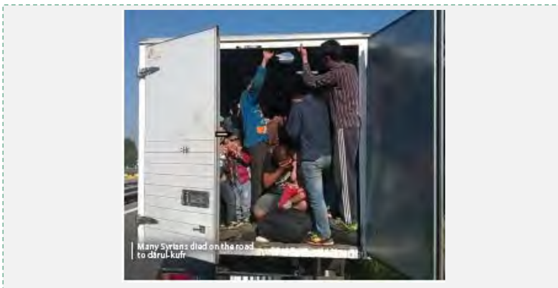
Использование угроз и запугивания: "Много сирийцев погибло на пути в страны неверных" ("Дабик", выпуск от сентября 2015 г.)