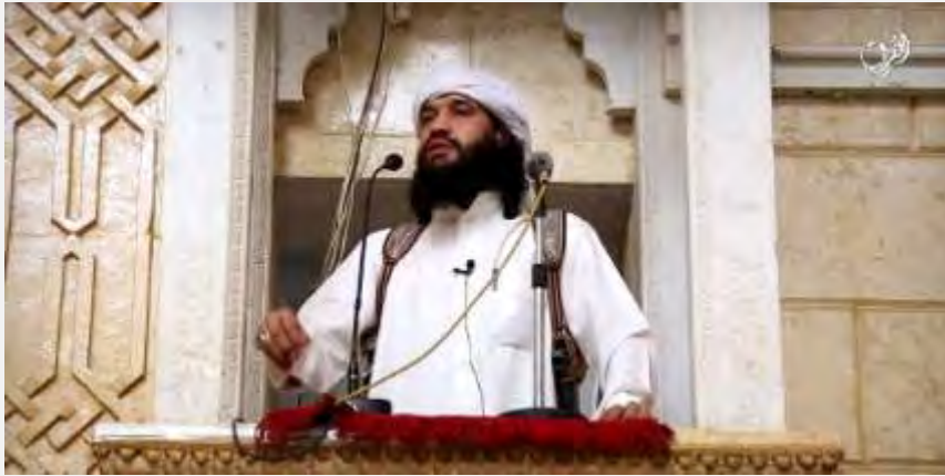
Активист округа Хасрамут организации ИГИЛ читает проповедь, прославляющую эмиграцию в страны ислама, и выступающую против эмиграции в страны Запада (блог akhbardawlatislam.wordpress , 17 сентября 2015 г.)

Г. В ролике, выпущенном округом Хасрамут организации ИГИЛ в Йемене , запечатлен активист организации ИГИЛ, читающий проповедь в мечети. Он отметил, что все мусульмане должны эмигрировать из стран неверных в "Дар Аль ислам", а не наоборот. По его утверждению, тот, кто живет в стране неверных, живет по их законам и приобщается к распущенности (блог akhbardawlatislam.wordpress , 17 сентября 2015 г.).