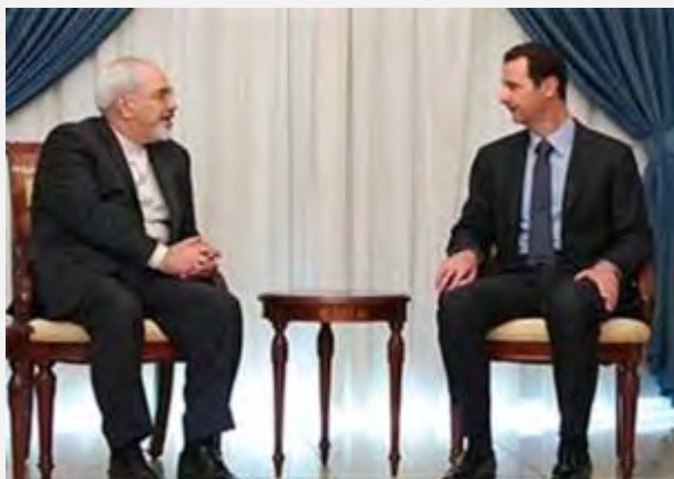
פגישת שר החוץ זריף והנשיא אסד

■ שר החוץ האיראני, מחמד-ג'ואד זריף (Mohammad Javad Zarif), ביקר ב-12 באוגוסט 2015 בסוריה ונפגש עם הנשיא אסד ועם שר החוץ וליד אלמעלם (Walid al-Mualem) כדי לדון עימם במשבר הנמשך בסוריה. זריף הדגיש את נחישותה של איראן להמשיך בתמיכתה בסוריה וציין שגורל סוריה צריך להיקבע על-ידי העם הסורי ללא התערבות זרה (אירנ"א, 12 באוגוסט 2015).