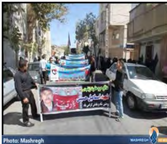
הלוויית ארבעת לוחמי חטיבת פאטמיון בדרום-טהראן

■ ראש הארגון האיראני לעליה לרגל הודיע, כי אזרחים איראנים יוכלו בקרוב לשוב ולעלות לרגל למקומות הקדושים לשיעה בסוריה בעקבות תיאום עם בכירים סורים ובאישור המועצה העליונה לביטחון לאומי. הוא ציין, שמשלחת סורית תגיע בקרוב לטהראן כדי לבחון דרכים לחידוש העלייה לרגל. איראן אסרה על עלייתם לרגל של אזרחיה לרגל לסוריה עם פרוץ מלחמת האזרחים במדינה בראשית 2012 (אירנ"א, 17 באוגוסט 2015)