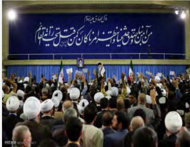
ח'אמנהאי בנאום בוועידת אגודת אהל אלבית

■ הנשיא חסן רוחאני אמר בנאום בפני באי הוועידה, כי המהפכה האסלאמית באיראן הצליחה להניף את דגל תחיית הדת ברחבי העולם. הוא הביא את ההתנגדות בלבנון מול ישראל, את התנועה האסלאמית בתורכיה ובצפון-אפריקה ואת התנועות האסלאמיות ברחבי העולם המוסלמי כדוגמאות להמשך התחייה האסלאמית שראשיתה במהפכה האסלאמית. רוחאני הדגיש בדבריו את הצורך באחדות אסלאמית ואמר, כי איראן דוגלת באחדות אסלאמית המתעלה מעל חילוקי הדעות בין שיעים לסונים. בהמשך דבריו התייחס רוחאני לגילויי הקיצוניות האסלאמית במזרח התיכון ואמר כי אלה הנוקטים באלימות והורסים מסגדים וכנסיות אינם מייצגים את האסלאם האמיתי (פארס, 15 באוגוסט 2015).