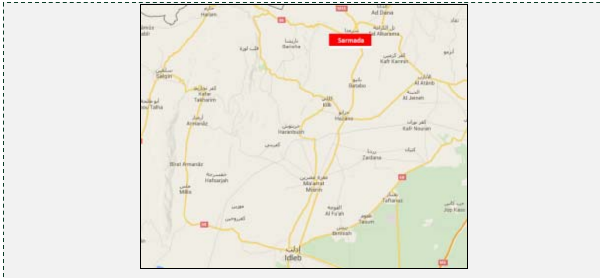
העיירה סרמדה, מצפון לאדלב, שבקרבתה נהרג מנהיג התארגנות ח'ראסאן (GOOGLE MAPS)

■ מחסין אלפאצ'לי היה מנהיג "קבוצת ח'ראסאן", התארגנות של פעילים ותיקים מאלקאעדה, השוהים בסוריה. התארגנות זאת תכננה לבצע פיגועים נגד ארה"ב ומדינות המערב. לדברי בכירים בארה"ב מחסין אלפאצ'לי, היה מודע לתכנון אירועי 11 בספטמבר 2001 והיה שותף לתקיפה נגד ספינות חיל הים של ארה"ב וצרפת בכווית באוקטובר 2002 (אתר משרד ההגנה של ארה"ב, 21 ביולי 2015).