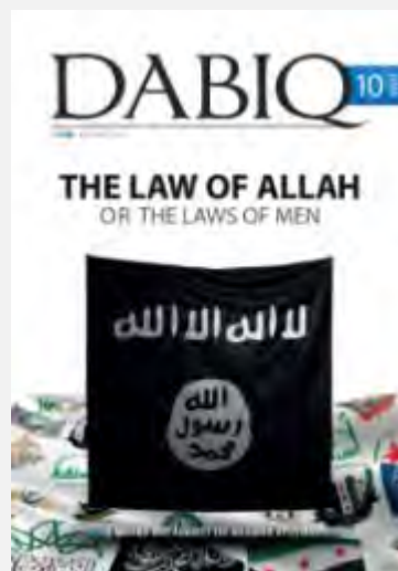
מימין: גיליון 10 של ביטאון דאעש באנגלית "דביק" משמאל: גיליון מס' 1 של ביטאון ג'בהת אלנצרה באנגלית "אלרסאלה" (יולי 2015)