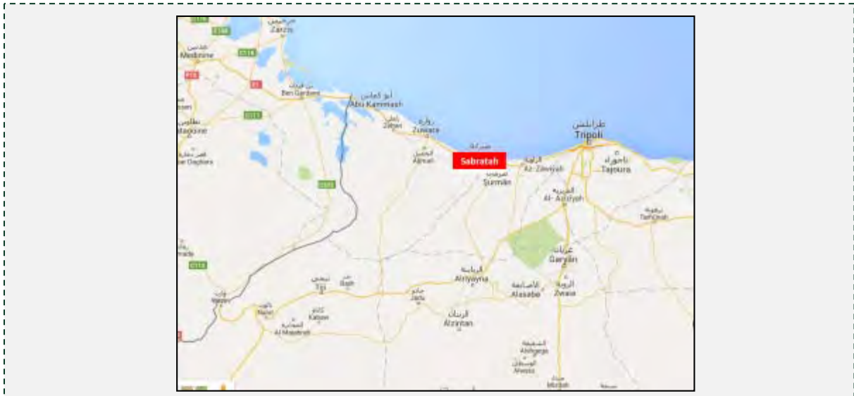
צבראתה, הממוקמת על הדרך שבין טיפולי לגבול של לוב עם תוניסיה (המקור: גוגל מפיס).