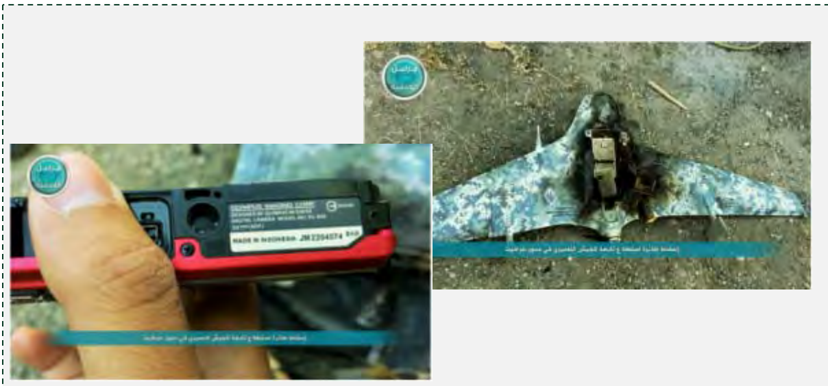
כלי הטיס הבלתי מאויש, שנטען, כי הוא הופל ע"י פעילי ג'בהת אלנצרה (חשבון טוויטר המזוהה עם הארגון, 21 ביולי 2015).

■ ב-23 ביולי 2015 הודיעו פעילי ג'בהת אלנצרה על פתיחת מערכה באזור ג'בל אלטרקמאן, שממזרח לעיר אלאד'אקיה במטרה להחזיר לעצמם את השליטה על מספר תילים עליהם השתלטו כוחות הצבא הסוריים כמה ימים קודם לכן (S.N.N, 23 ביולי 2015).