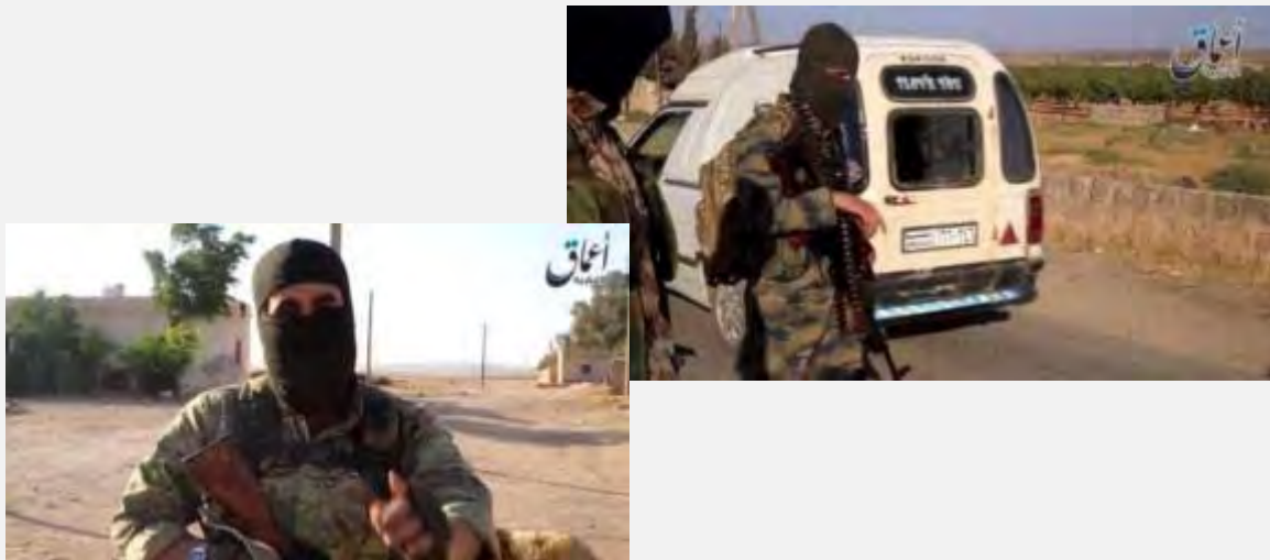
פעילי דאעש מאיישים מחסום באזור, שבשליטתם סמוך לגבול סוריה-תורכיה (أبو عبيدة المصري@khelafa28, 25 ביולי 2015).