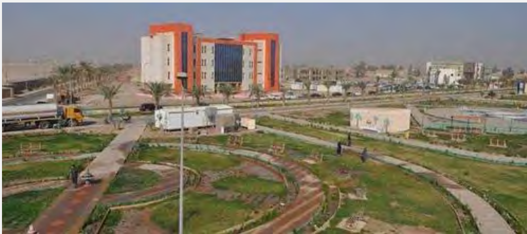
אוניברסיטת אלאנבאר שבאלרמאדי בצילום מלפני כשנה וחצי (חשבון הטוויטר محمد الفهداوي @moh_alfhdawe, 26 ביולי 2015).

■ באלרמאדי, שבמחוז אלאנבאר, אשר נכבשה ע"י דאעש, עדיין נמשכים קרבות שליטה בין דאעש לבין צבא עיראק. צבא עיראק הודיע ב-26 ביולי 2015, כי הצליח לטהר את אוניברסיטת אלאנבאר שבאלרמאדי, אשר שימשה כמפקדה עבור פעילי דאעש (סוכנות הידיעות הצרפתית, 26 ביולי 2015). על-פי טענת מקורות צבאיים ואזרחיים עיראקיים, לדאעש יש עתה אחיזה מועטה באלרמאדי, המצטצמת לאזור המבנים הממשלתיים ובמספר כניסות לעיר (אלערביה, 25 ביולי 2015). מנגד דווח, כי פעילי דאעש הצליחו לבצע סדרה של פיגועי התאבדות בעיר שגרמה למותם של שישים חיילים עיראקיים ולפציעתם של חמישים נוספים (חשבון הטוויטר ثورة العراق السنّي @r_885, 27 ביולי 2015). תמונת המצב באלרמאדי אינה ברורה לנו בשלב זה.