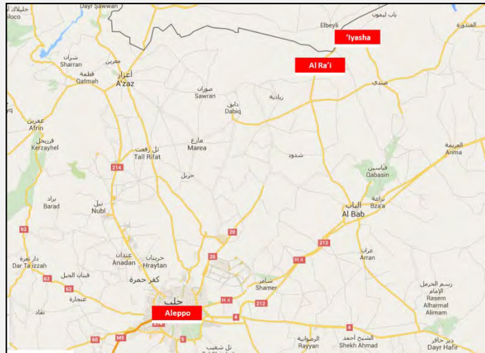
שני הכפרים אלרעי ועיאשה, שמצפון לחלב, שבסביבתם הותקפו יעדי דאעש.