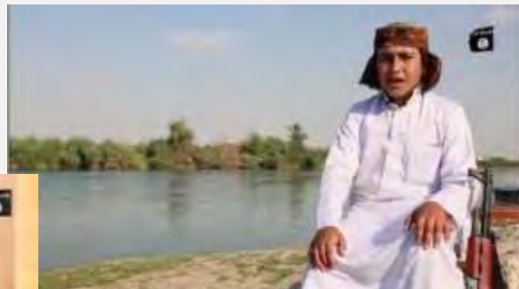
מימין: אחד הילדים מתבטא, כי אללה ציווה את הג'האד למאמינים. משמאל: "תודה לאללה, שציווה את הג'האד... אנו בדרכנו להגיע לרומא" (אתר שיתוף הקבצים https://archive.org , 23 ביולי 2015).