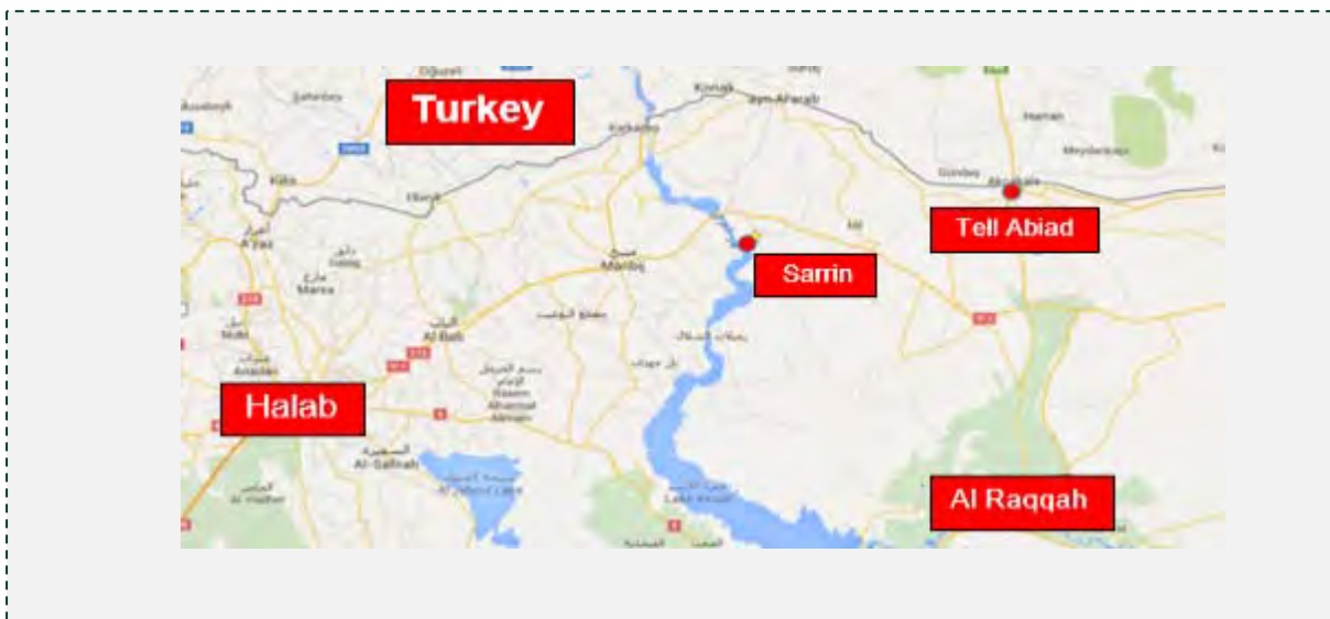
העיירות תל אביצ' וצרין סמוך לגבול סוריה תורכיה.

■ ב-25 ביולי 2015 פורסם בחשבון הטוויטר של רשת CNN בערבית, כי ארגון דאעש פוצץ שתי מכוניות תופת נגד עמדות של הכוחות הכורדים (YPG). מכונית אחת התפוצצה בקרבת העיר תל אביצ', סמוך לגבול סוריה-תורכיה, ומכונית נוספת בקרבת העיירה צרין, שממערב לה (cnnarabic@العربية, 25 ביולי 2015).