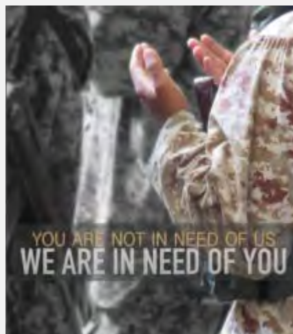
מתוך גיליון 1 של אלרסאלה של ג'בהת אלנצרה: מימין: כרזה לגיוס לג'בהת אלנצרה שכותרתה: " We are in need of you". משמאל: כתבה בגנות המדינה האסלאמית

נראה כי המלחמה התודעתית בין דאעש ובין ג'בהת אלנצרה המתנהלת בשפה האנגלית, עלתה לאחרונה מדרגה. היא נועדה בראש ובראשונה לגייס את ציבור המתנדבים המערביים הפוטנציאליים , כאשר כל ארגון מנסה למשוך את ציבור המתנדבים לשורותיו . בראיית דאעש וג'בהת אלנצרה נודעת למתנדבים ממדינות המערב חשיבות רבה כלוחמים, אנשי ממשל ומנהלה ואף כפעילי טרור פוטנציאליים לעתיד.