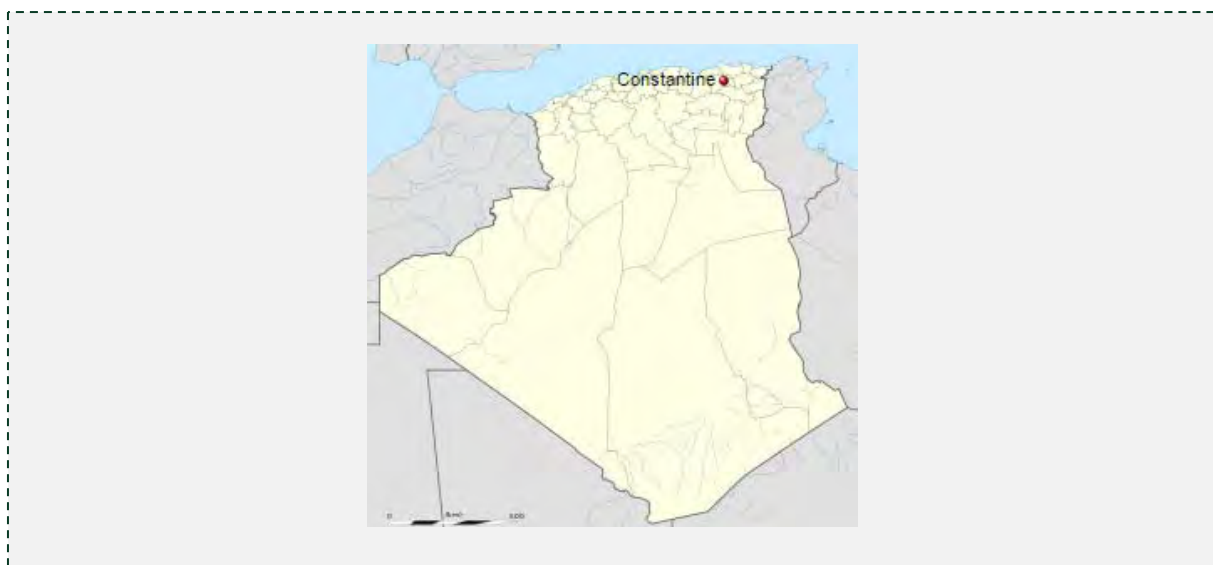
העיר קונסטנטין, שבצפון אלג'יריה.

■ בקלטת שמע, שהופצה ב-25 ביולי 2015, נשמע נציג התארגנות אסלאמית ג'האדיסטית הפועלת באלג'יריה בשם פלוגת הזרים של העיר קונסטנטין , נשבע אמונים למנהיג דאעש (Constantine), עיר חוף הסמוכה לגבול אלג'יריה עם לתוניסיה). בקלטת ציין הדובר, כי הארגון פעל בעבר במסגרת אלקאעדה. ההתארגנות קראה לכל המוסלמים להתאחד סביב מנהיג דאעש אבו בכר אלבע'דאדי (אתר שיתוף הקבצים /ia801500.us.archive.org/, 25 ביולי 2015).