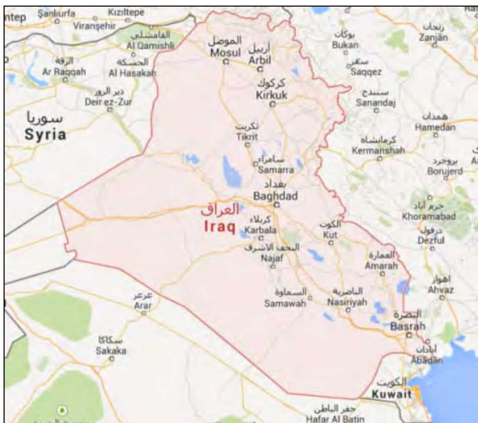
מפת עיראק