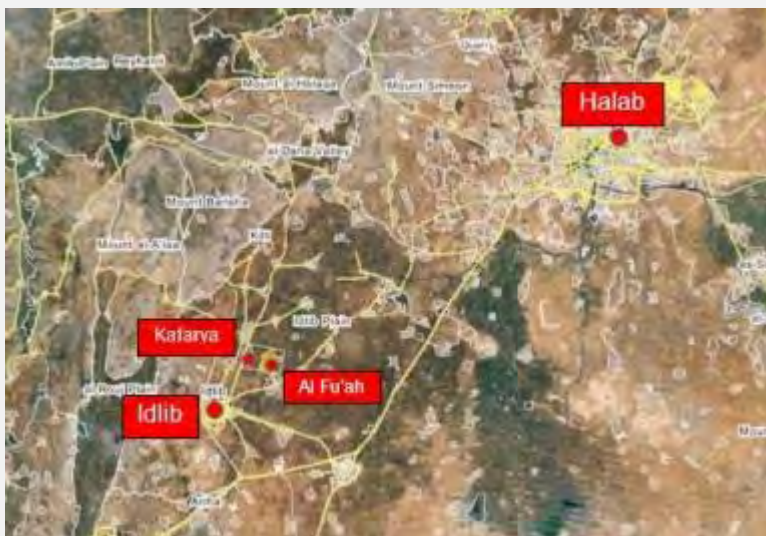
אלפועה וכפריא, שני עיירות שיעיות בקרבת אדלב, הנתונות להתקפות של דאעש (Wikimapia).

■ באזור העיר אלזבדאני, שמצפון מערב לדמשק, נמשכו הקרבות בין צבא אלפתח בראשות ג'בהת אלנצרה לבין כוחות הצבא הסורים בסיוע חזבאללה. בתקשורת הסורית דווח, כי צבא אלפתח מנסה להקל את הלחץ על אלזבדאני ע"י יוזמות צבאיות נגד אלפועה וכפריא, שתי עיירות שיעיות בקרבת אדלב הנאמנות למשטר הסורי ונגד מוצבים של חזבאללה בצפון מחוז חלב (All4Syria, 25 ביולי 2015).