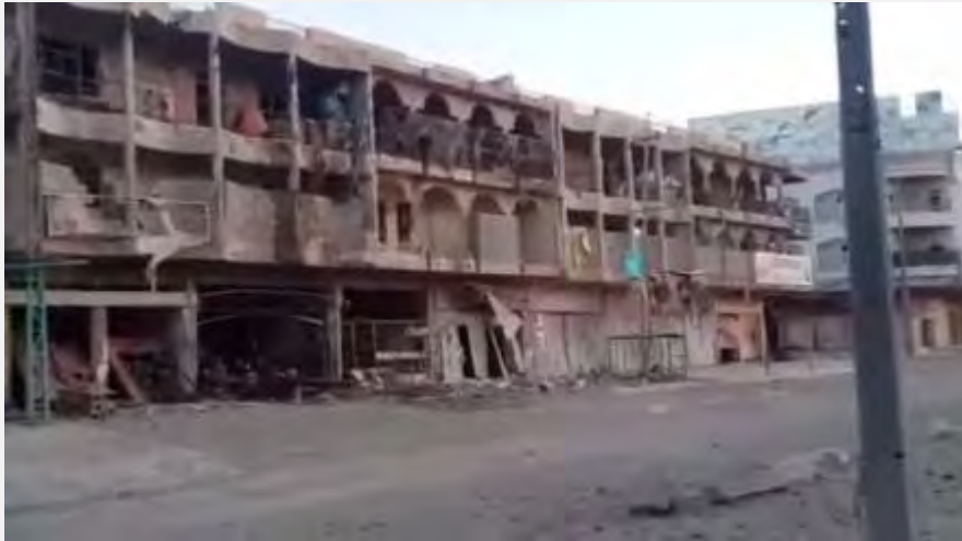
ממראות ההרס בעיר פלוג'ה (יוטיוב, 21 ביולי 2015).