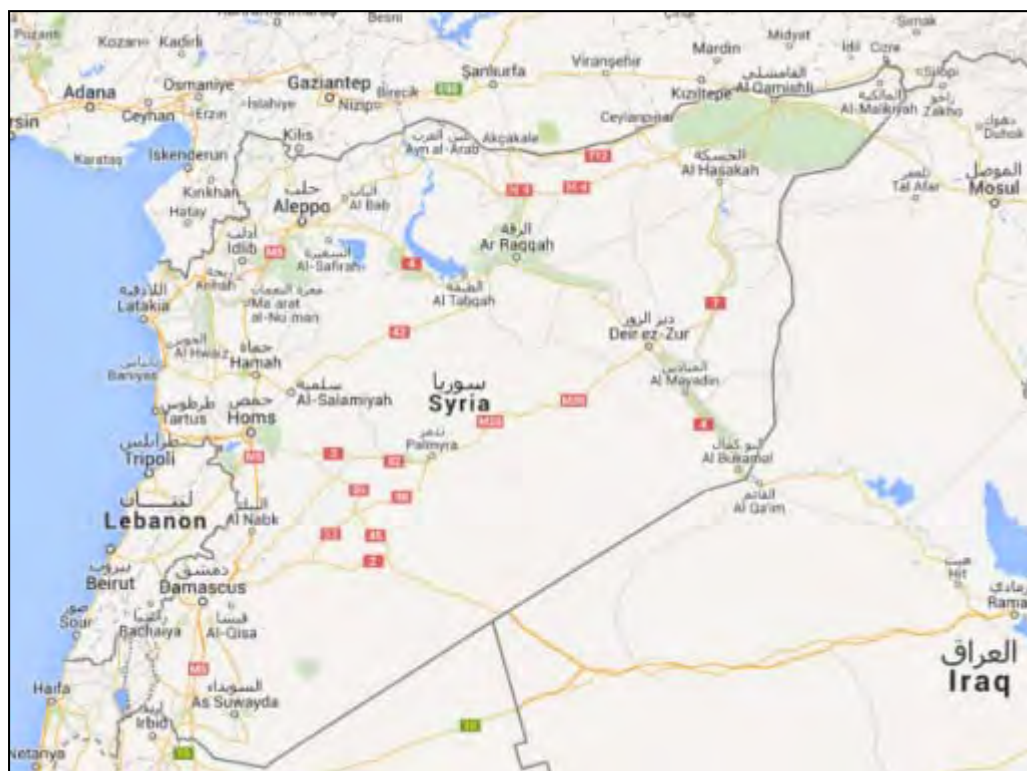
מפת סוריה