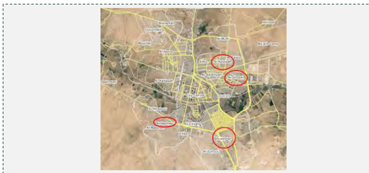
שכונות באלחסכה, שבהם קיימת נוכחות של דאעש: ע'ויראן (Ghuwayran), שבחלקה הדרומי; אלנשוה (Al Nashwah), שבחלקה הדרום-מערבי; אלעזיזיה (Al Aziziyah), שבחלקה הצפון מזרחי ואלע'זאל (Al Ghazal), שבחלקה המזרחי (Wikimapia).