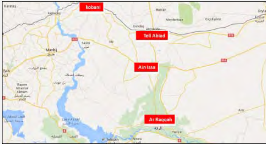
העיירה עין עיסא, שמדרום לתל אביצ'.

כיבוש העיירה עין עיסא והבסיס הצבאי שבקרבתה מעידים, כי הכוחות הכורדים מנסים להרחיב את אזור שליטתם בתל אביצ' לכיוון דרום. פעילות זאת מאיימת על עורפה של אלרקה, "עיר הבירה" של דאעש, ומאלצת את הארגון להקצות תגבורות לבלימת התקדמות הכוחות הכורדים מתל אביצ' דרומה.