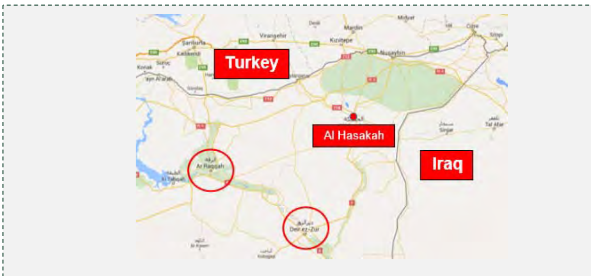
העיר אלחסכה, שבצפון-מזרח סוריה, מדרום מערב לעיר נמצאת אלרקה, "עיר הבירה" של דאעש