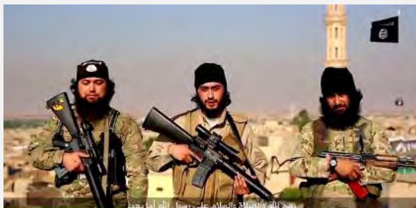
פעילי דאעש בעיראק ממוצא קווקזי מברכים את הג'האדיסטים מהקווקאז על הצטרפותם לדאעש (אצדאראת אדולה אלסלאמיה, 27 ביוני 2015).