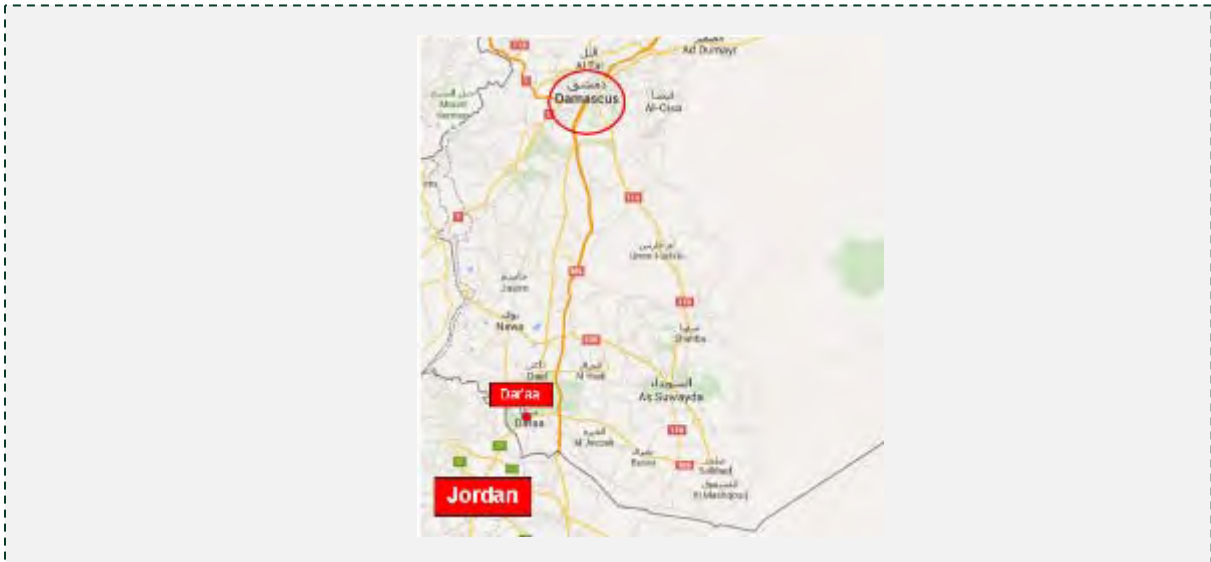
העיר דרעא (Dar'aa) והכביש הראשי (M5) המוביל לדמשק (Google Maps).