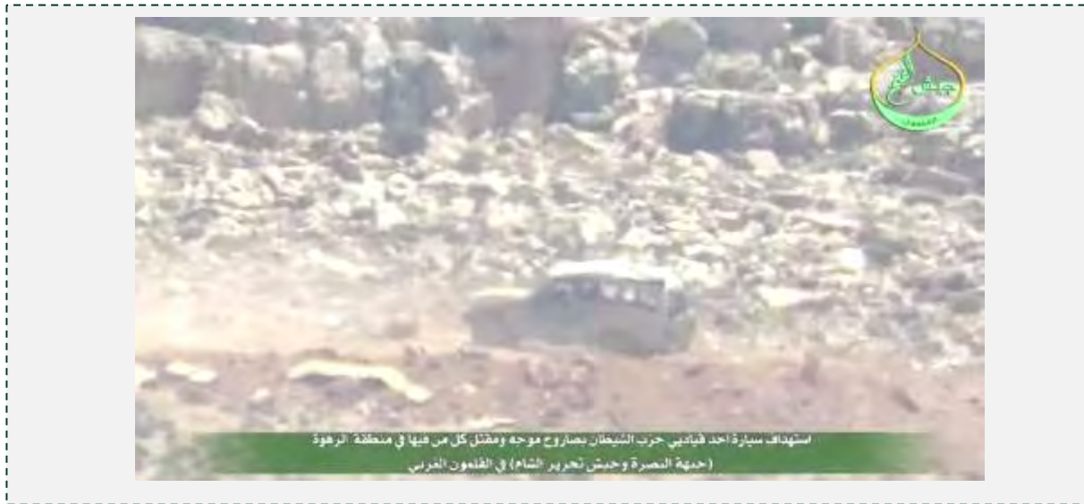
ג'יפ חזבאללה, שנפגע מטיל נ"ט שנורה באזור אלרהוה, שבהרי אלקלמון המערביים ( Ahmad Alqusair@AhmadAlqusair, 29 ביוני 2015; יוטיוב, 28 ביוני 2015).

■ ב-29 ביוני 2015 הועלה סרטון ביוטיוב בו נראה שיגור טיל נ"ט נגד ג'יפ שנטען, כי הוא שייך לאחד ממפקדי חזבאללה. הירי התרחש באזור אלרהוה (Al Rahwe), שבהרי אלקלמון המערביים, כ-8.5 ק"מ דרומית-מזרחית לערסאל, באזור שבו פועל ג'בהת אלנצרה. בסרטון נטען, כי כל נוסעי הג'יפ נהרגו (Ahmad Alqusair@AhmadAlqusair, 29 ביוני 2015; יוטיוב, 28 ביוני 2015).