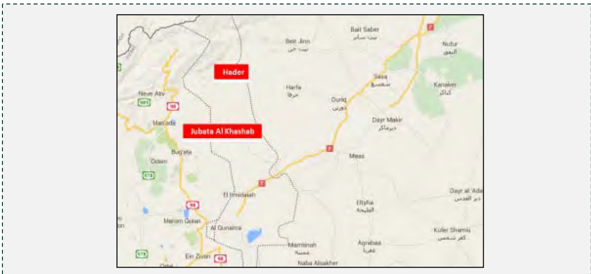
הכפר הדרוזי חצ'ר ואזור ג'באתא אלח'שב, שבצפון רמת הגולן.

■ גם השבוע התנהלו עימותים מקומיים באזור הכפר הדרוזי חצ'ר, שבצפון רמת הגולן. העימותים התנהלו בין כוחות הביטחון הסוריים, שתוגברו בפעילי חזבאללה, לבין כוחות המורדים באזור המכונה "גבעות אלחמר", שבקרבת חצ'ר. במהלך הלחימה באזור דווח על ארבעה הרוגים מכוחות המורדים ועל שמונה הרוגים בקרב פעילי חזבאללה (טוויטר, 27 ביוני 2015). ב-28 ביוני 2015 דווח, כי התנהלו עימותים בין כוחות הסורים לבין המורדים, ביניהם פעילי ג'בהת אלנצרה, באזור ג'באתא [אלח'שב] ובחצ'ר (עמוד הפייסבוק חצ'ר אלחדת', 28 ביוני 2015).