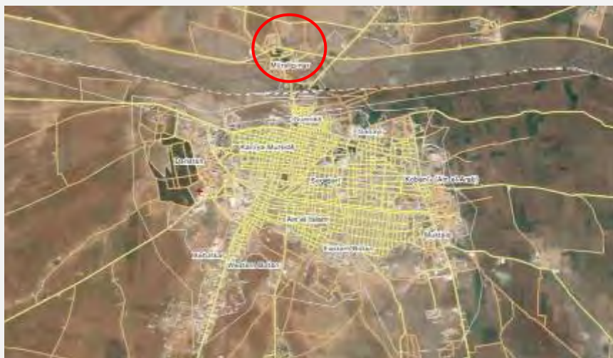
העיר קובאנה ומצפון לה מעבר הגבול בין סוריה לתורכיה (Wikimapia).

■ ב-27 ביוני הודיעו הכוחות הכורדים, כי הצליחו לדחוק את פעילי דאעש מהעיר קובאנה (Syriahr.com, 27 ביוני 2015). פיקוד המרכז של צבא ארה"ב דיווח על עשר תקיפות אוויריות, שביצעו כוחות הקואליציה באזור קובאנה ב-25 ביוני 2015, כסיוע אווירי לכוחות כורדים (אתר CENTCOM, 25 ביוני 2015).