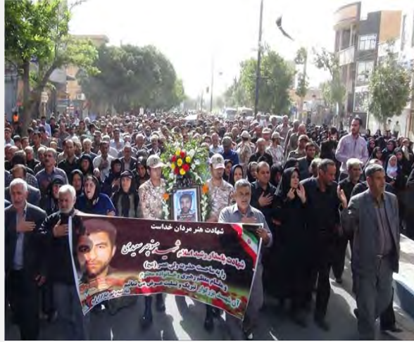
הלווית מנוצ'הרסעידי, ( פארס, 14 ביוני 2015 )

■ בעקבות כיבוש העיר המאדי על-ידי דאעש ניסו בכירים איראנים להרגיע מפני האפשרות שדאעש יתקרב לגבול איראן-עיראק. מזכיר המועצה העליונה לביטחון לאומי, עלי שמח'אני (Ali Shamkhani) הצהיר כי דאעש כבר ניסה מספר פעמים בעבר להרחיב את הלחימה לגבולות איראן, אך אין ביכולתו לעשות זאת (אירנ"א, 31 במאי 2015). ראש המטה הכללי של הכוחות המזוינים האיראנים, חסן פירוזאבאדי (Hassan Firouzabadi), טען, אף הוא, כי אין לדאעש האומץ להתקרב לגבולות איראן. הוא ציין, כי איראן נחושה לחסל את הארגון בכל מקום שבו הוא יתקרב למרחק של 40 ק"מ מהגבול (איסנ"א, 2 ביוני 2015).