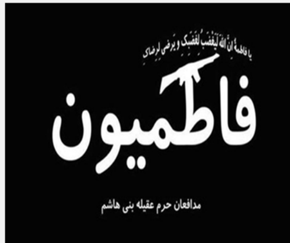
סמל חטיבת הפאטמים

■ הלוחם האפגאני מסר שלוחמי החטיבה מקבלים "שמות ג'האדים" המשמשים גם את חבריהם כדי, שלא יהיה ניתן לזהותם. לדבריו, היו מקרים בעבר שבהם בני משפחותיהם של הלוחמים האפגאנים קיבלו איומים על חייהם, ובמקרים בודדים אף נרצחו, בשל השתתפות יקיריהם בלחימה. הוא הלין על כך שחרף השתתפות הלוחמים האפגאנים בלחימה בסוריה, התושבים האפגאנים באיראן עדיין זוכים ליחס בלתי-ראוי.