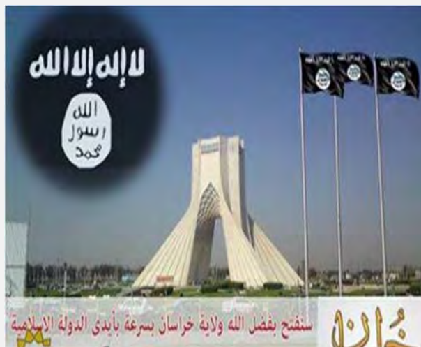
איום של דאעש על איראן כרזה, שהתפרסמה בתקשורת האיראנית בה נראים דגלי דאעש על רקע מגדלי אזאדי בטהראן.

■ בעקבות כיבוש העיר המאדי על-ידי דאעש ניסו בכירים איראנים להרגיע מפני האפשרות שדאעש יתקרב לגבול איראן-עיראק. מזכיר המועצה העליונה לביטחון לאומי, עלי שמח'אני (Ali Shamkhani) הצהיר כי דאעש כבר ניסה מספר פעמים בעבר להרחיב את הלחימה לגבולות איראן, אך אין ביכולתו לעשות זאת (אירנ"א, 31 במאי 2015). ראש המטה הכללי של הכוחות המזוינים האיראנים, חסן פירוזאבאדי (Hassan Firouzabadi), טען, אף הוא, כי אין לדאעש האומץ להתקרב לגבולות איראן. הוא ציין, כי איראן נחושה לחסל את הארגון בכל מקום שבו הוא יתקרב למרחק של 40 ק"מ מהגבול (איסנ"א, 2 ביוני 2015).