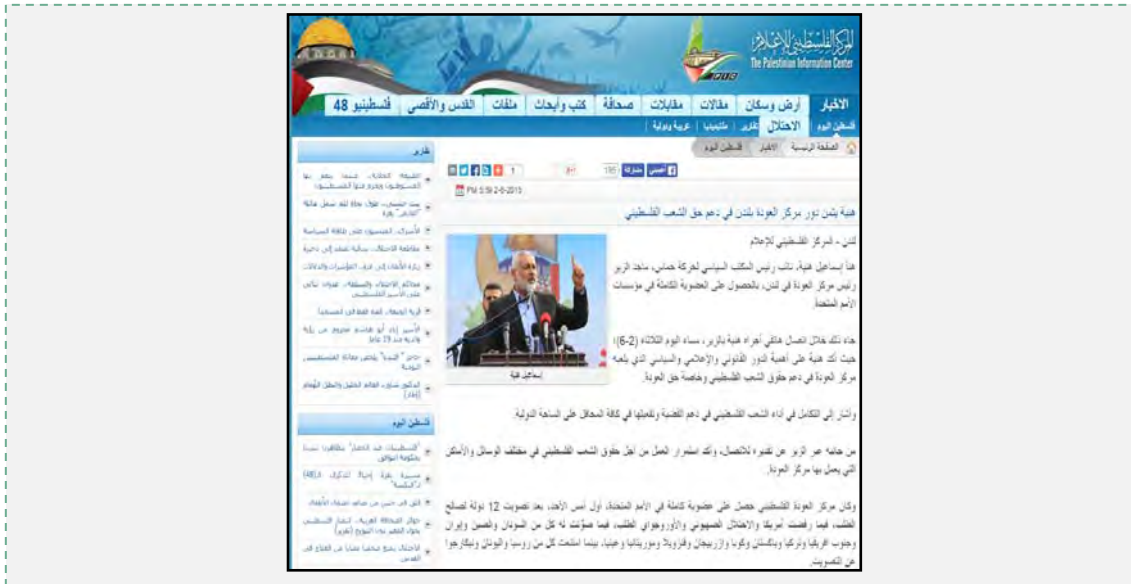
נוסח ההודעה כפי שהופיעה באתר חמאס בערבית (PALINFO, 2 ביוני 2015). ההודעה דווחה גם באתר בטאון חמאס אלרסאלה.