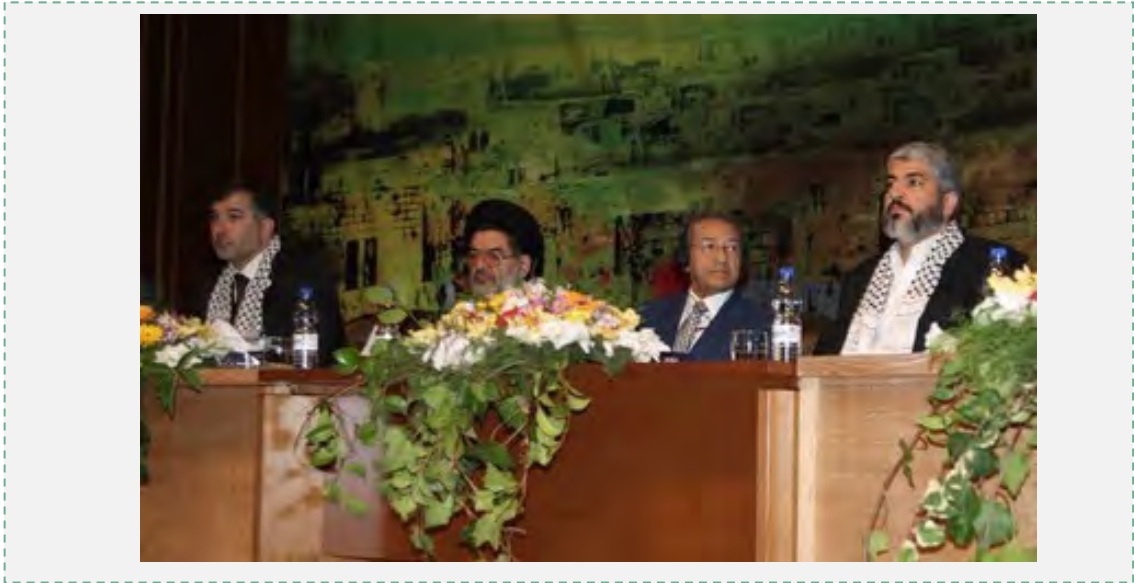
מאג'ד אלזיר (משמאל) בקונגרס בדמשק, שעסק ב"זכות השיבה" (בנובמבר 2008). לצידו יושבים (משמאל לימין) הנציג האיראני עלי אכבר מחתשמי-פור (שמילא תפקיד מרכזי בהקמת חזבאללה), מהאתיר מחדד (נשיא מלזיה בעבר הידוע בהתבטאויותיו האנטישמיות) ומנהיג חמאס ח'אלד משעל