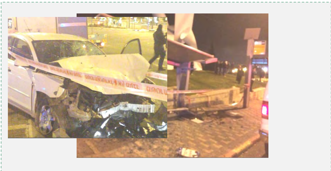
פיגוע דריסה בגבעה הצרפתית בירושלים. אדם אחד נהרג ואישה נפצעה באורח קשה. מימין: זירת האירוע.. משמאל: מכוניתו של הדורס (דוברות כבאות והצלה, 16 באפריל 2015)

4. ב-16 באפריל 2015, בשעות הערב המאוחרות נפגעו בצומת הגבעה הצרפתית אישה וגבר בשעה שעמדו בתחנת האוטובוס. נהג הרכב הפוגע הגיע בנסיעה מהירה לאזור הגבעה הצרפתית, סטה ממסלולו ופגע בשני האזרחים, שעמדו בתחנה. הגבר נפצע באורח אנוש ונפטר בבית החולים והאישה נפצעה באורח קשה. ההרוג בפיגוע הינו שלום יוחאי שרקי בן 25 מירושלים. הנהג הפוגע, שנפצע באורח קל, הוא ח'אלד קוטינה , בן 37, מהכפר ענאתא החדשה . הוא נעצר ונחקר. מחקירתו עלה החשד, כי המדובר בפיגוע דריסה ולא בתאונת דרכים. מעצרו הוארך והאירוע עדיין נחקר.