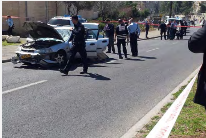
זירת פיגוע הדריסה בירושלים בו נפצעו חמישה בני אדם (6 במרץ 2015)

2. המחבל הוא מחמד סלימה, בן 22, תושב שכונת ראס אלעמוד בירושלים, בעל עבר פלילי. על-פי התקשורת הישראלית הוא אינו מוכר לכוחות הביטחון הישראליים כפעיל באחד מארגוני הטרור. לטענת הפלסטינים הוא ביצע את הפיגוע בעקבות דיווחים, ברשתות החברתיות, על פגיעה במתפללים מוסלמים בהר הבית. יום לפני הפיגוע הוא העלה בדף הפייסבוק שלו את תמונתו עטוף בדגל פלסטיין ולצידה הכיתוב: "בקרוב למען אללה והמולדת". לאחר הפיגוע ניתצו רעולי פנים מצבות בבית הקברות היהודי בהר הזיתים, לא הרחק מביתו של מבצע פיגוע הדריסה.