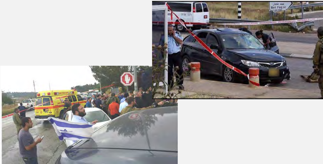
מימין: כלי הרכב הדורס. משמאל: זירת פיגוע הדריסה בצומת אלון שבות, שבגוש עציון