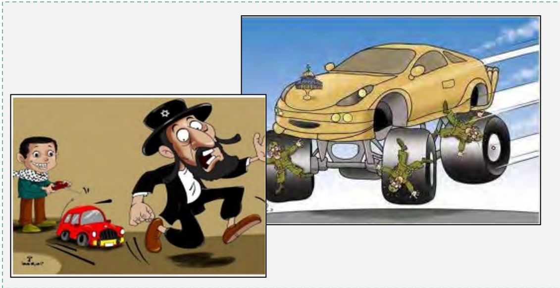
מימין: קריקטורה, שהתפרסמה בדף פייסבוק של חמאס המעודדת פיגועי דריסה נגד חיילי צה"ל (דף הפייסבוק PALDF, 26 באפריל 2015). משמאל: קריקטורה של אומיה גח'א תחת הכותרת "נשק האימה" (פורום PALDF, 11 בנובמבר 2014)