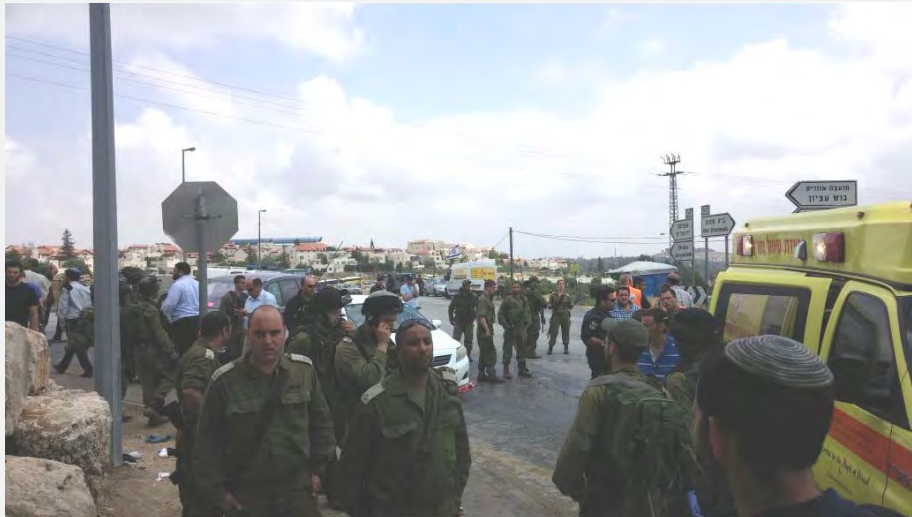
מיקום פיגוע הדריסה בצומת אלון שבות שבגוש עציון (סוכנות תצפית 14 במאי 2015, צילום דוברות מועצה אזורית שומרון)