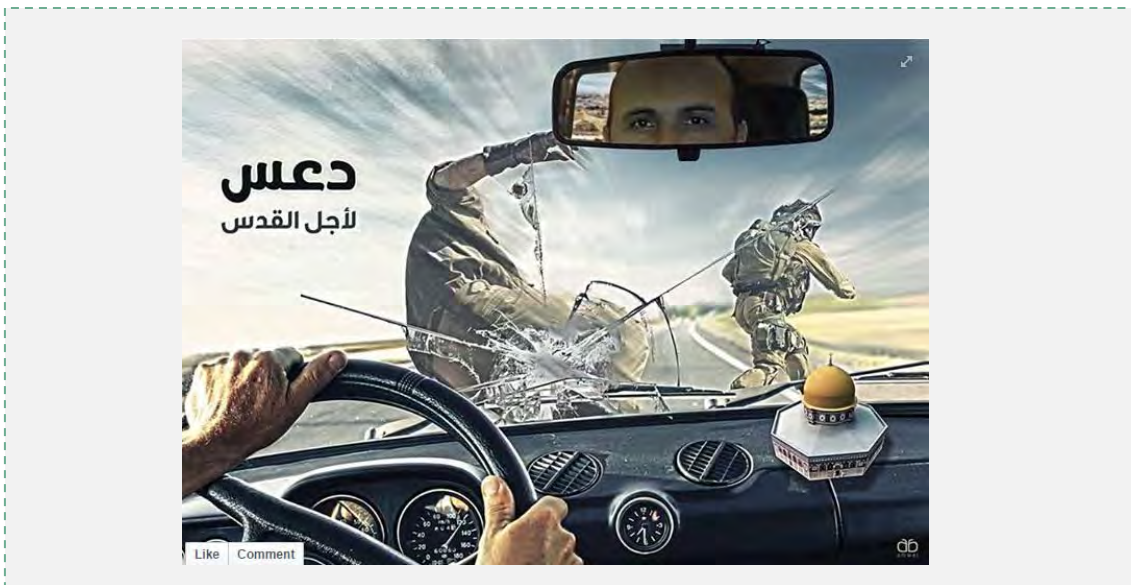
רקע תמונת הפרופיל בדף הפייסבוק של גולש המזוהה עם סיעות הסטודנטים של חמאס ביהודה ושומרון, המדבר בזכות פיגועי הדריסה. בתמונה נכתב "דרוס למען ירושלים"