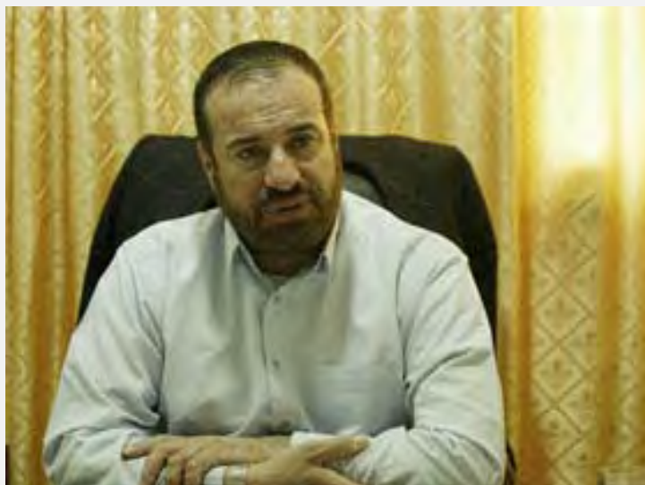
פתחי חמאד, מי שהיה שר הפנים בממשל חמאס, אשר חשף את מספר ההרוגים האמיתי של חמאס ושאר ארגוני הטרור, כשנתיים לאחר מבצע "עופרת יצוקה" (פליסטיין, 1 בנובמבר 2010, תמונת ארכיון)