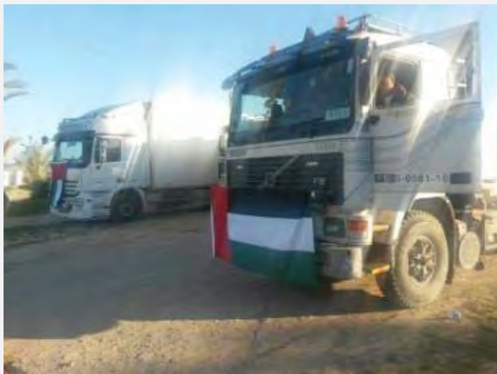
כניסת משאיות סיוע מאיחוד האמירויות דרך מעבר רפיח (פלסטין אלן, 21 בינואר 2015; אליום אלסבאע, 22 בינואר 2015)

■ לאחר בקשות חוזרות ונשנות של ההנהגה הפלסטינית ומחאות של תושבי רצועת עזה נפתח מעבר רפיח ב-20 בינואר 2015 לתנועת אזרחים למשך שלושה ימים. כמה מאות פלסטינית עברו במעבר ועומס רב ניכר בו. מצרים גם אפשרה כניסת שיירות סיוע ממאע"מ, מרוקו וסעודיה, שהביאו עימם תרופות, ציוד רפואי ומוצרי מזון (סמא, 21 בינואר 2015).