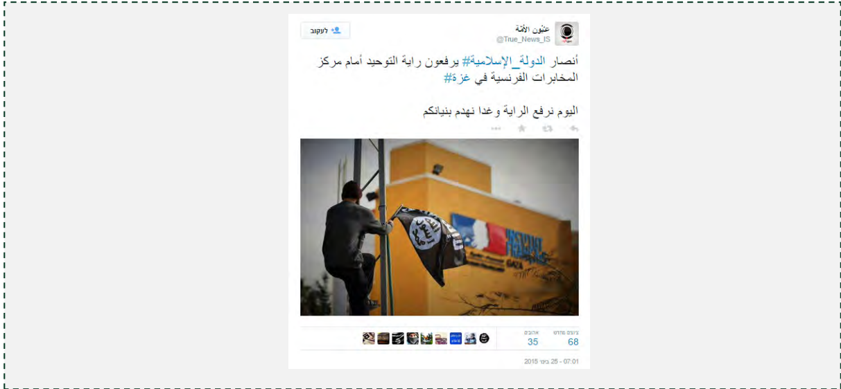
הנפת דגל דאעש מול מרכז התרבות הצרפתי בעזה.

עיון אלאמה, 25 בינואר 2015). מרכז התרבות הצרפתי שימש בעבר יעד לתקיפות: ב-12 בדצמבר 2014 אירע פיצוץ בבניין. התארגנות סלפית ג'האדיסטית בשם ג'נד אנצאר אללה, המזוהה עם הג'האד העולמי, העלתה ב-18 בדצמבר 2014 סרטון ליוטיוב, בו היא קיבלה אחריות לפיצוץ.