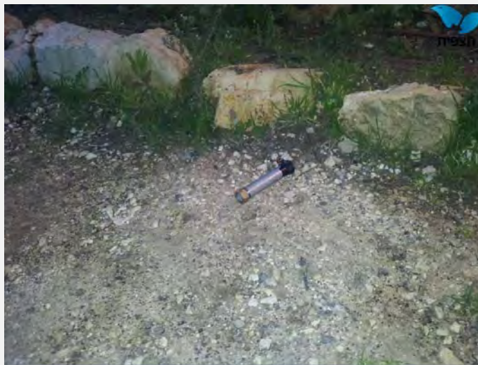
מטען צינור שלא התפוצץ (סוכנות תצפית, 25 בינואר 2015)

● ב-25 בינואר 2015 אזרח זיהה מטען צינור מונח בשטח פתוח בכניסה לאחת השכונות של הישוב נווה צוף (על כביש חוצה בנימין). המדובר ככל הנראה במטען שהושלך ולא התפוצץ (סוכנות תצפית, 25 בינואר 2015).