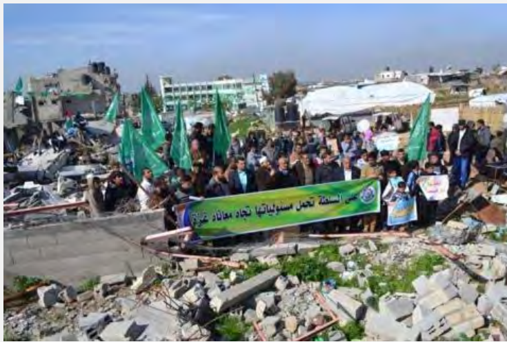
הפגנה דרומית לעזה בה מונפים דגלי חמאס. על השלט נכתב: "על השלטון לשאת באחריות על הסבל של עזה" (דף הפייסבוק PALDF, 23 בינואר 2015).

■ דרומית לעיר עזה (הריסות ג'חר אלדיכ) התקיימה הפגנה, בחסות חמאס, על הסחבת בשיקום. במהלך ההפגנה הטילו המשתתפים את האחריות לסחבת על אבו מאזן וממשלת ההסכמה הלאומית (צפא, 23 בינואר 2015).