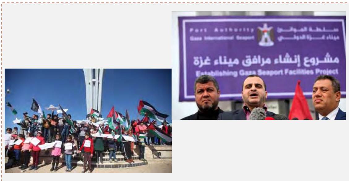
מימין: מסיבת העיתונאים בנמל עזה, שארגנה הועדה להסרת המצור מעל רצועת עזה (המזוהה עם חמאס). משמאל: הפגנת ילדים בנמל עזה (PALINFO, 25 בינואר 2015).