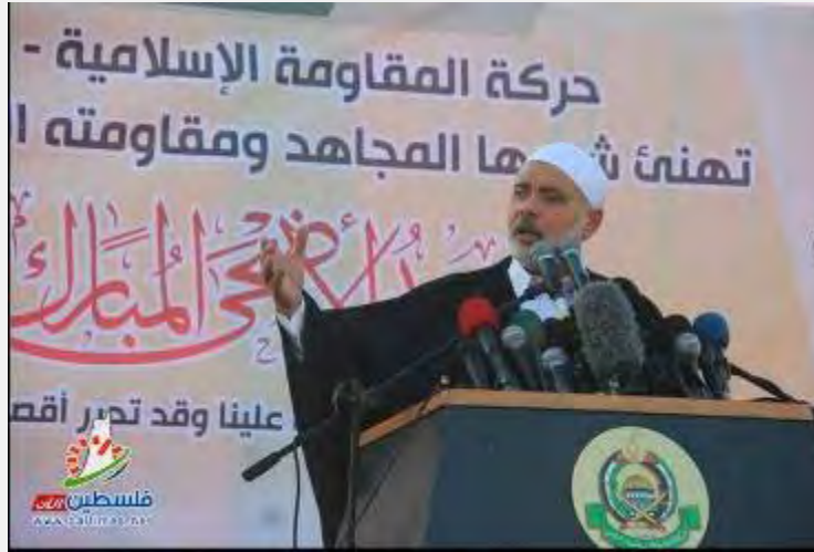
اسماعیل هنیه در ایراد خطبه نماز عید قربان در استادیوم «یرموک» در شهر غزه (4 اکتبر 2014)