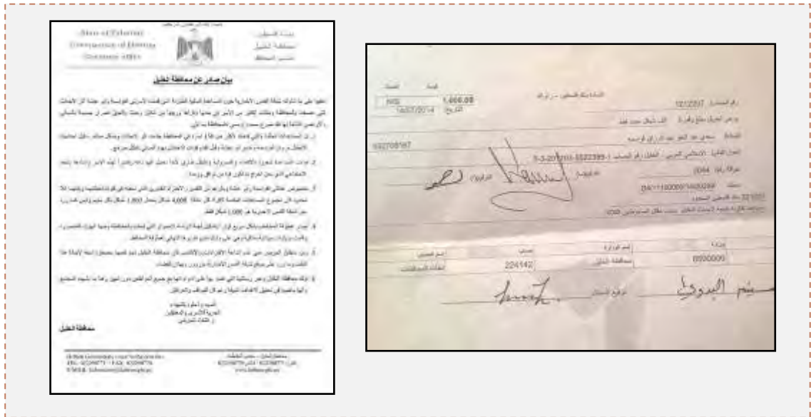
مکاتبات میان استناداری و سازمان های اعطای کمک برای دادن کمک مالی به خانواده های دو تروریستی که عامل ربودن سه نوجوان یهودی اسرائیلی در ماههای گذشته بودند (صفحه فیسبوک «شبكة اخبار قدس»، اول اکتبر 2014).