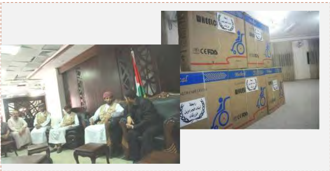
هیات کشور عمان و کمک های اهدایی آنها به غزه همزمان با عید قربان (PALINFO, دوم و سوم اکتبر 2014).

■ گذرگاه الرفح، برخلاف خواسته فلسطینی ها، همچنان نامنظم فعالیت می کند اما در همین حال، مصر به شماری از هیاتهای خارجی اجازه سفر از این گذرگاه و انتقال محموله های اهدایی کالا و کمک به غزه را داده است و از جمله، به هیات امداد رسانی از سلطان نشین عمان اجازه داده شد در طول نیم ساعتی که در اختیار دارند بیست کامیون حامل کمک های بشردوستانه را وارد غزه کنند («معان»، چهارم اکتبر 2014).