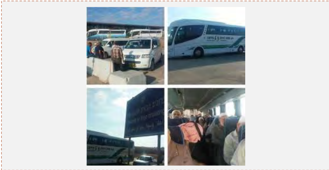
تردد فلسطینی ها از کرانه باختری و نیز از غزه به اسرائیل در طول عید قربان برای نمازگزاری در مسجدالاقصی («فلسطین الیوم»، 5 اکتبر 2014)