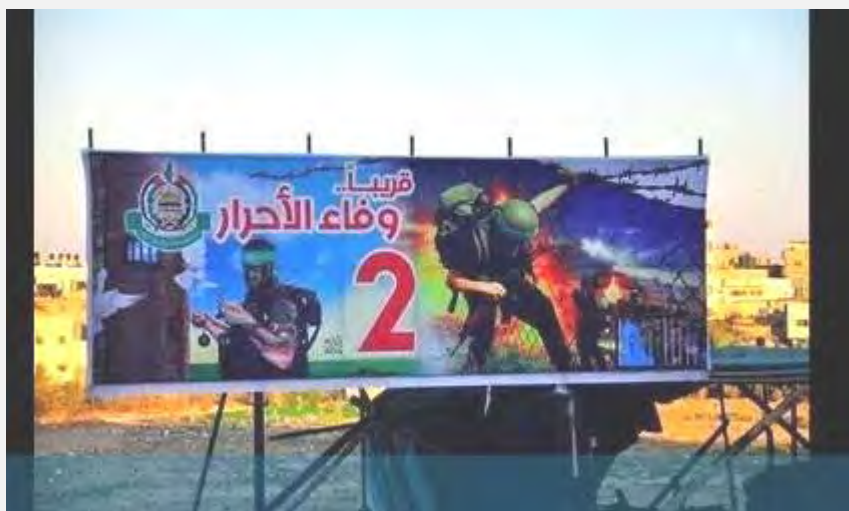
تصاویر انتشار یافته از سوی حماس در غزه که از آزادی قریب الوقوع شماری از زندانیان امنیتی فلسطینی در یک معامله با اسرائیل خبر می دهد («فلسطین»، 6 اکتبر 2014)

■ شبکه های تلویزیونی فلسطینی در غزه از آزادی قریب الوقوع زندانیان امنیتی فلسطینی در معامله با اسرائیل خبر میدهند و آن را «وفاداری 2 به زندانیان» می نامند 2 . در تصاویر فعالان حماس در حال آتشباری دیده می شوند و ادعا شده است که معامله بر سر (جسد) زنده نام شائول اورون، افسر جوان کشته شده ارتش اسرائیل، و یک سرباز ناپدید شده دیگر ارتش اسرائیل انجام خواهد شد (روزنامه «فلسطین»، ششم اکتبر 2014).