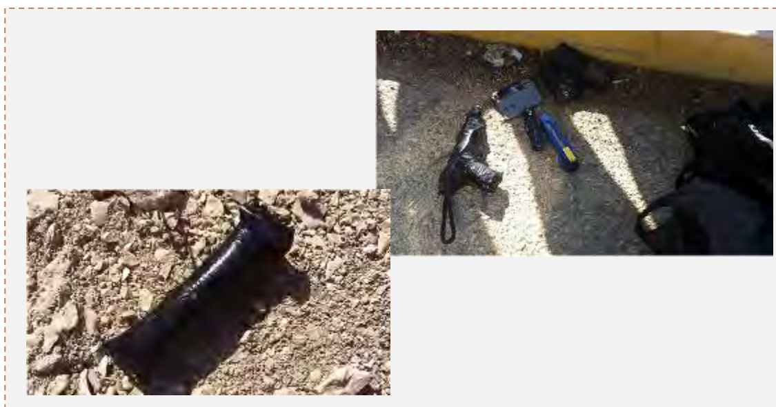
وسایل بدست آمده از دو جوان مشکوک فلسطینی که در یک پست بازرسی دستگیر شدند (عکس از: پلیس اسرائیل، 2 اکتبر 2014).