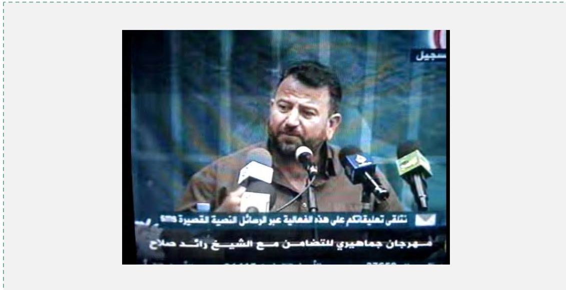
Saleh al-Aruri bei einer Ansprache zur Unterstützung von Sheikh Ra'ed Saleh in Damaskus (YouTube, 13. August 2010)

Palästinensische Autonomiebehörde stelle jedoch eine Hürde dar (Al-Intilaqa, 16. Dezember 2013).