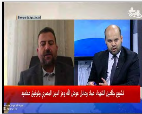
Saleh al-Aruri im Al-Aqsa TV Interview in Istanbul während der Beerdigung der Hamas Militanten Adel und Imad Awadallah (Al-Aqsa TV 6. Mai 2014).

unterstrich das Konzept des „Widerstands“ (sprich: Terror) gegen Israel (Al-Aqsa TV, 6. Mai 2014). Er behauptete, dieser Tag (der Beerdigung) sei ein bedeutender Tag in der Geschichte des Jihad und des Kampfes in Judäa und Samarien; er bestand darauf, dass die „Option des Widerstands“ nicht vom Tisch sei: diese Option lebt wegen des von außen ausgeübten Drucks, in Schläferzellen und im Untergrund weiter, „der „Widerstand“ könne jedoch bei der ersten Gelegenheit wiederaufleben. Er führte aus, die Palästinenser selbst hätten nicht die Möglichkeit, sich von der (sogenannten) „Besatzung“ zu befreien – außer durch den Jihad, der Opfer erfordert. Er behauptete auch, die Palästinenser befänden sich am Scheideweg, da ihre Versuche, ihre Rechte durch Verhandlungen, bei UN Einrichtungen und in internationalen Organisation einzuklagen, sich in einer Sackgasse befänden (Al-Aqsa TV, 30. April 2014).