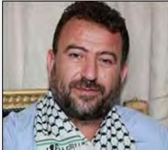
Saleh Muhammad Suleiman el-Aruri ( http://www.imemc.org/ , 20. Juni 2014)