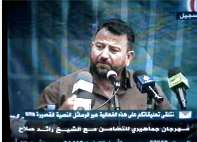
Salah al-Arouri prononce un discours durant une conférence de soutien au cheikh Raed Salah organisée à Damas (Youtube, 13 août 2014)