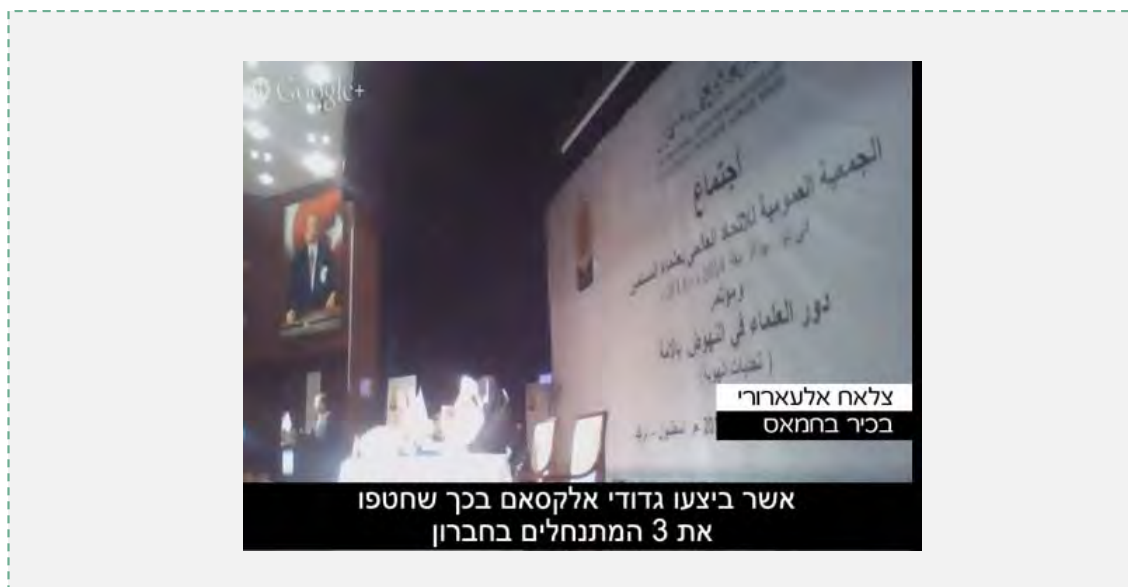
La vidéo du discours d'al-Arouri faisant référence à l'enlèvement des adolescents israélien (Youtube, 20 août 2014). Pour voir la vidéo : https://www.youtube.com/watch?v=h1_eJzCdZ4

faim des détenus palestiniens emprisonnés en Israël. Il ressort de ses propos que l'opération s'inscrit dans le cadre de la campagne menée par le Hamas en vue d'une nouvelle intifada dans toute la Palestine (y compris au sein des arabes israéliens, "les arabes de 1948").