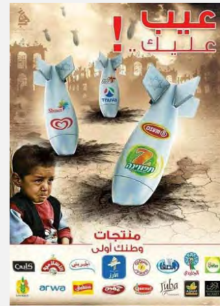
כרזות הקוראות להחרמת תוצרת ישראל: מימין: "אתה תורם לתמיכה בצבא הכיבוש הישראלי בקניית מוצריהם" (דף הפייסבוק של הגוש האסלאמי באוניברסיטת אלנג'ח, 8 באוגוסט 2014). באמצע: "אל תתמוך במלחמה נגד עזה", סל המוצרים הישראליים מוצג כטנק ישראלי (דף הפייסבוק רשת פלסטין להסברה, 10 באוגוסט 2014). משמאל: "הרכישה עליך", כל קניה של מוצר ישראלי חוזרת לעזה באמצעות טיל (דף הפייסבוק עזה אלון, 7-8 באוגוסט 2014).