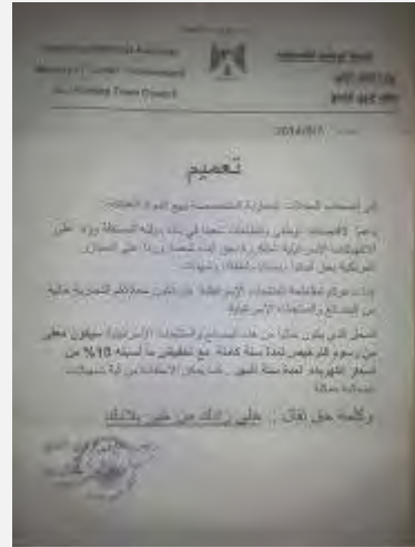
מימין: המכתב הקורא להחרים סחורות ישראליות ומעניק הקלות והנחות למי שיעשה כך (עזה אלון, 9 באוגוסט 2014). משמאל: סימון מוצרים ישראליים כאסורים לקנייה (דף הפייסבוק PALINFO, 9 באוגוסט 2014).