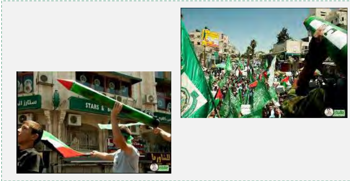
צעדת תמיכה, בעזה שנערכה ברמאללה מטעם חמאס. בהפגנה הוצגו דגמי רקטות והונפו דגלי חמאס (פלסטיין אל'ן, 9 באוגוסט 2014).

16. סא'ד אבו אלבהא , בכיר חמאס ביהודה ושומרון אמר, שהאירועים נועדו לתת פומבי לדרישות הפלסטינים ולהראות, כי הם מאוחדים בדעתם. בפנותו לחברי המשלחת הפלסטינית בקהיר אמר כי העם הפלסטיני מאחוריהם ואל להם לחזור מבלי שימולאו דרישות הפלסטינים (ערוץ אלאקצא, 8 באוגוסט 2014).