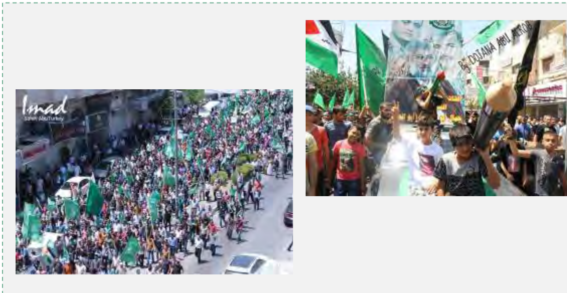
תהלוכת תמיכה בעזה, שארגנה חמאס בחברון (דף הפייסבוק של הגוש האסלאמי באוניברסיטת ביר זית, 8 באוגוסט 2014)