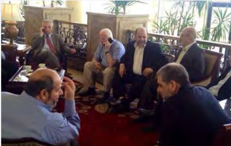
המשלחת הפלסטינית בקהיר (פלסטין אל'אן, 10 באוגוסט 2014)

18. גורמים בחמאס ובארגוני הטרור הנוספים האשימו את ישראל באי התקדמות השיחות וטענו, כי כתוצאה מכך חודש הירי. למרות חידוש הירי וחזרתה של המשלחת הישראלית נשארה המשלחת הפלסטינית בקהיר. לדברי סאמי אבו זהרי , דובר חמאס הם עדיין ממתינים לתגובת המשלחת הישראלית (אלקדס, 9 באוגוסט 2014).