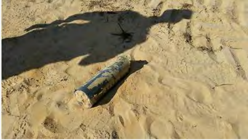
שרידי נפילה באחד מיישובי המועצה האזורית אשכול (דוברות המועצה האזורית אשכול)

של רקטות, רובן באזור הנגב המערבי. כמו כן נורתה כמות דומה של פצצות מרגמה לעבר הישובים בגבול רצועת עזה. שני בני אדם נפצעו מפגיעת פצצת מרגמה. כמו כן נגרם נזק לרכוש.