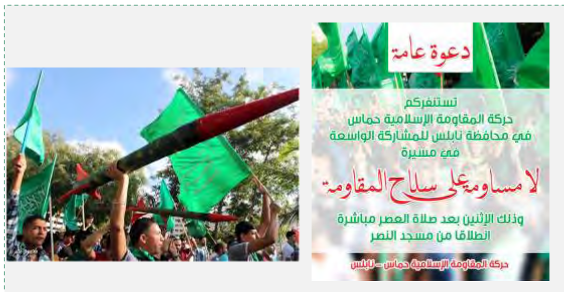
Справа: листовка с призывом к участию в демонстрации. Слева: флаги организации ХАМАС и макеты ракетных снарядов в ходе демонстрации (страница Фейсбук исламского блока в университете Аль Наджах, 4 августа 2014 г.)

28. В Иудее и Самарии продолжают звучать призывы выходить на демонстрации и проводить акции в поддержку сектора Газа. На странице Фейсбук исламского блока в университете Аль Наджах в г. Наблус 4-го июля 2014 г. было опубликовано приглашение к участию в демонстрации в поддержку жителей сектора Газа, проведенной организацией ХАМАС, под лозунгом "Не торгуемся об оружии сопротивления". В демонстрации приняло участие большое количество палестинцев, которые несли флаги организации ХАМАС и макеты ракетных снарядов (страница Фейсбук исламского блока в университете Аль Наджах, 4 августа 2014 г.).