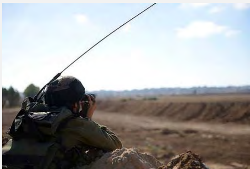
Солдат ведет наблюдение за сектором Газа при вступлении в силу соглашения о прекращении огня (5 августа 2014 г.)