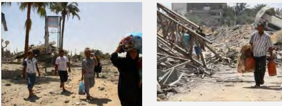
Палестинские жители возвращаются в свои дома в селении Хирбет Хаджаа ("Аза Алан", 5 августа 2014 г.)