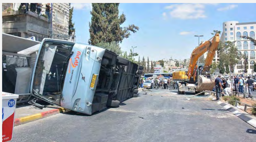
Место совершения теракта в Иерусалиме (полиция Израиля, 4 августа 2014 г.)

6. Это уже не первый случай, когда в Иерусалиме совершается теракт с использованием трактора. В рамках терактов, совершаемых на основе стратегии "народного сопротивления", неоднократно используется модель теракта посредством наезда автотранспортом. Обычно подобные теракты смертоносны, и они совершаются террористами-одиночками. С 2000-го по 2008-й год было совершено около 20 подобных терактов, в результате которых погибло 15 человек. Особо заметными среди них были три наезда в Иерусалиме, два из которых были совершены с использованием бульдозеров. В этих терактах