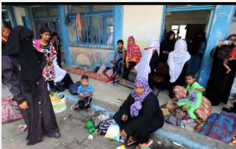
Жители сектора Газа в здании школы агентства БАПОР (интернет-сайт агентства БАПОР, 4 августа 2014 г.)