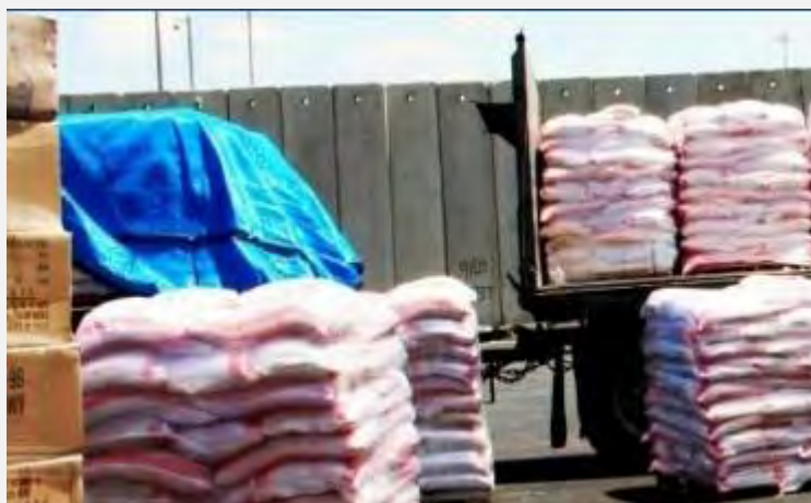
Ввоз снабжения в сектор Газа через КПП "Керем Шалом" (координатор действий правительства на территориях, 4 августа 2014 г.)

26. С момента начала операции через КПП "Керем Шалом" было пропущено 1737 грузовиков с продуктами питания, лекарствами и медицинским оборудованием. Кроме того, в сектор Газа ввозились солярка для электростанций, бензин для транспорта и газ для хозяйственных нужд (интернет-сайт координатора действий правительства на территориях, 4 августа 2014 г.).