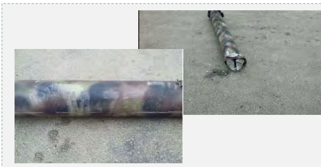
Остатки ракетного снаряда модели М 75, упавшего в окрестностях Иерусалима. Слева: на корпусе ракетного снаряда можно различить маркировку М 75