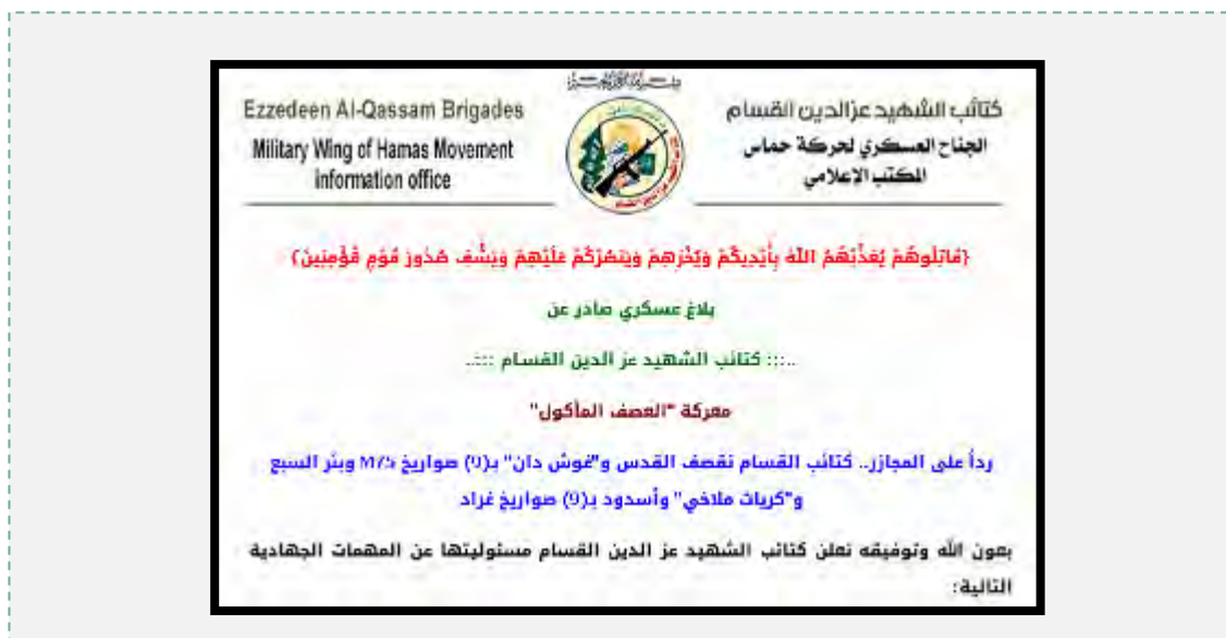
Заявление военного крыла (интернет-сайт военного крыла, 5 августа 2014 г.)