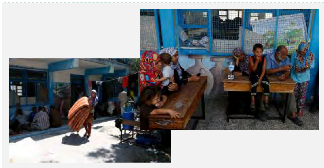
Жители сектора Газа, находящиеся в зданиях школ агентства БАПОР

19. Валерия Эймс, заместитель ген. секретаря ООН по гуманитарным вопросам, сообщила, что около 250000 жителей сектора Газа покинули свои дома. 200000 из них находятся в убежищах агентства БАПОР. Продовольственная организация ООН обеспечивает продуктами питания, в режиме кризиса, 204000 человек, в дополнение к постоянной продовольственной программе, действующей в секторе Газа (Relief Web, 30 июля 2014 г.).