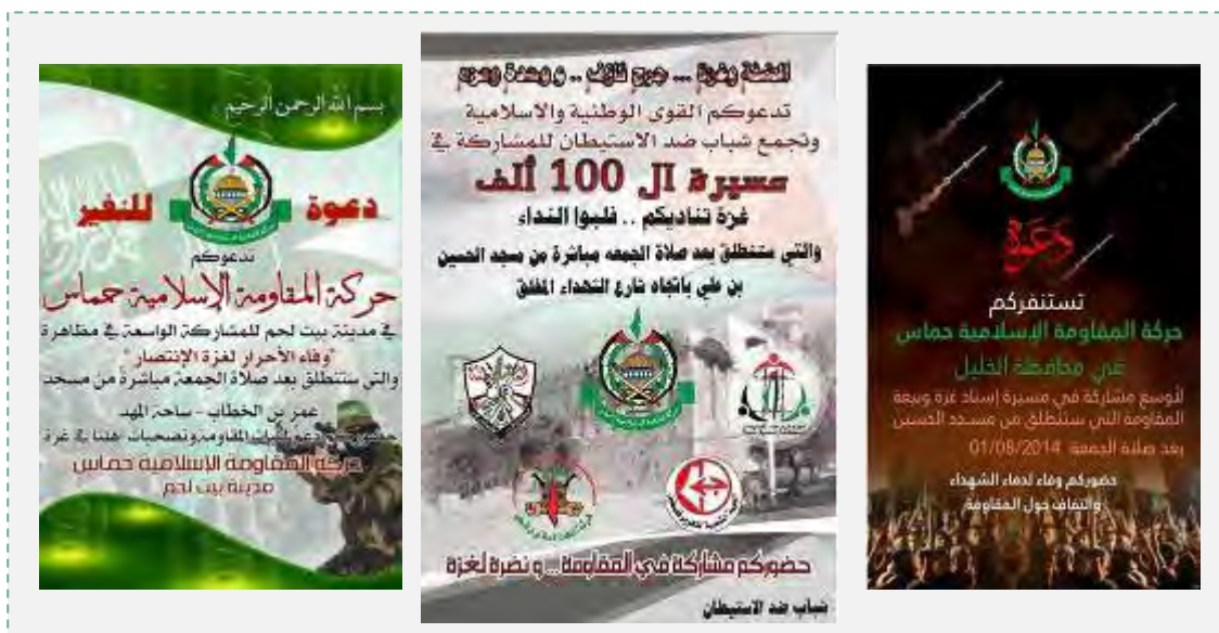
Листовки с призывами выходить на демонстрации. Справа: листовка с призывом к участию в демонстрации в Хевроне. В центре: листовка о "шествии ста тысяч". Слева: листовка с призывом к участию в демонстрации в Вифлееме (страница Фейсбук "Шеххат Палестин Лалахуар", 30 июля 2014 г.)