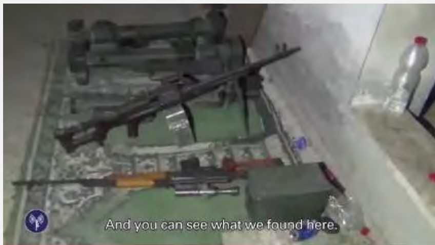
Оружие и снаряжение, обнаруженное в мечети (пресс-служба Армии Оборона Израиля, 30 июля 2014 г.) Для просмотра видео: https://www.youtube.com/watch?v=aWkjwfkx-qM

В. В ночь с 30-го на 31-е июля бойцы Армии Оборона Израиля, действующие в южной части сектора Газа, уничтожили террориста, выпустившего по ним противотанковую ракету.