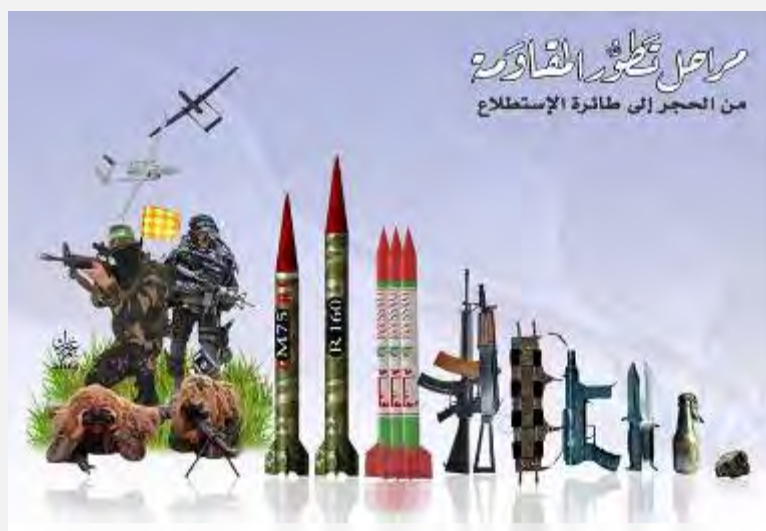
Листовка, изображающая этапы развития "сопротивления" – от камня до беспилотного летательного аппарата (страница Фейсбук "Шеххат Палестин Лалахуар", 30 июля 2014 г.)