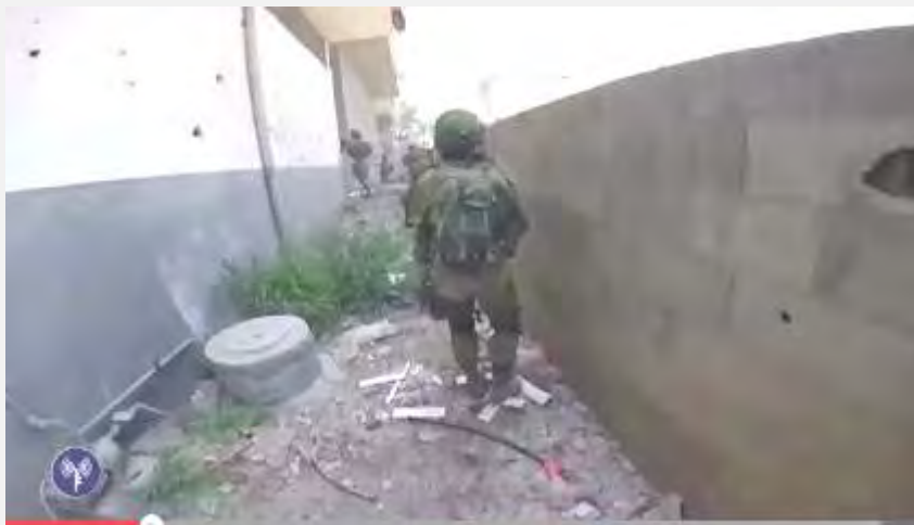
Продолжение операции Армии Оборона Израиля в секторе Газа (30 июля 2014 г.)