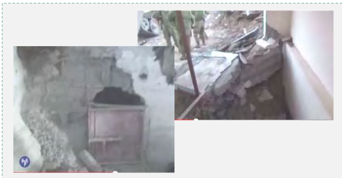
Выходы из тоннеля, обнаруженные в мечети в секторе Газа (пресс-служба Армии Оборона Израиля, 30 июля 2014 г.)

В. 30-го июля 2014 г. , в ходе действий Армии Оборона Израиля в секторе Газа, были обнаружены два выхода из тоннеля, оборудованные в мечети , которая была при этом открыта для верующих и проведения молитв. В мечети было обнаружено большое количество военного снаряжения. Кроме того, в другой мечети был обнаружен еще один выход из тоннеля. Обнаруженные улики указывают, что террористы пользовались тоннелем для попыток атаковать солдат Армии Оборона Израиля.