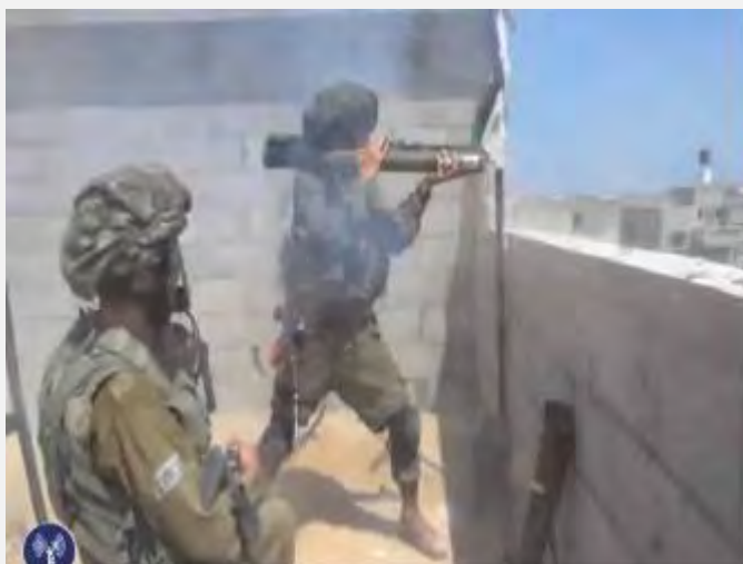
نیروهای اسرائیلی در درگیری در غزه (عکس از: سخنگوی ارتش اسرائیل، 28 ژوئیه 2014).