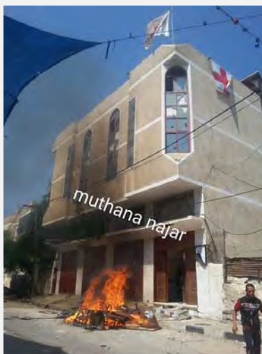
حریق ایجاد شده در ستاد صلیب سرخ توسط تظاهرکنندگان در جنوب غزه آنها انبار داروی صلیب سرخ را به آتش کشیده اند (صفحه فیسبوک «مثنی نجار»، بیست و هفتم ژوئیه 2014).