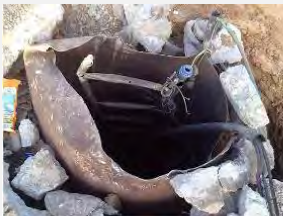
کشف تونل ها (سخنگوی ارتش اسرائیل، 28 ژوئیه 2014).