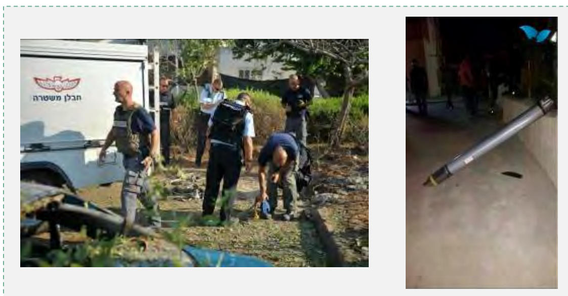
Справа: ракетный снаряд, который упал, но не взорвался, в бедуинском селении Раат 22-го июля 2014 г. (агентство новостей "Тацпит", 22 июля 2014 г. фото: Атеф Аль Карнауви Абу Аль Асаль). Слева: полицейские саперы собирают остатки ракетных снарядов, выпущенных по Израилю (полиция Израиля, 22 июля 2014 г.)