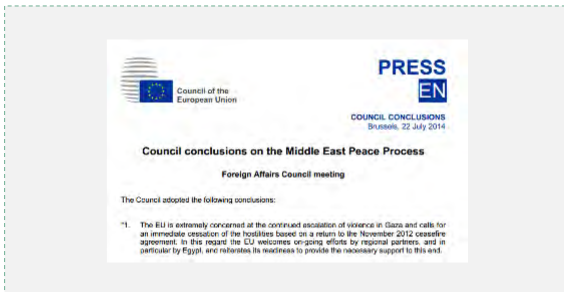
Заявление министров иностранных дел Европейского Союза (интернет-сайт Европейского Союза, 22 июля 2014 г.)

32. По окончании ежемесячного совещания министров иностранных дел Европейского Союза было опубликовано заявление, в котором министры иностранных дел резко осуждают ракетные обстрелы территории Израиля. В заявлении подчеркивается, что весьма нетипично, необходимость разоружения всех террористических организаций, действующих в секторе Газа. Кроме того, отмечается законное право Израиля на самозащиту. Вместе с тем министры иностранных дел выразили своё потрясение числом убитых в результате операции Армии Обороны Израиля в квартале Седжайя. Заявление призывает к немедленному прекращению огня и к открытию, без предварительных условий, КПП на границах сектора Газа (интернет-сайт Европейского Союза, 22 июля 2014 г.).