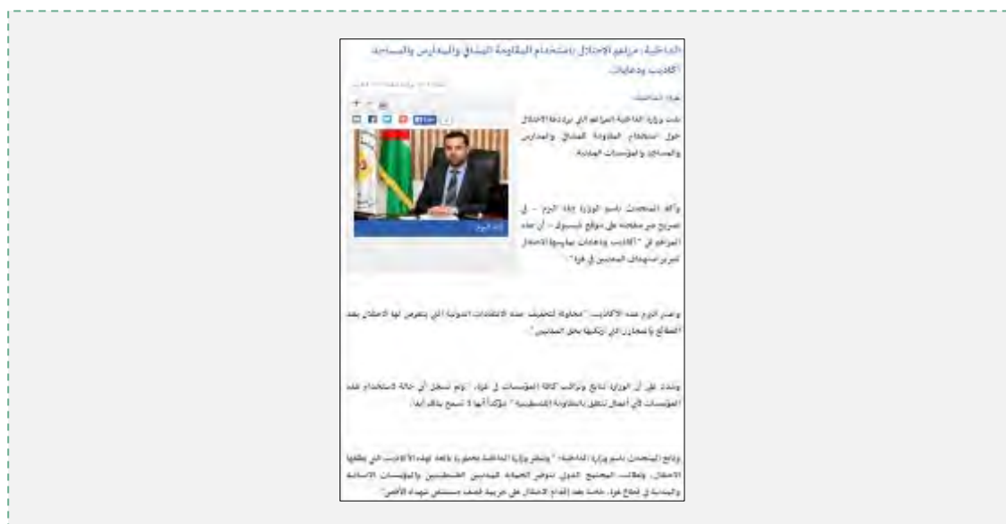
Опровержение палестинского министерства внутренних дел (интернет-сайт палестинского министерства внутренних дел, 22 июля 2014 г.)