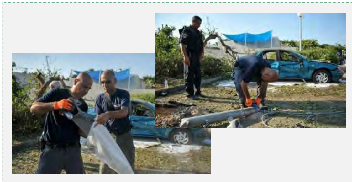
Полицейские саперы собирают остатки ракетных снарядов, выпущенных по Израилю (полиция Израиля, 22 июля 2014 г.)

В. 22-го июля 2014 г. , утром, был произведен залп ракетных снарядов в направлении центральных районов страны. Один ракетный снаряд, который не был сбит, упал в г. Йехуд и причинил повреждения нескольким домам.