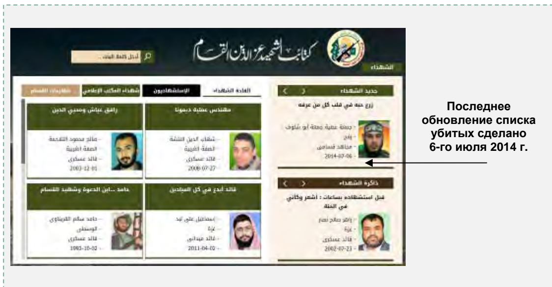
Интернет-сайт военного крыла, где опубликован список убитых