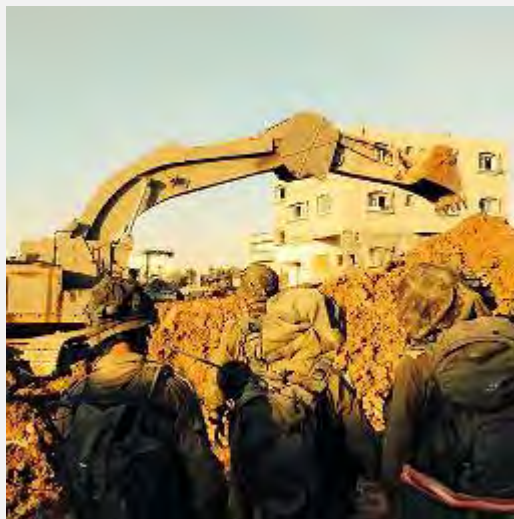
Действия Армии Оборона Израиля против тактических тоннелей (пресс-служба Армии Оборона Израиля, 22 июля 2014 г.)