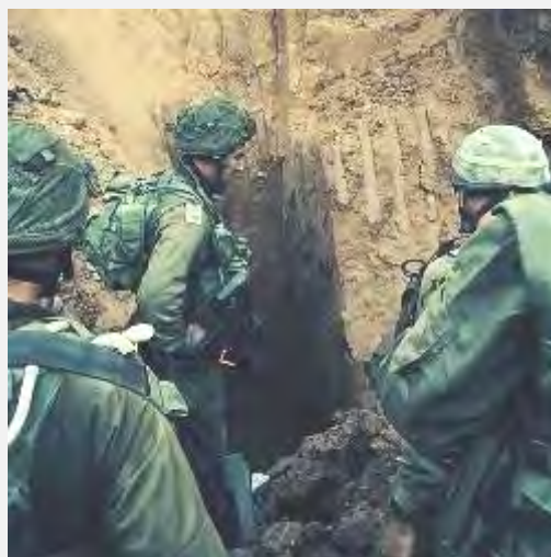
Действия армии Оборона Израиля в секторе Газа (пресс-служба Армии Оборона Израиля, 22 июля 2014 г.)