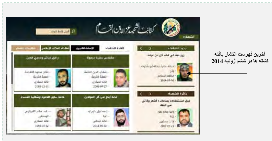
وبسایت شاخه نظامی که در آن فهرست کشته ها قید گردیده است