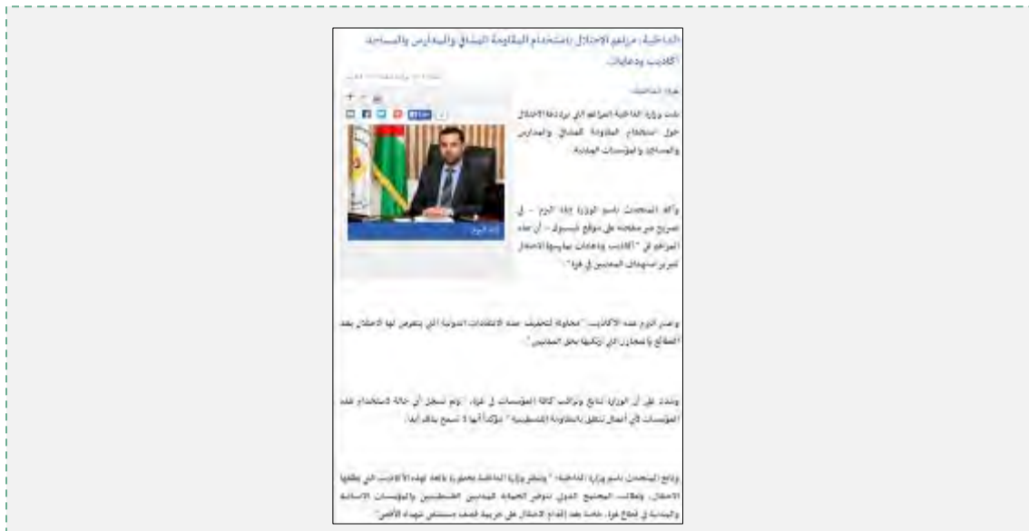
انکار وزارت کشور فلسطینی در خصوص سوء استفاده از موسسات غیرنظامی برای عملیات تروریست (وبسایت وزارت کشور فلسطینی، 22 ژوئیه 2014)