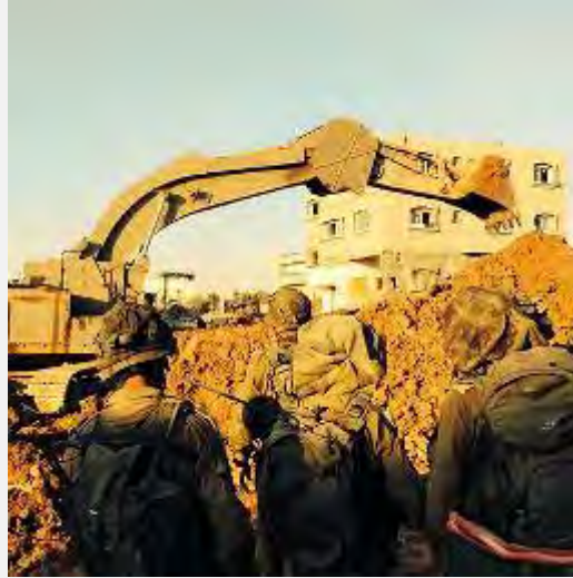
عملیات نظامی ارتش اسرائیل علیه تونل های ویژه ترور (سختگویی ارتش اسرائیل، 22 ژوئیه 2014)