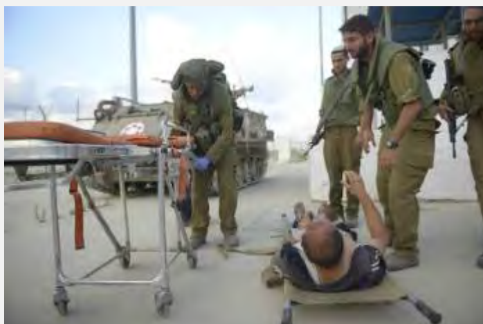
ارتش اسرائیل غیرنظامی های زخمی شده در غزه را که به گذرگاه «ارز» می رسند، برای درمان منتقل می کند (عکس از: سخنگوی ارتش اسرائیل، 22 ژوئیه 2014).