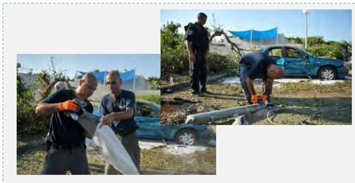
نیروهای پلیس اسرائیل به بازرسی بقایای یک راکت که پرتاب شده پرداخته اند (پلیس اسرائیل، 22 ژوئیه 2014)

ج – در ساعات صبح روز 22 ژوئیه 2014 چند فروند راکت به سوی مرکز اسرائیل شلیک گردید و یک فروند از این راکت ها که منحرف و منهدم نشده بود به چند خانه در «یهود» خسارت وارد کرد.