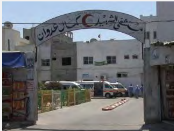
Entrée de l'hôpital Kamal Adwan