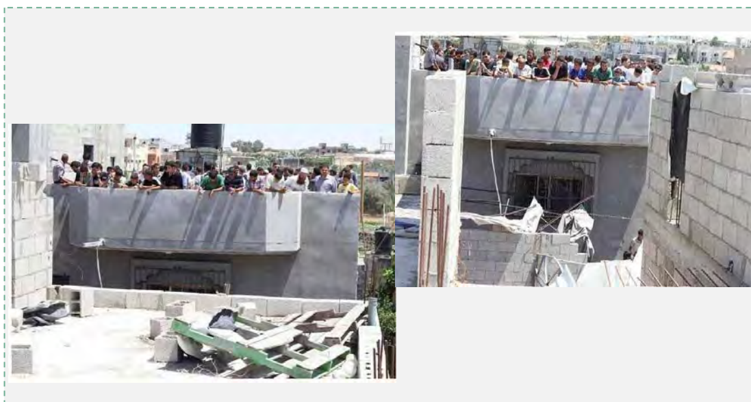
Палестинские граждане собрались на крыше дома семьи Куара в Хан Юнесе (телевидение "Ватан", 9 июля 2014 года)

5. 8 июля 2014 года представитель ХАМАСа Сами Абу Заари дал интервью, в котором призвал жителей сектора Газа послужить "живым щитом" для активистов террористических организаций, которых атакует военная авиация Израиля. В этом интервью (канал "Аль Акса", 8 июля 2014 года) он рассказывает, что когда дом семьи Куара был атакован с воздуха, вокруг собрались граждане "с обнаженными торсами", прикрывая собой израильские истребители, "чтобы защитить свои дома". Он заявил, что подобная тактика себя успешно оправдывает, и призвал палестинский народ использовать ее вновь и вновь (см. видеозапись интервью, которая транслировалась по 10-му каналу израильского телевидения, репортаж Цви Яхазкиэли от 8 июля 2014 года, Институт исследований СМИ Ближнего Востока – MEMRI, 9 июля 2014 года).