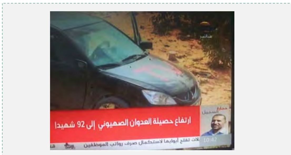
Автомобиль высокопоставленного террориста ХАМАСа Мохаммеда Риача Шамлах с буквами TV (канал "Аль Акса", 19 ноября 2012 года).

Е. Использование транспортных средств зарубежных организаций в оперативных целях – оперативные транспортные средства террористических группировок были закамуфлированы под автомобили, принадлежащие иностранным организациям (карыеты скорой помощи, машины журналистов, коммерческие транспортные средства и т.д.). Так например, во время операции "Облачный столп" (19 ноября 2012 года) Армия обороны Израиля атаковала автомобиль, в котором ехал высокопоставленный террорист ХАМАСа Мохаммед Шамлах, – именно он несет ответственность за использование силы на юге сектора Газа. Автомобиль, в котором он ехал, был замаскирован под "машину журналистов" с буквами TV на капоте.