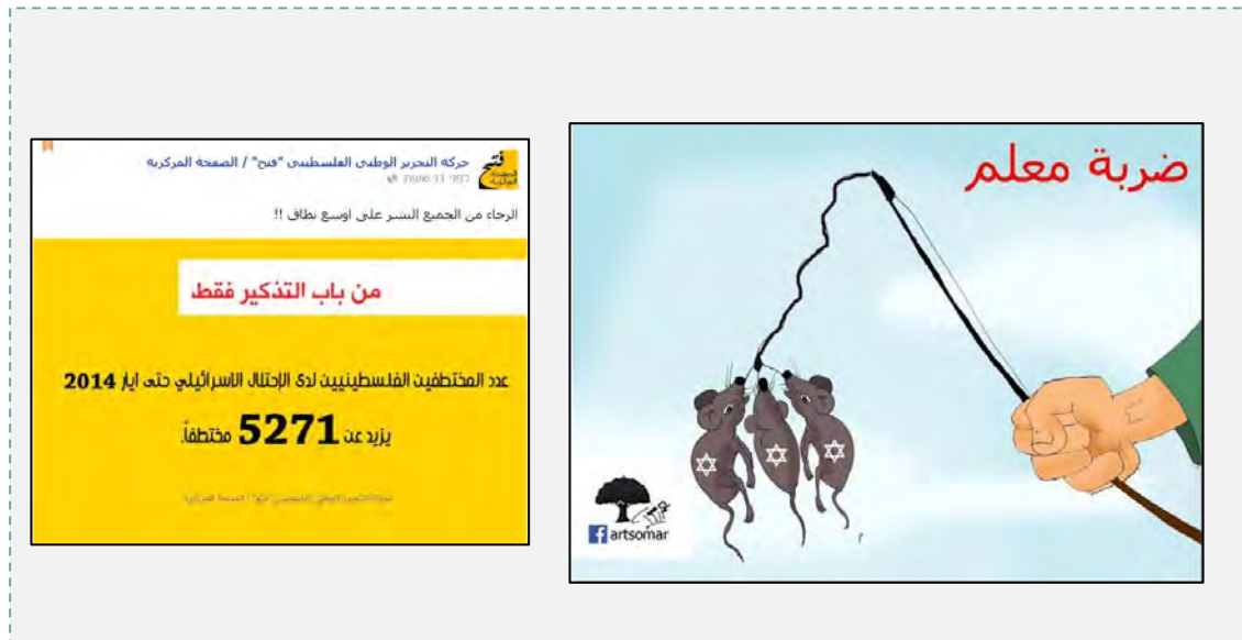
Droite : Affiche publiée sur la page Facebook officielle du Fatah. Gauche : Annonce sur les 5271 "otages palestiniens" détenus par Israël (Page Facebook du Fatah, 15 juin 2014)

21. Sur sa page Facebook officielle, le Fatah a publié une caricature montrant les otages israéliens comme trois souris prises au piège. Les internautes palestiniens ont réagi en disant que c'était le seul moyen de garantir la libération des prisonniers israéliens détenus en Israël. Par ailleurs, sur une autre page Facebook, le Fatah a appelé à faire un large écho au fait qu'en date de Juin 2014, le nombre "d'otages palestiniens" [cf., les terroristes emprisonnés en Israël pour les crimes commis] est de 5271 (Page Facebook du Fatah, 15 juin 2014).