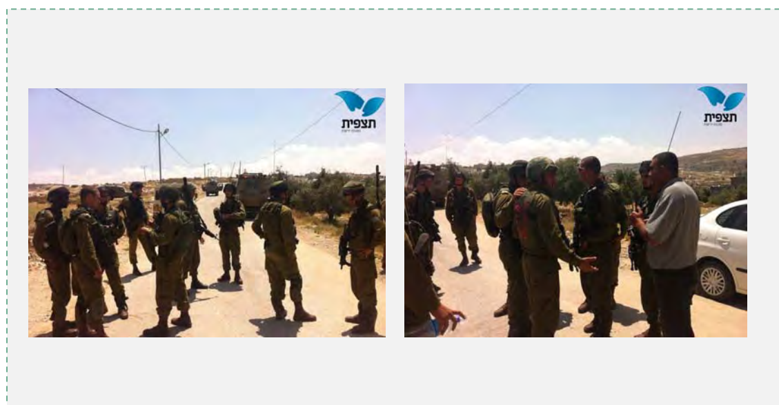
Opération des forces de sécurité dans le secteur de Hébron (Agence de presse Tazpit, 13 juin 2014 : photo : Moshé Buteinya)

10. Un blocus a été imposé au Sud de la Judée et de Bethléem. Dans la nuit du 14 au 15 juin 2014, les forces de sécurité israéliennes ont arrêté plusieurs dizaines de suspects à Hébron, Ramallah et Tubas. Selon les Palestiniens, des responsables