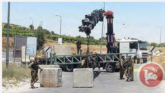
Les forces de Tsahal bloquent les entrées de Hébron (Ma'an, 15 juin 2014)