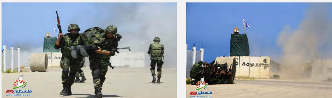
Cérémonie de fin de cours d'officiers des services de sécurité nationale dans la bande de Gaza au cours de laquelle les cadets simulent l'assaut d'une position de Tsahal et l'enlèvement d'un soldat (Filastin al-'Aan, 17 avril 2014) (Pour voir le film, cliquer sur http://www.youtube.com/watch?v=3dGPWJAwaml )