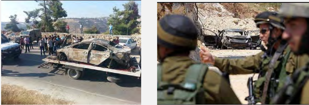
Le véhicule incendié vraisemblablement lié à l'enlèvement (Filastin al-'Aan, 13 juin 2014)