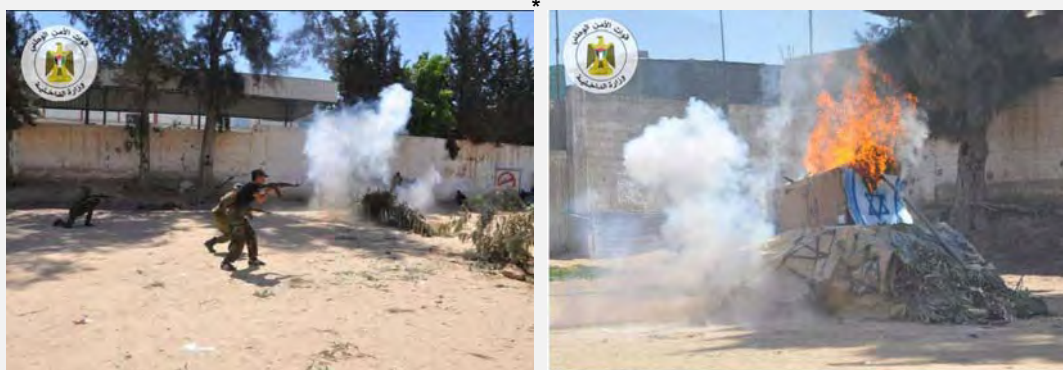
Les cadets du programme Al-Futuwwa (programme d'études militaires pour les adolescents de la bande de Gaza) simulent l'assaut d'une position de Tsahal et l'enlèvement d'un soldat de Tsahal (Page Facebook du projet Al-Futuwwa, 28 mars 2013)