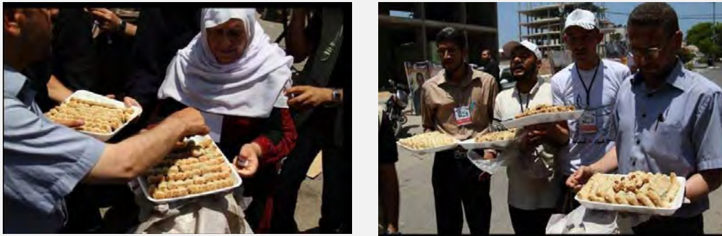
Distribution de pâtisseries dans la bande de Gaza près de la tente de protestation érigée en soutien aux détenus palestiniens en grève de la faim en Israël