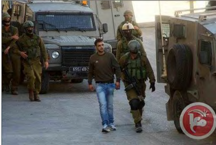
Les forces de Tsahal arrêtent un individu recherché dans la région de Hébron (Ma'an, 14 juin 2014)

du Hamas et du JIP ainsi que des activistes de l'organisation étudiante de l'Université Al-Najah de Naplouse figurent parmi les interpellés (Ynet, 15 juin 2014). Le 15 juin au matin, des responsables palestiniens ont annoncé que leurs activités de renseignement étaient focalisées sur les tentatives de retrouver deux membres du Hamas de Hébron liés à la branche armée et disparus de leur domicile depuis jeudi (Article d'Avi Issacharof, Walla, 15 juin 2014).