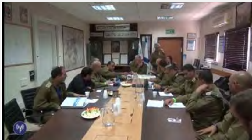
Etat des lieux sous la direction du chef d'état-major (Porte-parole de Tsahal, 14 juin 2014)

16. Le général Benny Gantz a qualifié l'incident de grave et de s'ajoutant à une série d'événements. Selon lui, Tsahal agit en collaboration étroite avec tous les services de sécurité et selon les directives politiques là où une opération d'envergure est nécessaire. Gantz a ajouté que Tsahal continuera d'agir et de tout faire pour garantir la fin de l'incident le plus rapidement. Il a souligné qu'en parallèle, Tsahal gardait un œil sur les autres arènes (cf., la bande de Gaza et le Nord d'Israël) (Porte-parole de Tsahal, 14 juin 2014). Le ministre de la Défense Moshé Yaalon a déclaré qu'en l'absence d'autres informations, l'hypothèse est que les trois adolescents sont toujours en vie . Selon lui, toutes les forces de sécurité œuvrent en collaboration pour garantir leur libération (Ynet, 14 juin 2014).