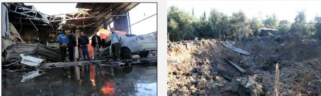
A la derecha: Un objetivo terrorista en Gaza, que fue atacado el 6 de abril de 2014 (Pal Today, 6 de abril de 2014). A la izquierda: Una tornería atacada en el campamento de refugiados en Jabaliya (WAFA, 4 de abril de 2014)