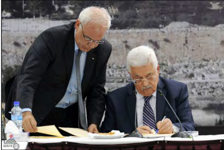
La crisis en las negociaciones israelí – palestinas: Mahmoud Abbas (Abu Mazen) firma un pedido de la Autoridad para integrarse en una cantidad de Instituciones y tratados internacionales (WAFA, 1 de abril de 2014)