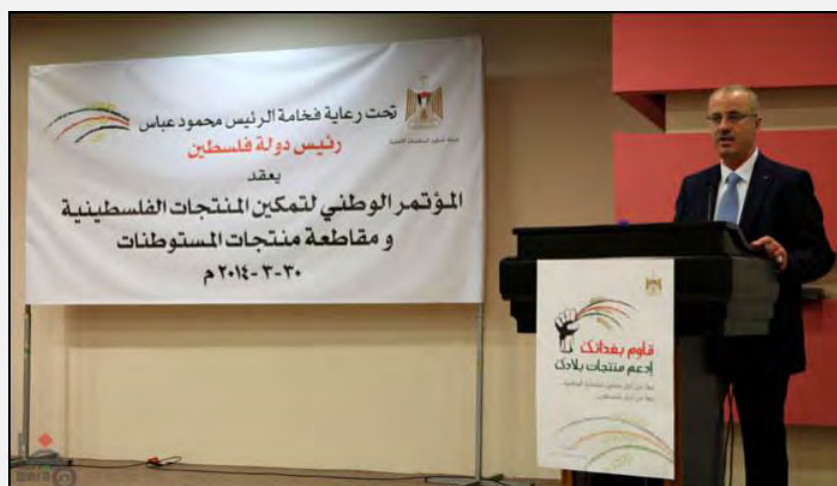
Rami Hamdallah, habla en nombre de Mahmoud Abbas (WAFA, 30 de marzo de 2014)

■ El 30 de marzo de 2014 se organizó en Ramallah una Conferencia para el avance de la producción palestina y el boicot a los productos de los asentamientos. La Conferencia se organizó con el auspicio de Mahmoud Abbas y la presencia de importantes líderes de la Autoridad Palestina entre ellos Rami Hamdallah, Primer Ministro. En el discurso ofrecido por el Primer Ministro, en nombre de Mahmoud Abbas, Hamdallah destacó que hay que aumentar los esfuerzos de la lucha contra “la ocupación israelí”. Según él, se registraron logros en la “lucha popular”. Llamó al avance del boicot a los productos de los asentamientos y para acrecentar la conciencia de la importancia al apoyo de los productos palestinos (WAFA, 30 de marzo de 2014). Sultán Abu Alainin , miembro del Comité Central de Fatah y asesor de Mahmoud Abbas para las organizaciones no gubernamentales, llamó durante el Congreso a que, además de boicotear los productos de los asentamientos, se boicotearan también productos israelíes (página facebook de Sultán Abu Alainin, 30 de marzo de 2014).