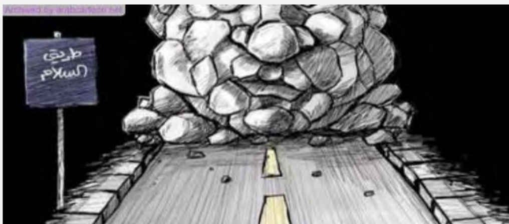
Caricatura palestina que expresa el callejón sin salida al que llegaron las negociaciones. En el cartel se lee : el camino de la paz (al – Quds, 2 de abril de 2014)

■ En el trasfondo de estos contactos se encuentra una línea dura que presenta (todavía?) la Autoridad Palestina . Según Saeb Erekat y Mahmoud al Aalul éste último, miembro del Comité Central de Fatah, las condiciones de los palestinos para continuar con las negociaciones son: recibir un documento escrito del Primer Ministro Netanyahu en el que reconoce las fronteras del Estado Palestino sobre la base de las fronteras de 1967, cuya capital es Jerusalén Este; la liberación de 1,200 presos incluidos Marwan Barghouti; Ahmad Saadat y Fuad al – Shubaki; la realización de un acuerdo para los cruces y el levantamiento del “estado de sitio” de la Franja; el retorno de los deportados durante el caso de la Iglesia de la Natividad 5 ; el cese de la construcción en los asentamientos, en Jerusalén y en otros lugares más; otorgar permiso para reunirse con sus familias, a 15.000 palestinos incluido el otorgamiento de ciudadanía completa; evitar la entrada de israelíes en las áreas de la Autoridad Palestina y el control de la Autoridad sobre los territorios C (Maan, 3 de abril de 2014).