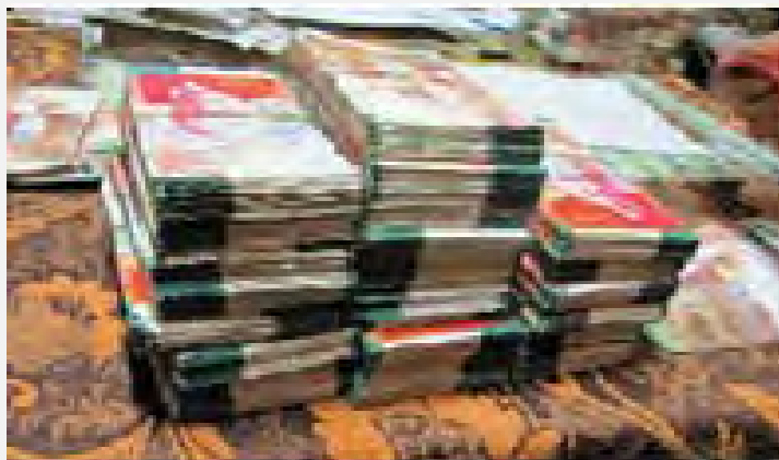
Parte de las sumas de dinero que se encontraron en manos de los detenidos (Servicio de Seguridad General, 7 de abril de 2014)