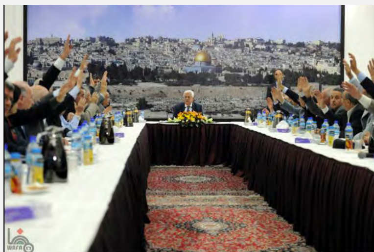
Los dirigentes palestinos votan por unanimidad la decisión de unirse a Instituciones y Tratados Internacionales (Wafa, 1 de abril de 2014)

■ Riyad al Maliki , Ministro de Relaciones Exteriores de la Autoridad Palestina, después del mensaje de Mahmoud Abbas, entregó en forma oficial los documentos de adhesión del Estado Palestino a los Tratados e Instituciones Internacionales y a los elementos internacionales correspondientes (Wafa, 2 de abril de 2014). El vice portavoz del Secretario General de las Naciones Unidas informó que algunas fuentes oficiales por parte de la Autoridad Palestina habían presentado cartas con el pedido de ser aceptada en los Tratados y Alianzas internacionales . Así y todo dijo que la dirigencia palestina, incluido quien está al frente de la Autoridad, habían acentuado que quieren seguir con las negociaciones con Israel, con el auspicio de los Estados Unidos (sitio de las Naciones Unidas, 2 de abril de 2014).