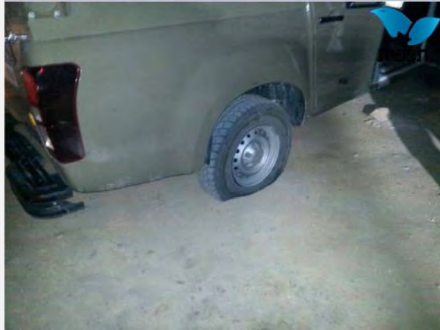
Un vehículo militar con los neumáticos pinchados (7 de abril de 2014)