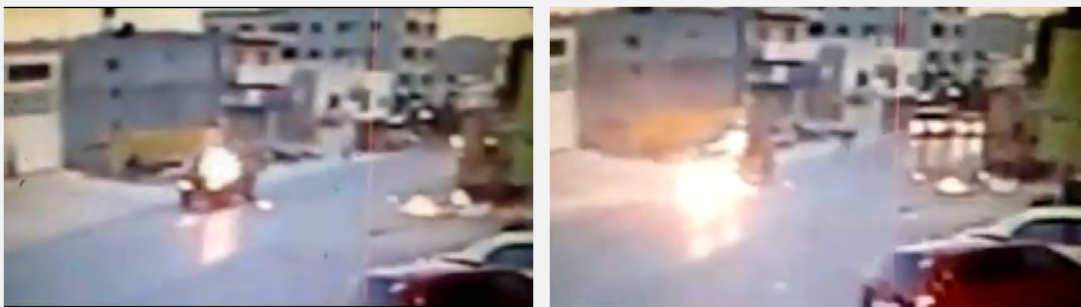
Lanzado de bombas Molotov en dirección a un jeep de la Guardia Fronteriza en Hawara (Video en el foro de Hamás, 6 de abril de 2014)

■ El 6 de abril de 2014 en horas de la tarde fueron lanzadas dos bombas Molotov en dirección a un vehículo de los policías de la Guardia Fronteriza cerca de Hawara (al sur de Nablus). Los que viajaban en el vehículo distinguieron al lado de ellos a un palestino que llevaba en sus manos una bomba molotov más, que tenía la intención de tirar en su dirección. Los policías abrieron fuego hiriendo al palestino (Policía de Israel, 6 de abril de 2014). Según parece esta era una emboscada planificada que incluso fue documentada en un Video presentado en la página facebook del foro de Hamás.