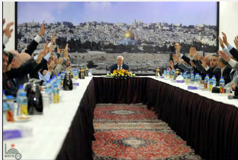
کادر رهبری تشکیلات خودگردان فلسطینی برای بررسی بحران عمیقی که در گفت و گوهای صلح با اسرائیل بروز کرده است، در شهر رام الله تشکیل جلسه داد و اسرائیل را مقصر «شکست» معرفی کرد (خبرگزاری «وفا»، اول آوریل 2014).

محمود عباس به نشانه اینکه برای استقلال کشور فلسطین به سازمان ملل متحد و نهادهای بین المللی رجوع می کند، در برابر دوربین ها پیوستن «دولت مستقل فلسطین» به پانزده معاهده بین المللی را امضاء کرد 4 . سخن از معاهده هایی است که نیازی به رای گیری بر سر پیوستن آن در کار نیست. محمود عباس در همین حال در یک سخنرانی تاکید کرد که تشکیلات خودگردانی هنوز نسبت به پیمودن مسیر صلح با اسرائیل و پایان دادن به نزاع با اسرائیل از طریق گفت و گوی سیاسی، در کنار تعهد به «مقاومت مسالمت جویانه» پایبند است («الایام»، دوم آوریل 2014).