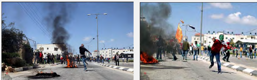
جوانان فلسطینی در برابر زندان «عوفر» که هزاران زندانی فلسطینی در آن نگاهداری می شوند، تظاهرات کرده و خواهان اجرای تعهد اسرائیل برای آزادی گروه چهارم از این زندانیان هستند.