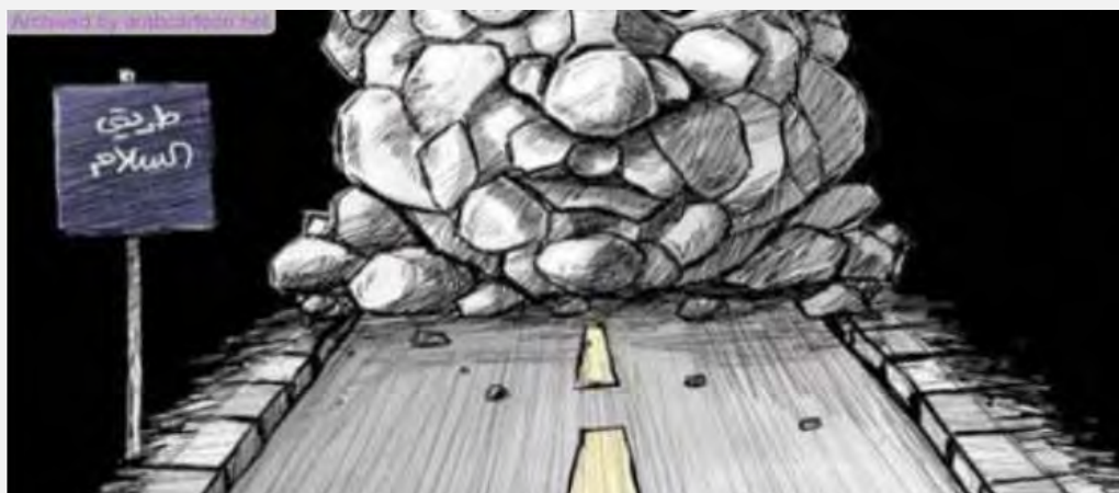
کارتون روزنامه فلسطینی القدس که نشان از بن بست بزرگ در مسیر گفت و گوهای صلح دارد. بروی تابلو نوشته شده است: جاده صلح (که با سنگ های بزرگ مسدود شده است) (روزنامه القدس، دوم آوریل ۲۰۱۴).

■ تشکیلات خودگردان فلسطینی با اقدام خویش در مطرح کردن درخواست رسمی پیوستن دولت مستقل فلسطین به معاهده های سازمان ملل ظاهراً خواسته است، روی تند و قاطعی به اسرائیل نشان دهد. همزمان، مقامات فلسطینی گفتند که بازگشت آنها به مسیر صلح به انجام شماری شرط از سوی اسرائیل بستگی دارد. صائب عریقات مذاکره کننده ارشد فلسطینی و نیز محمد العلول عضو کمیته مرکزی جنبش فتح در این رابطه به این پیشنهادها اشاره کردند: دریافت نامه رسمی از سوی نخست وزیر اسرائیل که مرزهای سال ۱۹۶۷ برای کشور فلسطین را قبول دارد، آزادی ۱۲۰۰ زندانی امنیتی فلسطینی، رفع حصر غزه و آزادی کار گذرگاههای غزه، بازگرداندن فلسطینی هایی که در جریان رخدادهای موسوم به «انتفاضه دوم» در اوایل سال ۲۰۰۰ میلادی از کرانه باختری رانده شدند ۵ ، توقف ساخت و سازها در یهودی نشین های کرانه باختری و شرق بیت المقدس، خروج اسرائیل از مناطق فلسطینی موسوم به «ای»، خودداری اسرائیل از قتل افراد تحت تعقیب فلسطینی، واگذاری امور امنیتی مناطق «سی» به تشکیلات فلسطینی و دادن اجازه به پانزده هزار فلسطینی برای ورود به اسرائیل جهت «اتحاد با خانواده های عرب خود (رسانه های اسرائیلی و خبرگزاری «معان»، سوم آوریل ۲۰۱۴).