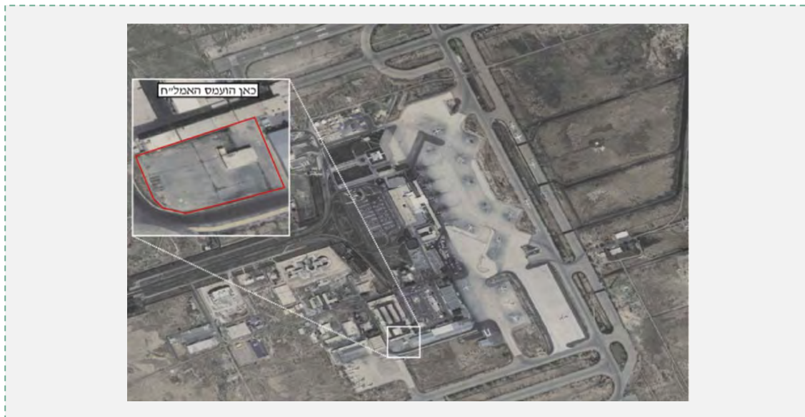
Обнаружение погрузки вооружений в Сирии (пресс-служба Армии Оборона Израиля, 5 марта 2014 года)

террористическим организациям. Перемещение ракет из Дамаска в Иран вызвало подозрение, поскольку в основном производятся действия в обратном направлении – оружие обычно поступает из Ирана в Сирию, а не из Сирии в Иран.