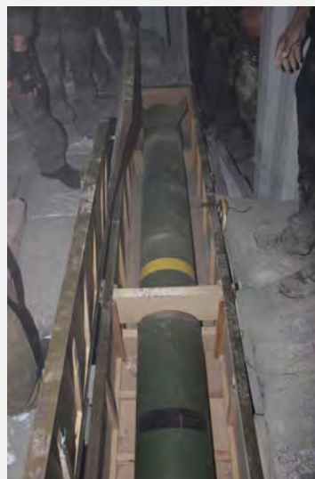
Ракеты дальнего радиуса действия М-302, которые были обнаружены на судне (пресс-служба Армии Оборона Израиля, 5 марта 2014 года)