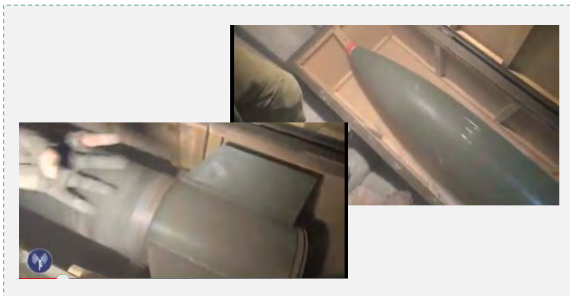
Ракеты М-302, которые были найдены в трюмах судна (5 марта 2014 года)

7. На судне были обнаружены ракеты М-302, которые предназначались для террористических организаций, действующих в секторе Газа. Ракеты М-302,