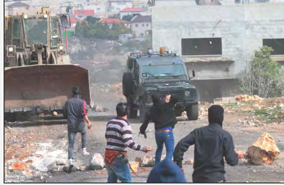
فلسطينيون يرشقون قوات أمنية إسرائيلية بالحجارة في كفر قدوم خلال المظاهرة الأسبوعية (وفا، 14 شباط / فبراير 2014)