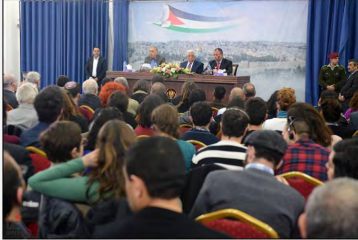
لقاء أبو مازن بطلبة إسرائيليين (وفا، 16 شباط / فبراير 2014)

■ في 16 شباط / فبراير 2014 عقد أبو مازن لقاء بوفد من الشباب الإسرائيليين في المقاطعة برام الله، وقد استعرض خلاله القضايا الأساسية الجاري بحثها، مؤكدا التزام السلطة الفلسطينية بعدم العودة إلى العنف وسفك الدماء فيما لو فشلت المساعي الأمريكية.