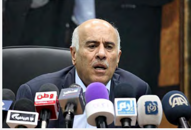
المؤتمر الصحفي الذي عقده جبريل الرجوب، ليدعو فيه إلى مقاطعة إسرائيل رياضيا (موقع اتحاد كرة القدم الفلسطيني، 12 شباط / فبراير 2014) (موقع اتحاد كرة القدم الفلسطيني، 12 شباط / فبراير 2014)

■ عقد جبريل الرجوب ، عضو اللجنة المركزية لفتح ورئيس اتحاد كرة القدم الفلسطيني مؤتمرا صحفيا في 12 شباط / فبراير 2014 في رام الله، أعلن خلاله أن اتحاد كرة القدم الفلسطيني شكل لجانا خاصة للعمل على الصعيدين الإقليمي والدولي للتوعية بممارسات إسرائيل ضد الرياضة الفلسطينية. وقال إنه يعتزم خلال لقاء وزراء الشباب والرياضة العرب والمسلمين المزمع عقده في نيسان / أبريل 2014، تقديم خطة لمقاطعة إسرائيل رياضيا (موقع اتحاد كرة القدم الفلسطيني، 12 شباط / فبراير 2014). يشار إلى أنها ليس أول مرة يعمل فيها جبريل الرجوب، باعتباره رئيسا لاتحاد كرة القدم، على مقاطعة إسرائيل على الملاعب الدولية.