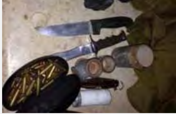
بعض الوسائل القتالية التي تم ضبطها (الناطق بلسان جيش الدفاع الإسرائيلي، 5 شباط / فبراير 2014)