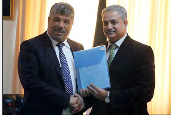
ساند الكوني، وزير الحكم المحلي في السلطة الفلسطينية يسلم وزير الزراعة وليد عساف ملف الجدار والاستيطان (وفا، 10 شباط / فبراير 2014)

■ أقيمت في رام الله في 10 شباط / فبراير 2014 مراسم تم فيها تسليم ملف مقاومة الجدار والاستيطان من ساند الكوني ، وزير الحكم المحلي في السلطة الفلسطينية، إلى وليد عساف ، وزير الزراعة. وفي هذا الإطار تم نقل الاختصاص والموظفين والميزانية إلى وزارة الزراعة الفلسطينية. ودعا وليد عساف خلال المراسم إلى تفعيل "المقاومة الشعبية" مثلما حصل في عين حجلة. وحضر المراسم عبد الله أبو رحمة ، من كبار ناشطي المقاومة الشعبية في الضفة الغربية (صفحة وزارة الزراعة للسلطة الفلسطينية على الفيس بوك، 10 شباط / فبراير 2014).