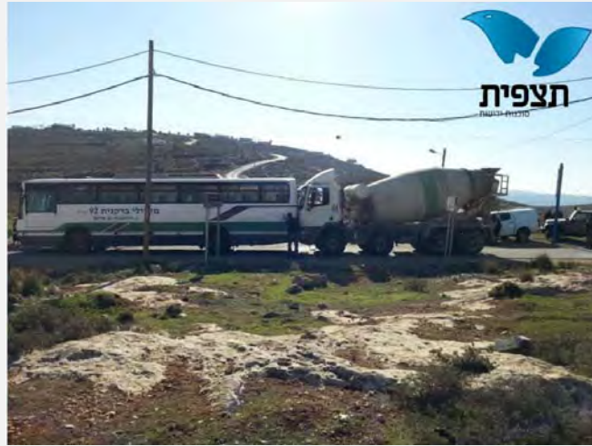
تصادم السيارتين على مقربة من شيلو نتيجة الرشق بالحجارة (5 شباط / فبراير 2014)