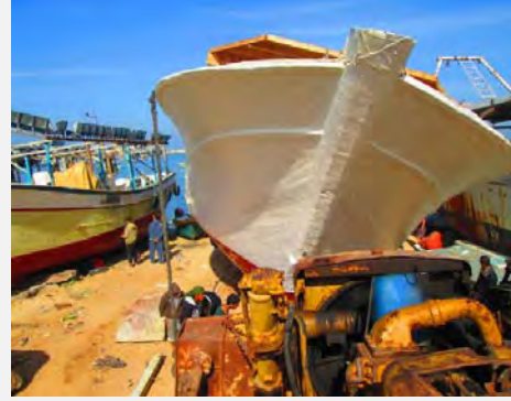
إنزال السفينة إلى البحر , 8 شباط / فبراير 2014