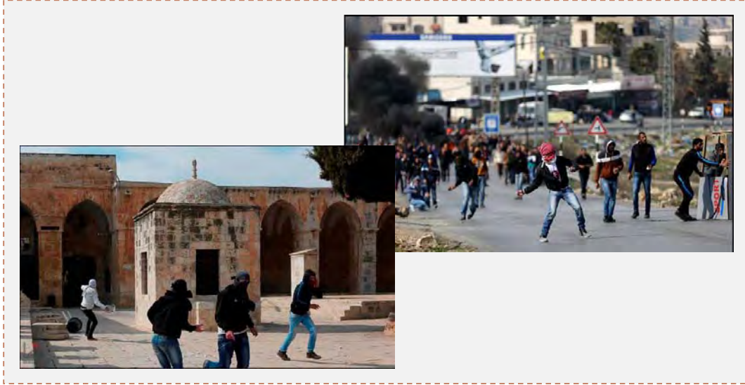
على اليمين: فلسطينيون يرشقون الحجارة على قوات جيش الدفاع الإسرائيلي خلال مواجهات في مخيم الجلزون المجاور لبيت إيل (وفا، 7 شباط / فبراير 2014). على اليسار: مواجهات في الحرم القدسي (وفا، 7 شباط / فبراير 2014)