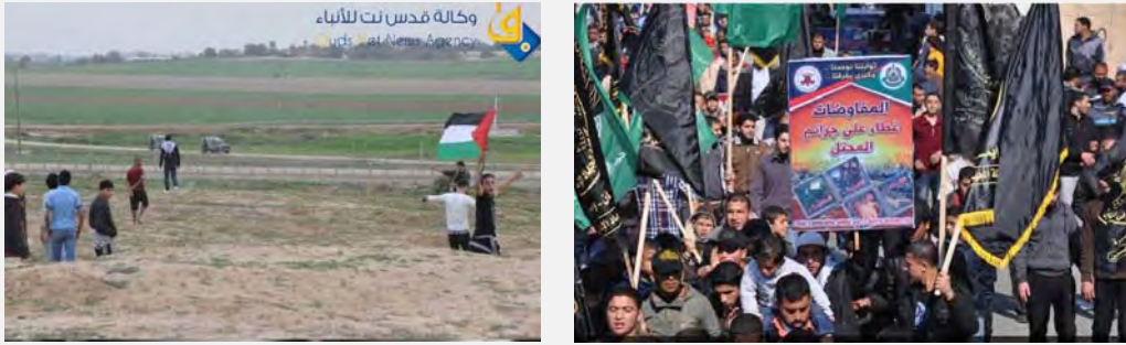
على اليمين: مظاهرة مشتركة لحماس والجهاد الإسلامي (بال تودي، 7 شباط / فبراير 2014). على اليسار: بعض الشباب الفلسطينيين يقربون من السياج الأمني شمال القطاع وشرقي جباليا (قدس نت، 8 شباط / فبراير 2014)

■ وفي الوقت نفسه تجمع عدد من الشباب الفلسطينيين عند السياج الأمني في منطقة ناحال عوز، حيث أفادت وسائل الإعلام الفلسطينية بإصابة أربعة من سكان قطاع غزة بجروح جراء إطلاق النار من قبل قوات جيش الدفاع الإسرائيلي إلى الشرق من جباليا (شمال قطاع غزة) (فلسطين أون لاين، الرسالة نت، 7 شباط / فبراير 2014).