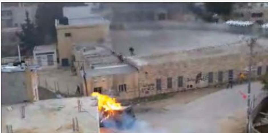
Внедорожник Армии Обороны Израиля, в который была брошена бутылка с зажигательной смесью (страница Facebook деревни Дир Абу Машаль, 26 января 2014 г.)