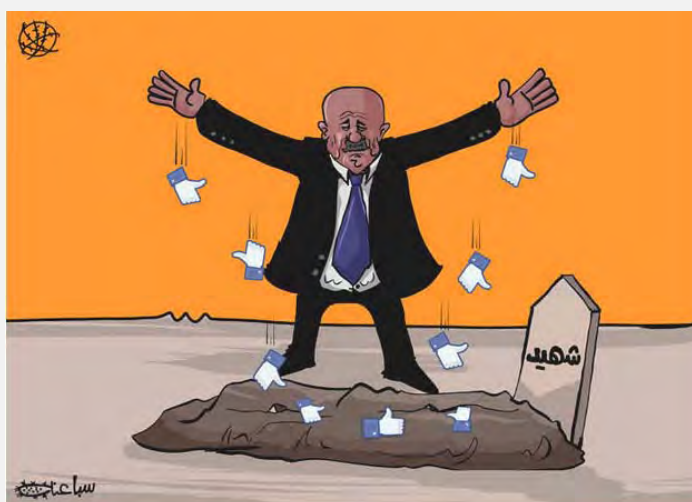
Карикатура из ежедневного издания аль Хаят аль Джедида, идентифицируемого с Палестинской автономией, показывающая радость в связи с захоронением террористов. «Likes шахиду» (аль Хаят аль Джедида, 26 января 2014 г.)