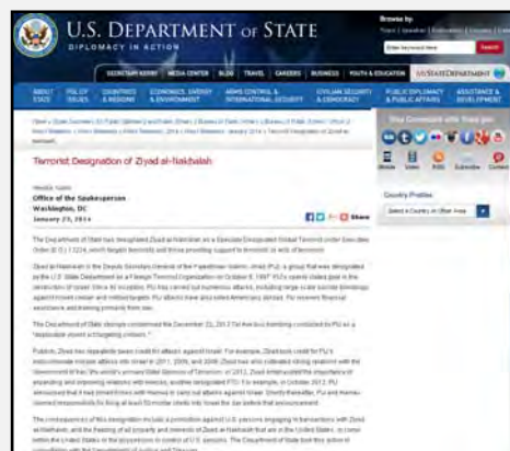
Справа: официальный плакат госдепартамента США с информацией о Зияде аль Нахала (интернет-сайт Госдепартамента США, 14 января 2014 г.). Слева: Зияд аль Нахала (Pal Today, 23 января 2014 г.)