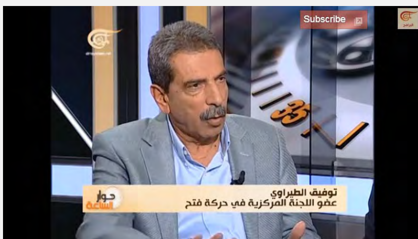
Тауфик аль Тирауи дает интервью ливанскому телеканалу аль Миадин

организации должны вернуться к «действиям». Возвращение к действиям означает «сопротивление во всех его формах» (читай: народное сопротивление – это вооруженное сопротивление). Согласно его утверждению, переговоры – это лишь одна из форм сопротивления, которое необходимо укрепить путем реальных действий. Следует составить палестинский национальный стратегический план, который будет выполняться всеми организациями, и для каждого из его этапов будет выбран подходящий путь сопротивления. Аль Тирауи также напомнил, что в заключительной части шестой конференции ФАТХа, которая состоялась в Бейт Лехеме в 2009 г. не шла речь об отказе от какой-либо возможности сопротивления, в том числе и об отказе от вооруженного сопротивления (телеканал аль Миадин, 23 января 2014 г.).