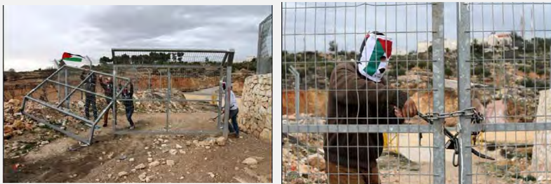
Действия в рамках «народного сопротивления». Палестинцы разрушают металлические ворота в поселке Эфрат, расположенном в Гуш Эционе (ВАФА, 26 января 2014 г.)