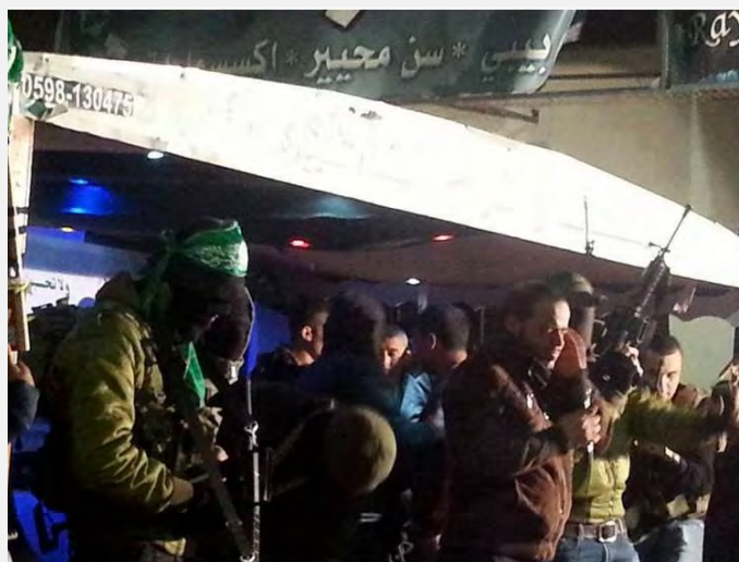
Вооруженные боевики Хамаса в масках в лагере беженцев Дженин во время митинга, посвященного памяти боевика Исламского джихада в Палестине Нафа аль Саади, который погиб 18 декабря 2013 г. во время действий Армии Обороны Израиля (Фалястин аль Ан, 26 января 2014 г.)