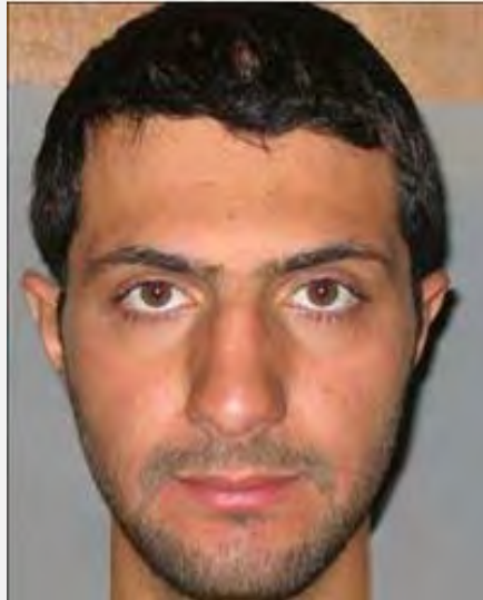
תמונה, ראשונה מסוגה, שפרסמו ב-27 בדצמבר 2013 בכירים במודיעין העיראקי המיוחסת לאלג'ולאני. לא ברור מתי צולמה התמונה. לדבריהם נחשפה התמונה בעקבות מעצר פעילי אלקאעדה בעיראק (אלספיר, 27 בדצמבר 2013). מהימנות הצילום עדיין טעונה אימות.

4. בפועל מייחס ג'בהת אלנצרה חשיבות רבה לסיוע לתושבים ולביסוס חלופה ממשלית למשטר הסורי באזורים שבשליטת המורדים המכונים "האזורים המשוחררים". לשם ייעול הסיוע לתושבים והפעלת השירותים הציבוריים הקים ארגון ג'בהת אלנצרה גופים ייעודיים, המכונים "הרשות השרעית" (קרי, הרשות ההלכתית). גופים אלו עוסקים בחלוקת מזון, בגדים, שמיכות ומוצרי צריכה נוספים ובהפעלת מנגנוני משפט, שיטור, חינוך, בריאות (פירוט ראו נספח). כתבים מערביים, שביקרו ב"אזורים המשוחררים" דיווחו במרבית המקרים על שביעות רצון התושבים מהחזרת החיים הנורמאליים לתקנם, לאחר שהמשטר הסורי קרס.