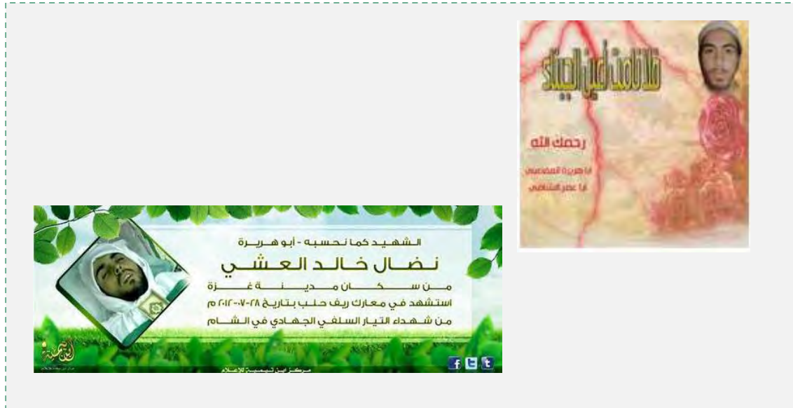
מימין: נצ'אל אלעשי ( http://www.longwarjournal.org , 28 ביולי 2012). משמאל: נצ'אל ח'אלד אלעשי בכרזה, שפורסמה לזכרו על ידי מועצת מרכז אבן תימיה

ביולי 2012). בהצהרה, שפורסמה עם מותו על ידי צבא האסלאם נאמר כי היה עצור על ידי חמאס לאחר שהתנכל לנוצרים ברצועה ולאחר מכן הוא נמלט לסוריה ( www.longwarjournal.org , 1 באוקטובר 2013).