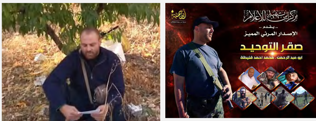
מימין: מוחמד אחמד קניטה משמאל: מוחמד אחמד קניטה, מקריא את צוואתו