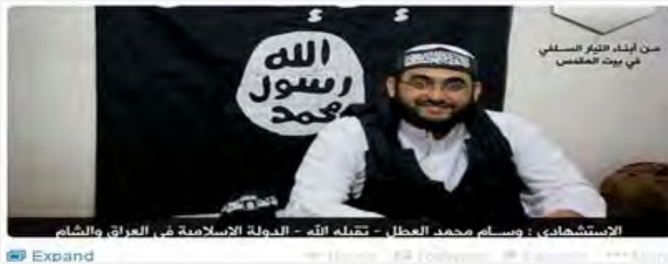
La page Twitter du Centre Ibn Taymiyya annonçant la mort de Wissam al-Atal (2 novembre 2013)