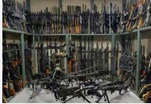
מחסן נשק, שעליו השתלטו פעילי ג'בהת אלנצרה, באזור הצפוני של פריפריית חמאה