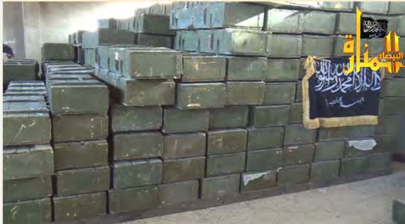
מקצת מארגזי נשק ותחמושת שנתפסו, עליהם הונח דגל ג'בהת אלנצרה

ארגון ג'בהת אלנצרה, שלוחת אלקאעדה בסוריה, נטל חלק מרכזי בהשתלטות קבוצות מורדים על מחסן נשק גדול של הצבא הסורי במהלך הלחימה באזור הכפרי של חמץ. אמצעי הלחימה שנתפסו, הכוללים רקטות וטילי נ"ט, יתרמו לשיפור יכולת הלחימה של הארגון והם עלולים גם להגיע לזירות אחרות של פעילות טרוריסטית בהם פועלים ארגונים המזוהים עם הג'האד העולמי