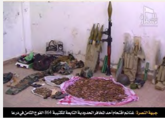
מטולי נ"ט אר.פי.ג'י שנתפסו ג'בהת אלנצרה ממחנה צבאי בעיר חלב באוקטובר 2012 (יוטיוב, דצמבר 2012)