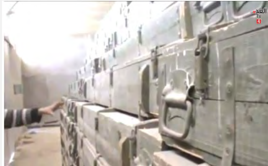
ארגזים ובהם רקטות גראד