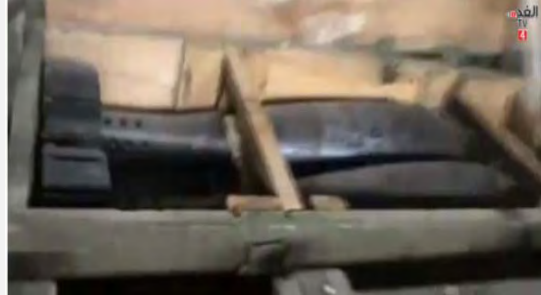
פצצות מרגמה 120 מ"מ