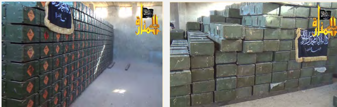
ארגזי נשק ותחמושת עליהם הונח דגל ג'בהת אלנצרה (jalnosra.com)