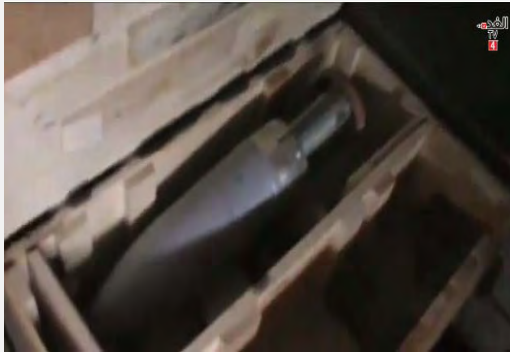
פצצות 130 מ"מ