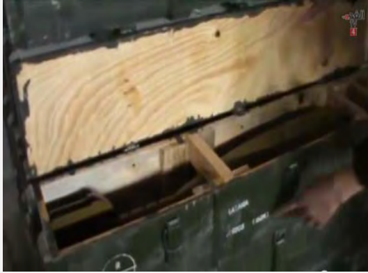
פצצות מרגמה 160 מ"מ