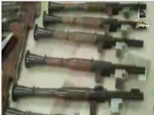
תמונה שהופיעה בחשבון הטוויטר של ג'בהת אלנצרה. ניתן להבחין ברובים, מקלעים, מטולי אר.פי.ג'י ומרגמה (twitter.com)