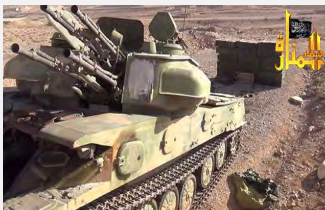
מערכת נ"מ שנתפסה במהין. המדובר כנראה במערכת נ"מ סובייטית מדגם Shilka ZSU-23-4