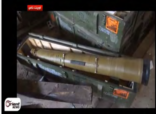
טילי נ"ט מדגם קונקורס