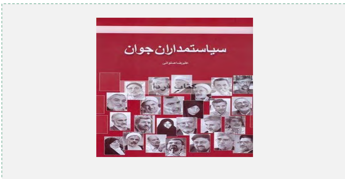
כריכת הספר "פוליטיקאים צעירים"