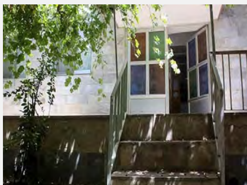
בית אביו של רוחאני

רוחאני הצליח בלימודיו ונחשב תמיד לתלמיד המצטיין בכיתה. לדבריו, הוא לא עבד במקביל לשעות הלימודים אלא רק בשעות אחר הצהריים, בהן סייע לאביו במשך שעה או שעתיים במכולת. רק בעונת הקיץ הוא היה נוהג לעבוד גם במשך היום.