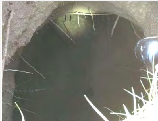
Туннель для террористической деятельности. На фотографии справа вход в туннель, слева – туннель внутри (13 октября 2013 г.)