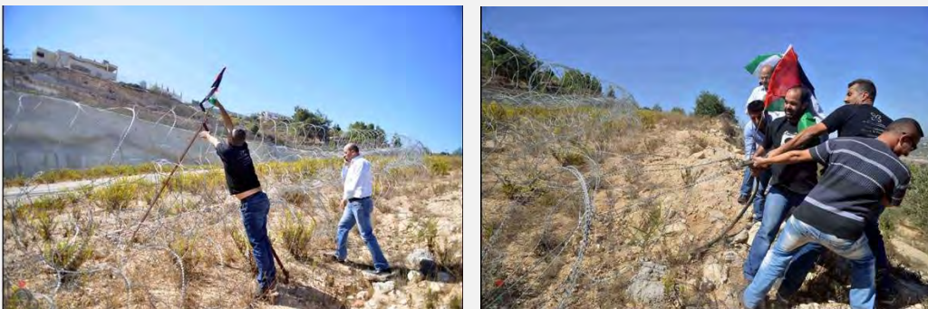
Во время посещения дипломатов палестинские боевики ломают забор безопасности, установленный в районе ишува Ар Гило (ВАФА, 11 октября 2013 г.)