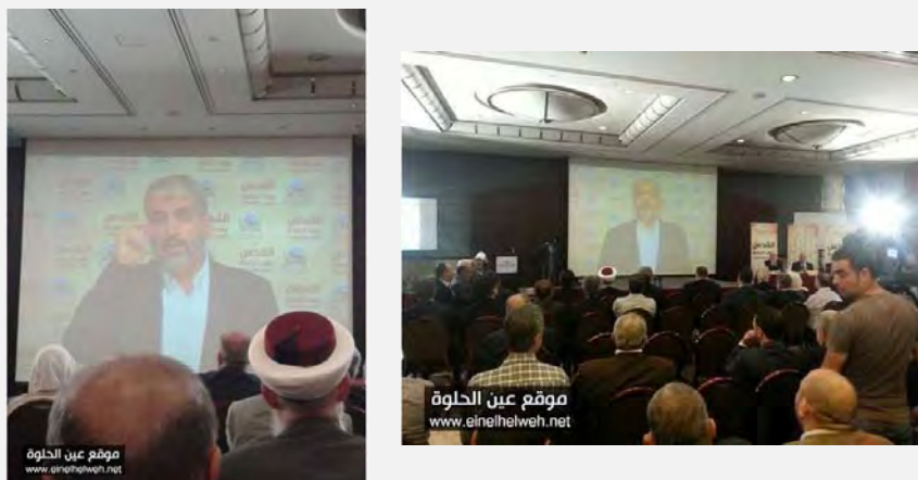
Выступление Халеда Машала транслируется на видеозкране во время конференции организации аль Кудс в Бейруте

■ Движение Хамас опубликовало призыв, призывающий с осторожностью относиться к намерениям еврейских элементов создать синагогу на территории мечети аль Акса. В тексте призыва говорится, что такие действия представляют собой «преступление сионистов» и отчаянный шаг, направленный на то, чтобы стереть следы ислама из мечети (Palestine Info, 12 октября 2013 г.).