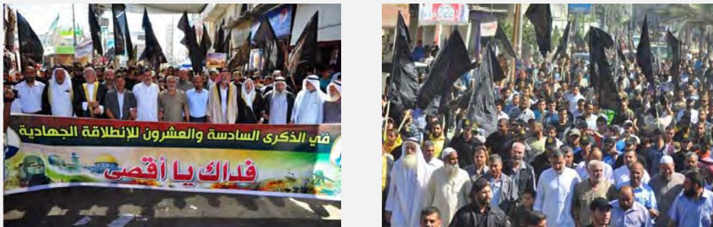
Демонстрация и митинг Исламского джихада за освобождение Палестины в Хан Юнисе (11 октября 2013 г.)