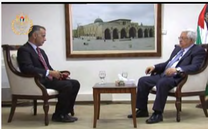
Махмуд Аббас во время интервью официальному телеканалу Палестинской автономии (Палестинское телевидение, 10 октября 2013 г.)