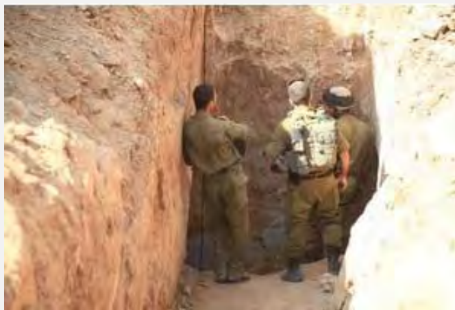
Военнослужащие Армии Обороны Израиля проверяют вход в туннель (13 октября 2013 г.)

■ Машир аль Масри , член законодательного совета от Хамаса, сказал, что Израиль пытается подогреть атмосферу путем публикации сообщений об обнаружении туннеля с целью устрожить блокаду, наложенную на сектор Газа (Quds net, 13 октября 2013 г.). Пресс-секретарь армейского крыла Хамаса Абу Авейда написал на своей странице в Twitter, что «сопротивление» может вырыть еще тысячи туннелей и что решимость членов сопротивления более важна, чем рытье туннелей в земле».