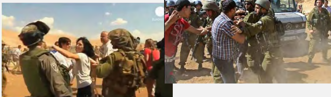
Справа: столкновение палестинцев с силами Армии Оборона Израиля (ВАФА, 20 сентября 2013 г.). Слева: женщина-дипломат из Франции атакует полицейского пограничных сил во время разгона демонстрации (видеосюжет, размещенный в YouTube, 20 сентября 2013 г.)