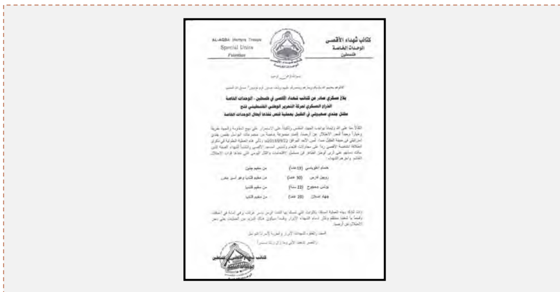
Плакат, свидетельствующий о том, что организация Батальоны мучеников аль Акса, армейского крыла ФАТХа, несет ответственность за стрельбу в Хевроне ( агентство новостей ONA, 22 сентября 2013 г.)