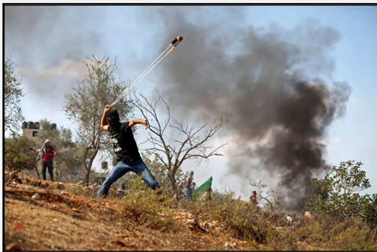
Столкновение палестинцев с силами Армии Обороны Израиля рядом с тюрьмой Офер (ВАФА, 27 сентября 2013 г.)

■ 27 сентября 2013 г. отмечалась годовщина начала второй интифады в различных местах Иудеи и Самарии. Несмотря на звучавшие на палестинской улице призывы провести в этот день демонстрации протеста, эти акции имели относительно ограниченный характер, и особые происшествия отмечены не были.