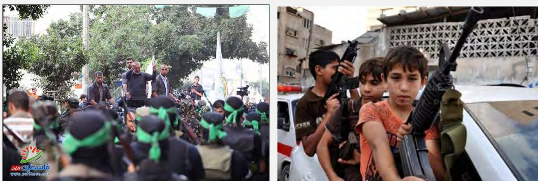
Справа: дети, участвующие в военной параде Хамаса в лагере беженцев аль Шати в Газе. Слева: Исмаил Хания, глава администрации Хамаса, на военном параде