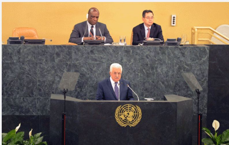
Махмуд Аббас выступает на генеральной ассамблее ООН в Нью-Йорке (ВАФА, 26 сентября 2013 г.)