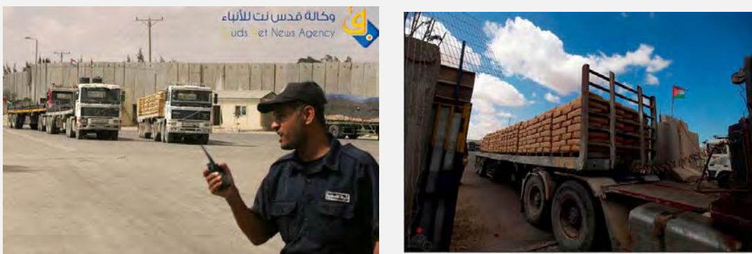
Справа: ввоз строительных материалов в сектор Газа через КПП Керем Шалом (23 сентября 2013 г.). Слева: полицейский из полиции Хамаса управляет ввозом товаров через КПП Керем Шалом (23 сентября 2013 г.)

■ Джамаль аль Худари , возглавляющий народную комиссию по устранению блокады, наложенной на сектор Газа, сказал в ответ на решение Израиля, что ввоза строительных материалов в частный сектор и в ограниченном масштабе через КПП Керм Шалом недостаточно для осуществления проектов, строительство которых ведется в секторе Газа. Он также сказал, что эти стройматериалы, которые ввозятся через КПП Керем Шалом, покроют лишь 20% потребности для всех проектов и не сумеют воспрепятствовать кризису в этой отрасли (Маан, 22 сентября 2013 г.).