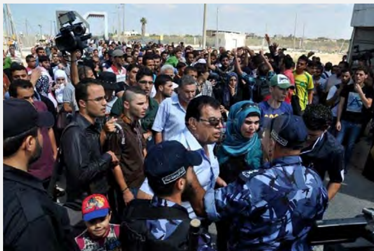
Палестинские жители протестуют против закрытия терминала Рафиях (Pal Today, 29 сентября 2013 г.)