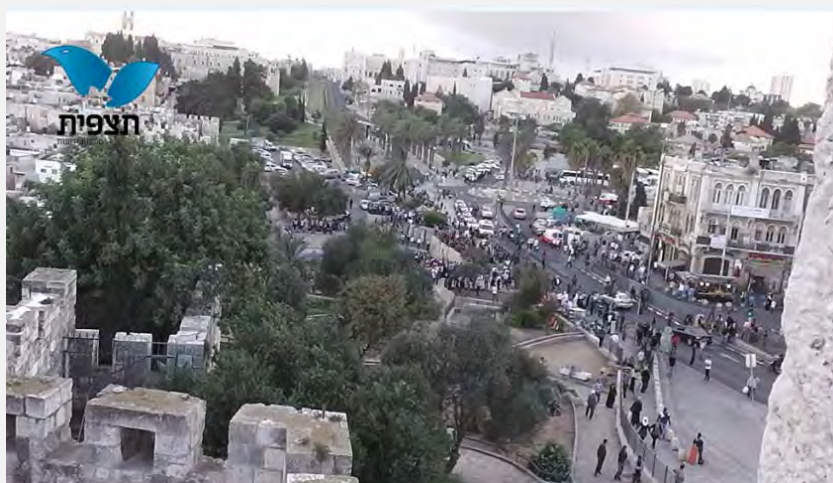
Демонстрации у Шхемских ворот