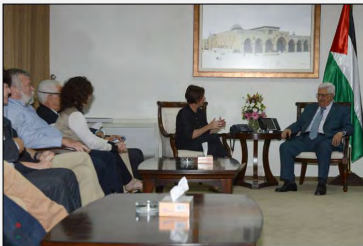
دیدار محمود عباس، ابومازن، با هیأت نمایندگان اسرائیلی حزب چپ گرای «مرتص» خاتم ذهابا گال اون رییس حزب «مرتص» در حال گفت و گو با ابومازن دیده می شود (عکس از خبرگزاری «وفا»، 22 اوت 2013)

■ محمود عباس، ابومازن، رهبر تشکیلات خودگردانی در دیداری که روز بیست و دوم اوت 2013 با هیأت نمایندگان مجلس اسرائیل از حزب چپ گرای «مرتص»، در رام الله، به عمل آورد، گفت فلسطینی ها بعد از رسیدن به پیمان نهایی صلح، دیگر هیچ ادعایی تاریخی علیه اسرائیل مطرح نخواهد کرد و خواهان تسلط بر شهرهای «ناصره»، «حیفا»، «عکا» و اماکن دیگر نخواهد شد. محمود عباس همچنین گفت با «توافق میانه» مخالف است اما آمادگی آن را دارد که پیمان نهایی صلح، به صورت «مرحله به مرحله» اجراء شود (روزنامه «هآرتص»، بیست و دوم اوت 2013). دفتر احقاق حق بازگشت پناهندگان فلسطینی پراکنده در جهان، وابسته به جنبش حماس، سخنان محمود عباس را نکوهش کرد و آنرا صرفنظر کردن از حق بازگشت فلسطینی ها نامید (وبسایت «فلسطین آلان»، بیست و ششم اوت 2013).