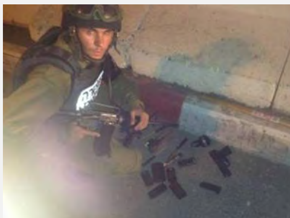
جنگ افزار سرد و گرم کشف شده از اتومبیل عرب فلسطینی شهروند اسرائیل در گذرگاه «بقاع» در شمال «شومرون» (سختگویی ارتش اسرائیل، 21 اوت 2013)