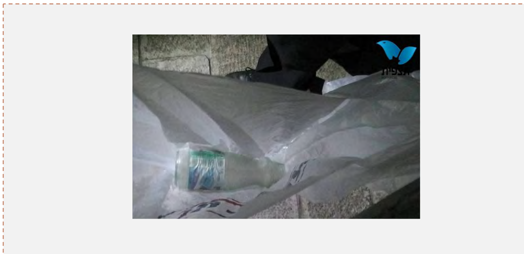
محل پرتاب بطری‌های آتش‌زا به سوی ساختمان «خانه گلها» در دروازه باستانی شهر اورشلیم (عکس از خبرگزاری «تسپیت»، 21 اوت 2013)