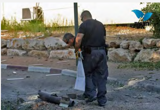
تصاویری از محل اصابت راکت های شلیک شده از جنوب لبنان به شمال اسرائیل (22 اوت 2013)