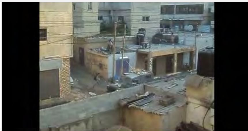
جوانان فلسطینی با انواع آلات که به دستشان می آید، از مقتول های آهنی گرفته تا آجر و بلوک سیمانی به سوی نیروهای اسرائیلی حمله ور می شوند (فیلم از یوتیوب، 26 اوت 2013)

■ یک افسر ارشد از شاخه مرکز ارتش اسرائیل که روند این رخدادها را در اردوگاه «قلندیه» را بررسی کرد، پس از بررسی های مقدماتی، اعلام کرد که واکنش ارتش اسرائیل بر اساس مقررات، و رفتاری درست بوده است. این افسر ارشد گفت خشونت فلسطینی های محل در برابر نیروهای اسرائیلی نشان دادند، «رخدادی غیرعادی و بشدت افراطی بود» (سخنگوی ارتش اسرائیل، بیست و ششم اوت 2013).