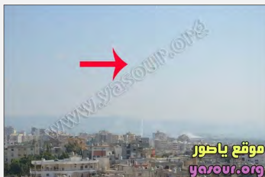
تصاویری از زمان حمله راکتی روز 22 اوت 2013 از جنوب بندر صور به سوی شمال اسرائیل