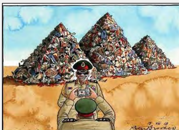
کارتونی از یکی از اتاق های اینترنتی طرفداران حماس که در آن ژنرال السیسی در حالی دیده می شود که در برابر «اهرام ثلاثه ای» ایستاده که از کشته ها پشته ساخته و به مانند «اهرام ثلاثه» دیده می شوند (حماس، 20 اوت 2013)