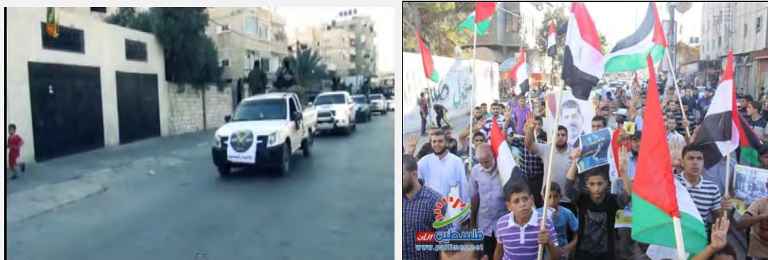
راست: راهپیمایی حماس در حمایت از اخوان المسلمین و محمد مرسی و نکوهش «کودتای ارتش در مصر» چپ: قدرت نمایی نیروهای شاخه «عزالدين القسام» در نزدیکی گذرگاه «الرفح». آنها نشانه های اخوان المسلمین را بر خوردروها قرار دادند