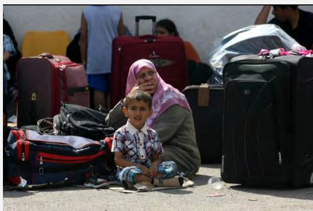
فلسطینی های منتظر در گذرگاه «الرفح» (عکس از وبسایت «فلسطین الآن»، 24 اوت 2013)

■ همزمان، انتقال مصالح ساختمانی از مصر به خاک نوار غزه جهت اجرای پروژه های کلان ساخت و ساز که با بودجه ی هدیه به مبلغ چهارصد میلیون دلار از سوی امیر قطر در دست ساخت است، بدون وقفه، ادامه دارد (وبسایت «پال تودی»، بیست و پنجم اوت 2013).