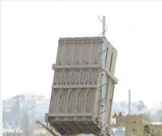
Droite : Le communiqué publié par le Conseil de la Shura des Combattants dans les environs de Jérusalem, groupuscule de Gaza proche du jihad mondial, revendiquant la responsabilité du tir de roquettes (Al-Fajr, Egypte, 13 août 2013). Gauche : Le système de défense anti-aérienne Dôme de Fer qui a intercepté une des roquettes tirées sur Eilat (Reuven Castro, NRG, 13 août 2013)