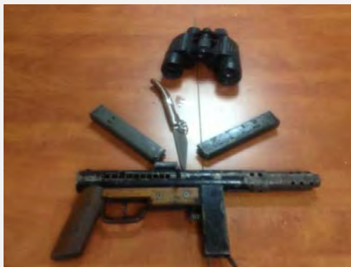
Droite : Armes trouvées (Porte-parole du district de Judée-Samarie, 13 août 2013). Gauche : Clous placés sur la route (Photo : Matanya Aharonowitz, Agence de presse Tazpit, 13 août 2013)