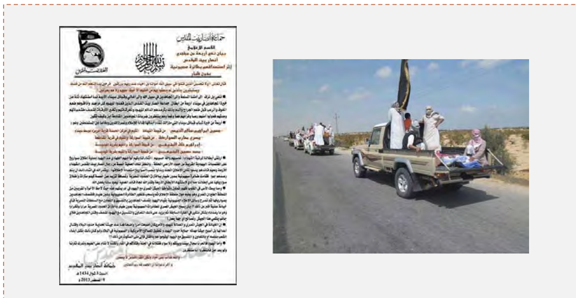
Droite : Funérailles des quatre terroristes à Cheikh Zoweid dans le Sinaï (PNN, 10 août 2013). Gauche : Communiqué officiel de leur décès publié par Ansar Bayt al-Maqdis (Sinayouth.com, 10 août 2013)