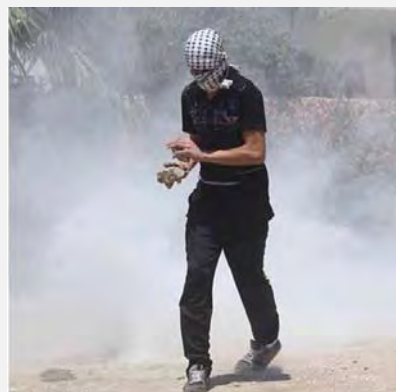
Confrontations entre Palestiniens et forces de sécurité israéliennes dans le village de Qadoum