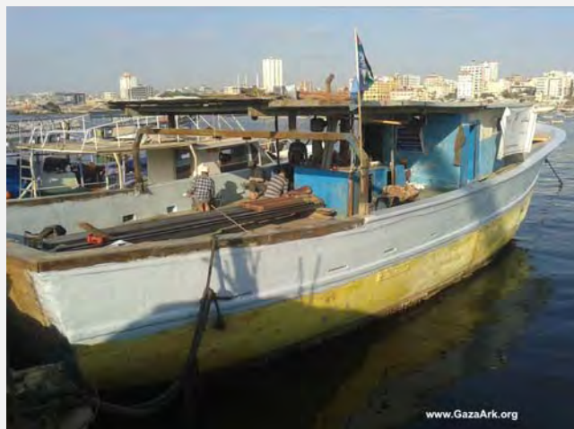
Processus de réhabilitation du navire ( www.gazaark.org , 13 août 2013)