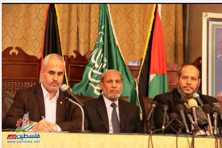
Conférence de presse organisée par le Hamas contre la reprise des négociations avec Israël