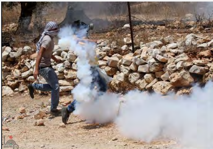
Enfrentamientos entre palestinos y las fuerzas de seguridad israelíes en Kalkiliya (WAFA, 2 de agosto de 2013)