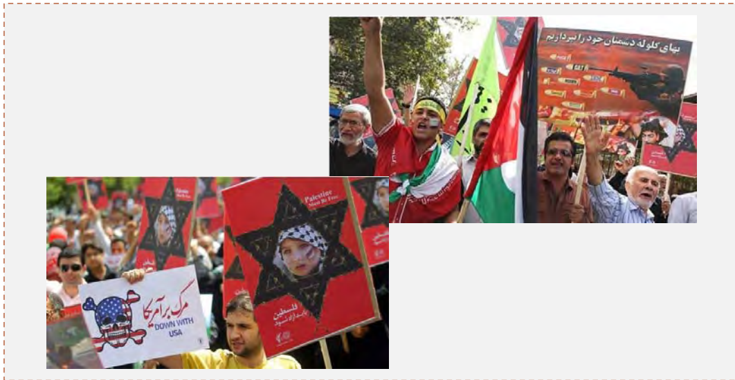
Eventos del día de Jerusalén en Irán (presstv.ir, 2 de agosto de 2013)

ocupación de Palestina y de la sagrada Jerusalén”. Ruhani evitó expresamente mencionar el nombre de Israel y esto permitió a los iraníes publicar una “aclaración” diciendo que sus palabras fueron desvirtuadas. Por otra parte, durante los eventos en Irán y en el Líbano, se dejaron oír llamados explícitos para la destrucción de Israel (por ejemplo, una pancarta que cita las palabras de Jamenai, “el regimen sionista tiene que colapsar” o el discurso de Hassan Nasrallah, que citó las palabras de Jumeini, según las cuales “Israel es un “tumor canceroso que hay que arrancar de raíz”).