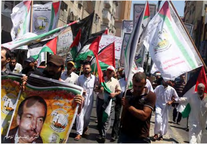
Manifestación en la Franja de Gaza el día de Jerusalén