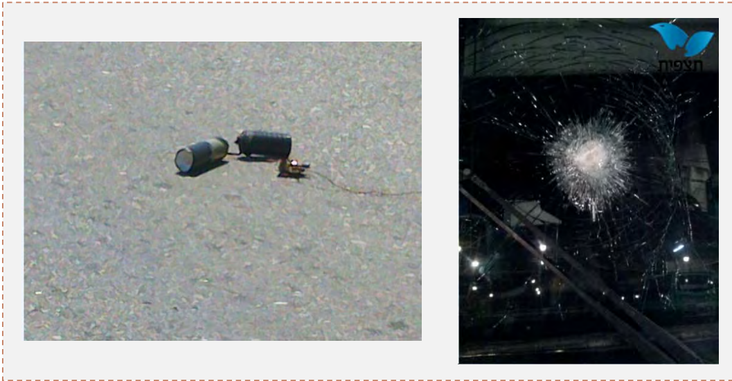
A la derecha: El autobús dañado por las piedras arrojadas (fotografía: Shneor Nahum Shojet – Agencia Tazpit, 5 de agosto de 2013). A la izquierda: Artefacto explosivo falso que se encontró en la ruta Alon (fotografía: Eljanan Shalom – Agencia Tazpit, 28 de julio de 2013)