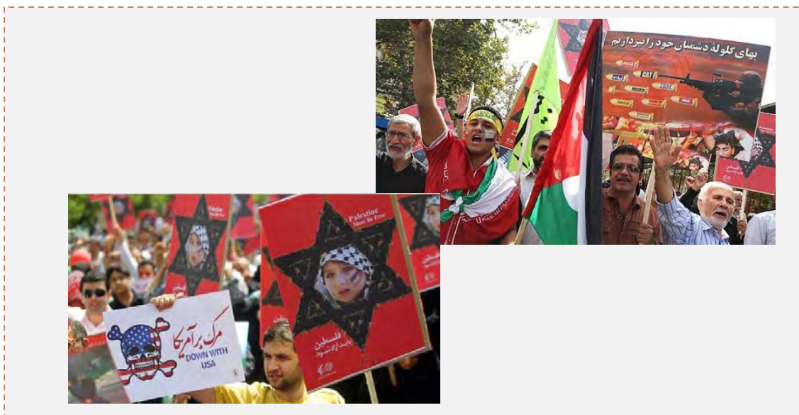
مراسم «روز قدس» در ایران (تلویزیون ایران، presstv.ir , دوم اوت 2013)

سخنان حسن نصرالله، که او نیز حرف های آیت الله روح الله خمینی را تکرار کرد: «اسرائیل غده سرطانی است که باید از ریشه کنده شود».