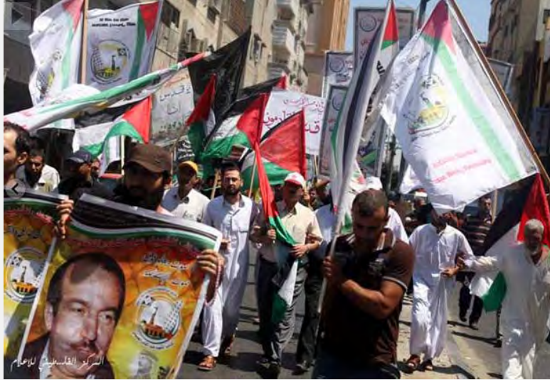
تظاهرات در نوار غزه در آستانه «یوم القدس»، دوم اوت 2013))