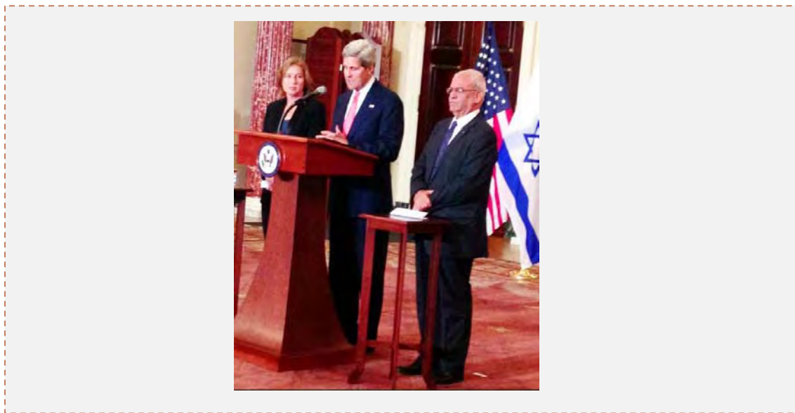
نتیجه گیری از دیدار هیأت های اسرائیلی و فلسطینی در واشنگتن (وبسایت تسیپی لیونی، سی و یکم ژوئیه 2013)

■ در پی پایان گفت و گوهای مقدماتی اسرائیلی – فلسطینی در واشنگتن و پس از دیدار باراک اوباما و وزیر خارجه آمریکا جان کری با تسیپی لیونی و صائب عریقات، سخنگوی کاخ سفید اعلام کرد که گفت و گو اسرائیلی – فلسطینی با میانجیگری ایالات متحده رسماً از سر گرفته شده است (وبسایت کاخ سفید، سی و یکم ژوئیه 2013).