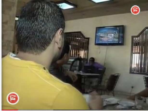
مواطنون فلسطينيون في إحدى مقاهي مدينة غزة يتابعون بترقب بالغ الأحداث في مصر (وكالة "معا" الإخبارية، 30 حزيران/يونيو 2013)