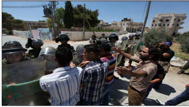
فلسطينيون يقومون بمواجهة قوات جيش الدفاع الإسرائيلي (قطاع بيت لحم) خلال المظاهرة الأسبوعية ضد الجدار الأمني والمستوطنات (وكالة الأنباء "وفا" الفلسطينية، 28 حزيران/يونيو 2013)

■ لقد تواصلت هذا الأسبوع أيضاً المواجهات والاحتكاكات العنيفة بين الفلسطينيين وقوات الأمن الإسرائيلية في مراكز الاحتكاك التقليدية في إطار ما يُسمى بـ"المقاومة الشعبية".