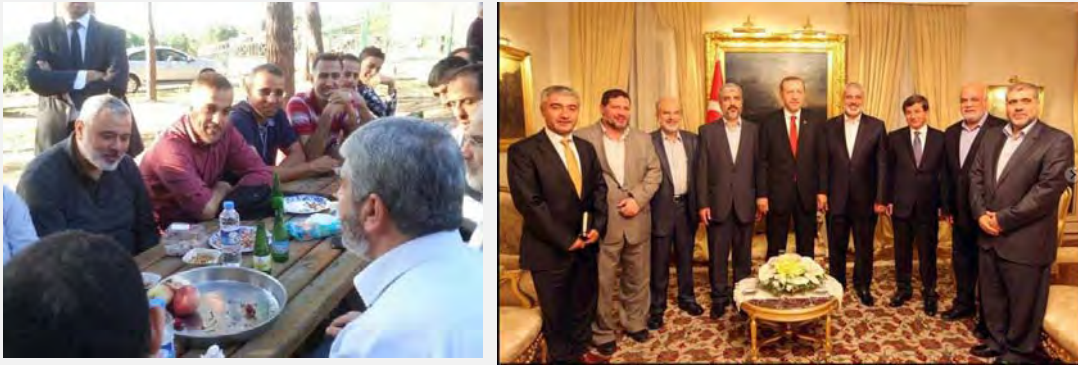
מימין: משלחת חמאס בפגישה עם ראש הממשלה ושר החוץ של תורכיה (פלסטין אינפו, 19 ביוני 2013). משמאל: ח'אלד משעל ואסמאעיל הניה בפגישה בתורכיה עם משוחררי עסקת שליט (פלסטין אל'אן, 22 ביוני 2013)