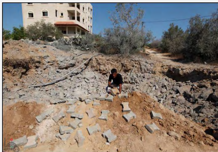
אחד מיעדי הטרור שהותקף ע"י צה"ל בעיירה אלזואידה, שבמרכז הרצועה (ופא, 24 ביוני 2013)