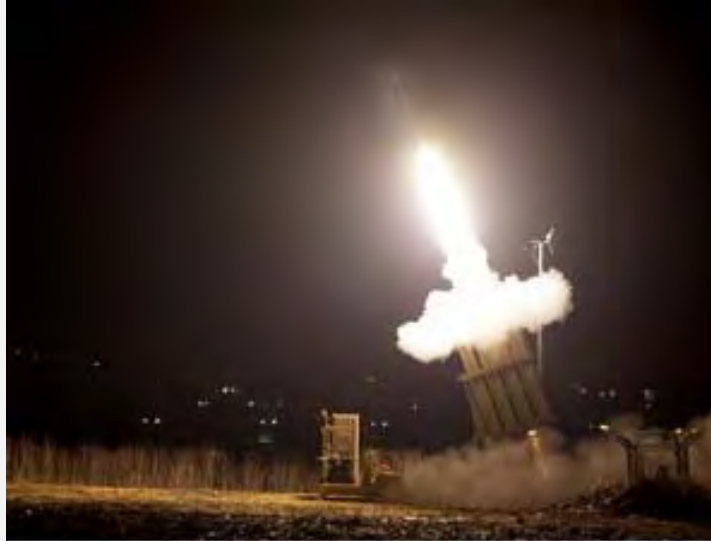
חמש נפילות רקטות בישראל שתיים מהן יורטו על ידי מערכת כיפת ברזל (NRG, 24 ביוני 2013 צלם: אדי ישראל)