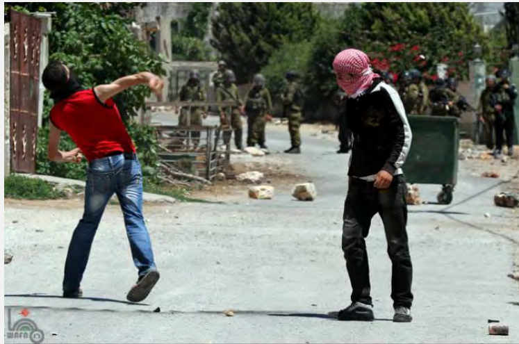
צעירים פלסטיניים מיידיים אבנים לעבר כוחות צה"ל במהלך ההפגנה השבועית בכפר קדום (סמוך לקלקיליה) (ופא, 21 ביוני 2013)

■ נמשכו עימותים וחיכוכים אלימים בין פלסטינים לבין כוחות הביטחון הישראליים במוקדי החיכוך המסורתיים, במסגרת מה שמכונה "ההתנגדות העממית".