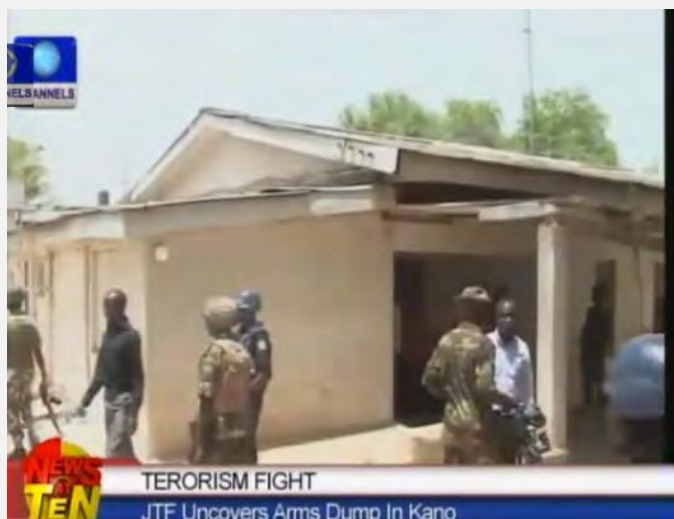
הבית בעיר קאנו בו נמצאו אמצעי הלחימה (http://www.channelstv.com , מאי 2013)

5. אמצעי הלחימה נמצאו במסתור בבית בעיר קאנו, סמוך מאד למפקדת המשטרה בעיר. המסתור, שנבנה במיוחד לצורך זה, היה ממוקם מתחת לחדר השינה, תחת שלוש שכבות בטון. אמצעי הלחימה הוטמנו בתוך מיכלים והיו עטופים על מנת לשמור עליהם. בחדר גם נבנה פתח מילוט למקרה של מעצר (allafrica.com, 10 ביוני 2013).