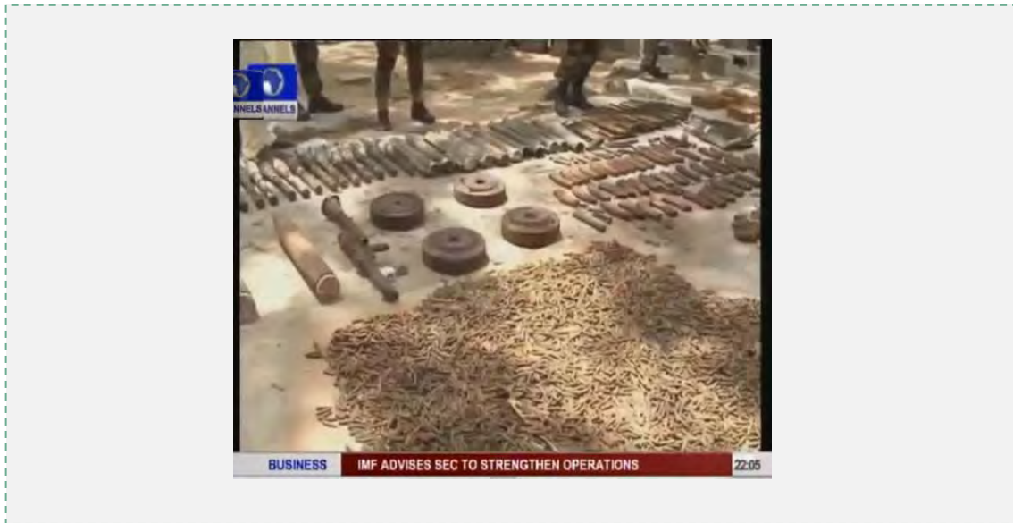
חלק מאמצעי הלחימה שנתפסו ( http://www.channelstv.com , מאי 2013)

6. אמצעי הלחימה, שנמצאו במסתור, כללו: 103 חבילות של חומר נפץ מסוג TNT , 76 רימוני יד, כלי נ"ט, תחמושת 122 מ"מ, ארבעה מוקשי נ"ט, 21 פצצות RPG, מטול RPG, תשעה אקדחים, תת מקלע, שתי מחסניות SMG, 17 רובים מסוג AK-47, 44 מחסניות עבור הרובים ותחמושת (allafrica.com, 31 במאי 2013). על פי הצילומים אמצעי הלחימה, שנחשפו היו במצב תחזוקה ירוד (ברובם חלודים).