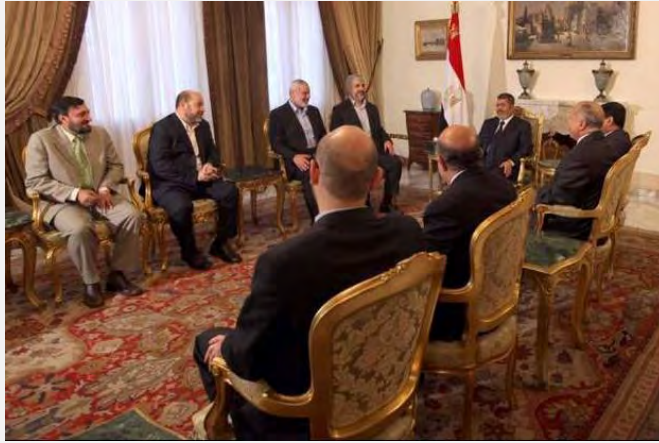
هیأت اعضای ارشد حماس در دیدار با رئیس جمهوری مصر محمد مرسی («فلسطین آنلاین»، هجدهم ژوئن 2013)