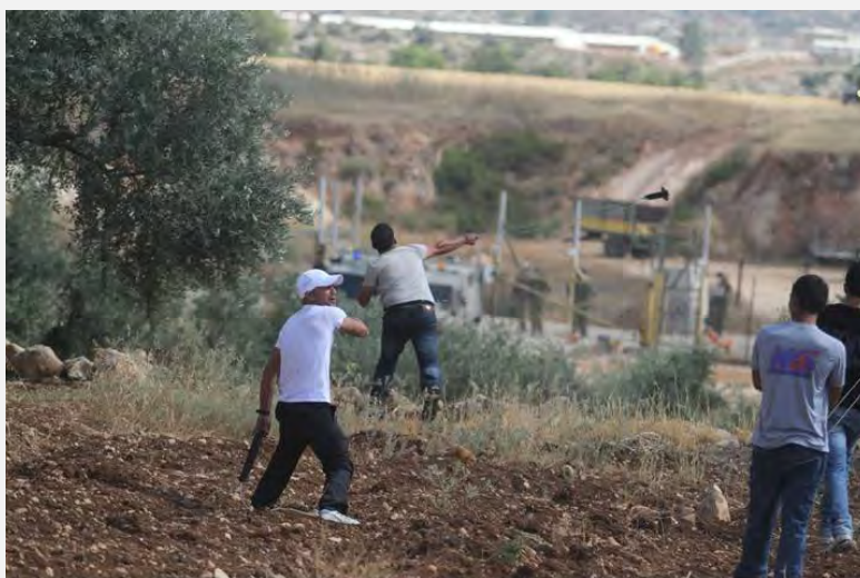
جوانان فلسطینی با نیروهای ارتش در جریان «راه پیمایی بازگشت به روستای لظرون» در غرب شهر رام الله درگیر شدند («پال تودی»، پانزدهم ژوئن 2013)