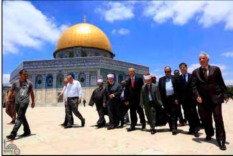
رامی حمدالله (در وسط عکس) نخست وزیر جدید حکومت خودگردان فلسطینی از تپه معبد مقدس دیدار می کند («وفا» شانزدهم ژوئن 2013)