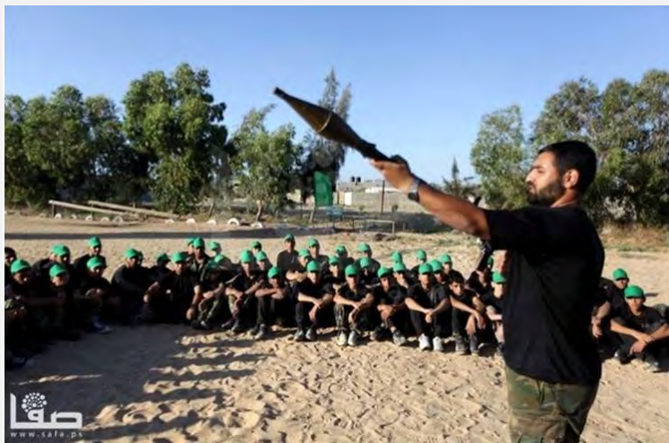
آموزش آتشباری RPG به کودکان در اردوی تابستانی حماس («فلسطین آنلاین»، شانزدهم ژوئن 2013)

■ حالا که تعطیلات تابستانی در نوار غزه در اوج خود می باشد - برای کودکان و نوجوانان اردوهای تابستانی توسط تشکل های صلح ستیز (حماس، جهاد اسلامی فلسطین) سازمان ها و محافل مذهبی و «اونرا» تشکیل داده شده است. همانند هر سال دیگر در این اردوگاه ها فعالیت های اجتماعی، اطلاعات اسلامی و آموزش های نیمه نظامی توأم گردیده است. اخیراً عکس هایی از این اردوهای تابستانی که توسط حماس تشکیل شده است انتشار یافت که بچه ها و نوجوانان در آنها در حال گذراندن تمرین و رهنمود نیمه نظامی و از جمله استفاده از اسلحه همانند RPG دیده می شوند. راهنمایان و مربیان کودکان و نوجوانان از فعالان شاخه نظامی حماس «بیگان های عزالدین قسام» هستند («صفا»، شانزدهم ژوئن 2013). پیشتر نیز عکس هایی از تمرین نظامی بچه ها در اردوهای تابستانی جهاد اسلامی فلسطین 4 منتشر شده بود.