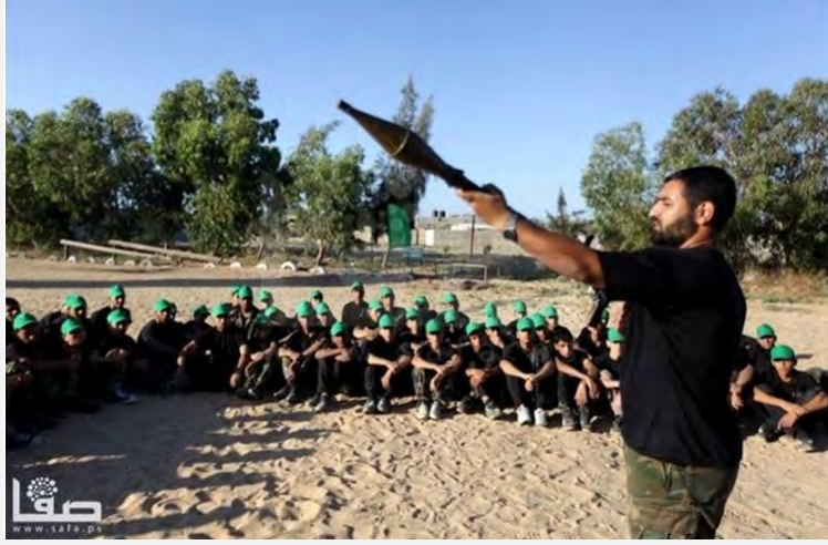
أطفال المعسكر الصيفي الذي تنظمه حركة حماس يتلقون الإرشادات في مجال إطلاق النار بالـRPG (موقع "فلسطين الآن" على شبكة الإنترنت، 16 حزيران/يونيو 2013)