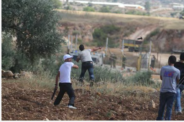
شبان فلسطينيون يقومون بمواجهة قوات جيش الدفاع الإسرائيلي أثناء "مسيرة العودة إلى قرى لطرون"، غربي مدينة رام الله (موقع "بال تودي" على شبكة الإنترنت، 15 حزيران/يونيو 2013)