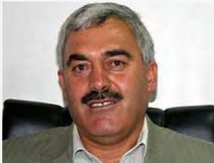
Shawan Jabarin : membre du FPLP et dirigeant d'une organisation des droits de l'homme ( http://www.rfi.fr )