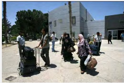
إعادة فتح معبر رفح الحدودي أمام حركة المسافرين الفلسطينيين في أعقاب إطلاق سراح الجنود المصريين المختطفين (موقع "فلسطين الآن" على شبكة الإنترنت، 22 أيار/مايو 2013)