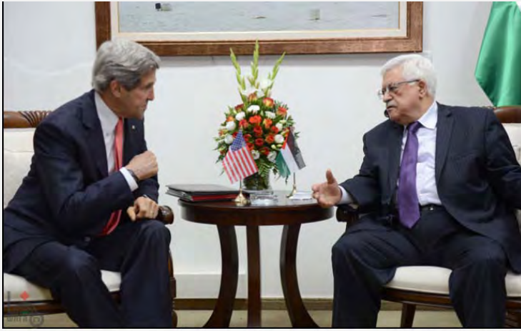
أبو مازن يجتمع في رام الله مع وزير الخارجية الأمريكي، جون كيري (وكالة الأنباء "وفا" الفلسطينية، 23 أيار/مايو 2013)

■ إن زيارة وزير الخارجية الأمريكي، جون كيري، إلى السلطة الفلسطينية وإسرائيل وسلسلة الاجتماعات التي قام بعقدتها لم تُحرز أي تقدم فيما يتعلق بإزالة الجمود المسيطر على الصعيد السياسي ولم تُفض إلى الإعلان عن استئناف المفاوضات. وعند اختتام زيارته قال كيري إنه على كلا الطرفين أن يتخذا خلال الفترة القليلة القادمة قرارات صعبة لاستئناف المفاوضات إذ أن الوضع القائم لا يُمكن له أن يستمر وإنه على قادة كلا الطرفين العمل على التوصل إلى تحقيق السلام (صحيفة "الحياة الجديدة"، 25 أيار/مايو 2013).