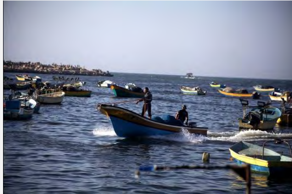
صيادو الأسماك الفلسطينيون في شاطئ البحر في غزة