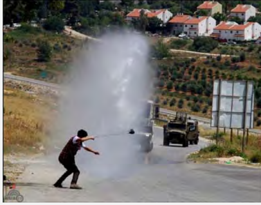
شاب فلسطيني يقوم برشق الحجارة باتجاه قوات جيش الدفاع الإسرائيلي في قرية "النبي صالح" أثناء المظاهرة الأسبوعية ضد الجدار الأمني (وكالة الأنباء "وفا" الفلسطينية، 24 أيار/مايو 2013).