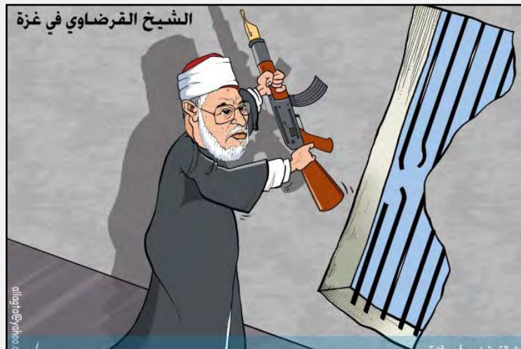
"השיח' אלקרצ'אוי בעזה" (פלסטין, 9 במאי 2013)