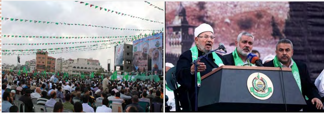
מימין : השיח' יוסף אלקרצ'אוי נואם בעצרת מרכזית, שארגנה לכבודו חמאס ברחבת כיכר אלכתיבה בעיר עזה (פלסטין אלאין, 10 במאי 2013). משמאל : העצרת המרכזית, שארגנה חמאס ברחבת כיכר אלכתיבה בעיר עזה (פורום חמאס, 9 במאי 2013)