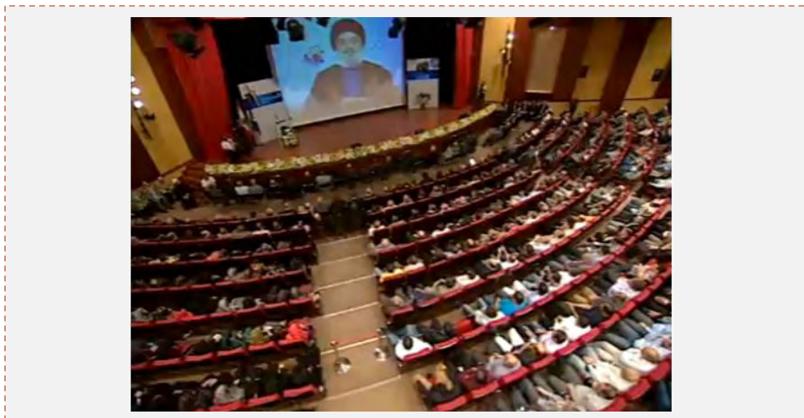
חסן נצראללה, מזכ"ל חזבאללה, נושא נאום דרך מסך וידיאו, לרגל 25 שנים לייסוד רדיו אלנור (אלעהד, לבנון, 9 במאי 2013)