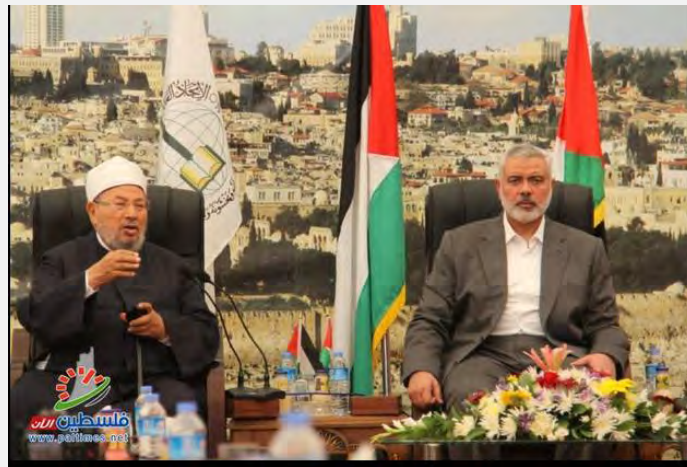
אסמאעיל הניה, ראש ממשל חמאס ברצועה, מארח את השיח' יוסף אלקרצ'אוי בבניין ממשל חמאס בעזה (פלסטין אלאין, 9 במאי 2013)