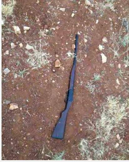
بنادقية الصيد التي عثر عليها في جعبة الفلسطيني بالقرب من قرية "دوما" (موقع المتحدث باسم جيش الدفاع الإسرائيلي على شبكة الإنترنت، 9 أيار/مايو 2013).