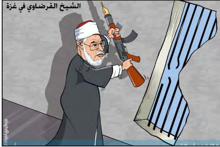
"الشيخ القرضاوي في غزة" (صحيفة "فلسطين"، 9 أيار/مايو 2013)