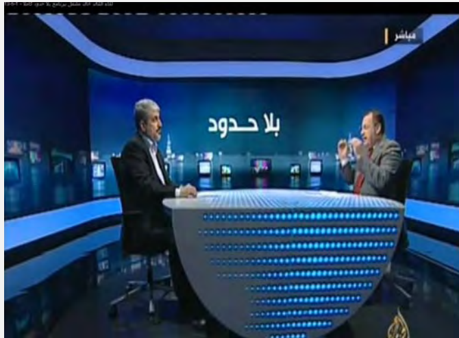
ח'אלד משעל בראיון לאלג'זירה

■ בראיון מקיף, שנערך עם ח'אלד משעל , ראש הלשכה המדינית של חמאס, לאחר שנבחר לתקופת כהונה נוספת הוא התייחס, בין היתר, לסדרי העדיפויות לפיהם יפעל בארבע השנים הקרובות. העדיפות הראשונה לדבריו תינתן ל"התנגדות" ובמרכזה ההתנגדות הצבאית המזוינת (קרי, הטרור באמצעות כלי נשק "חמים"). במקביל יתמוך החמאס ב"התנגדות עממית", שתתמודד עם ההתנחלויות, הגדר ובעיית האסירים. נושאים נוספים שימצאו במקומות גבוהים בסדר העדיפויות של החמאס הינם מניעת היהוד של ירושלים, שחרור האסירים הפלסטינים שבידי ישראל תוך שימוש בכל האמצעים האפשריים (קרי, חטיפת ישראלים), וקידום "זכות השיבה" של הפלסטינים (אלג'זירה, 2 במאי 2013).